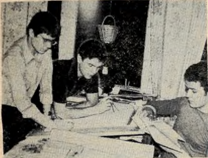
Нелегко доводиться майбутнім механікам, адже їм необхідно оволодіти цілим комплексом складних спеціальних дисциплін. Ось і затягується підготовка до занять до пізнього вечора...

В. КУЧИН, зав. кафедрою фізики, професор.