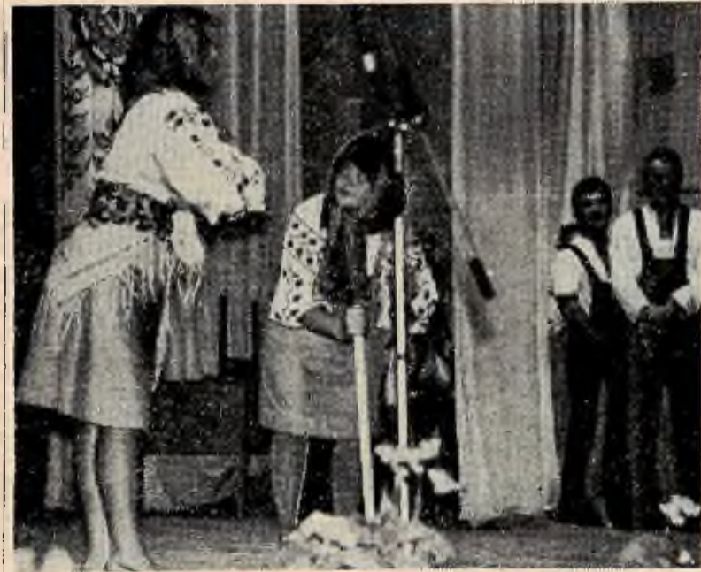
Виступає агіткультбригада факультету механізації сільського господарства.

В. МЕНДЖУЛ, керівник екскурсійної групи.