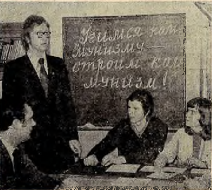
Йде атестація на ветеринарному факультеті академії.