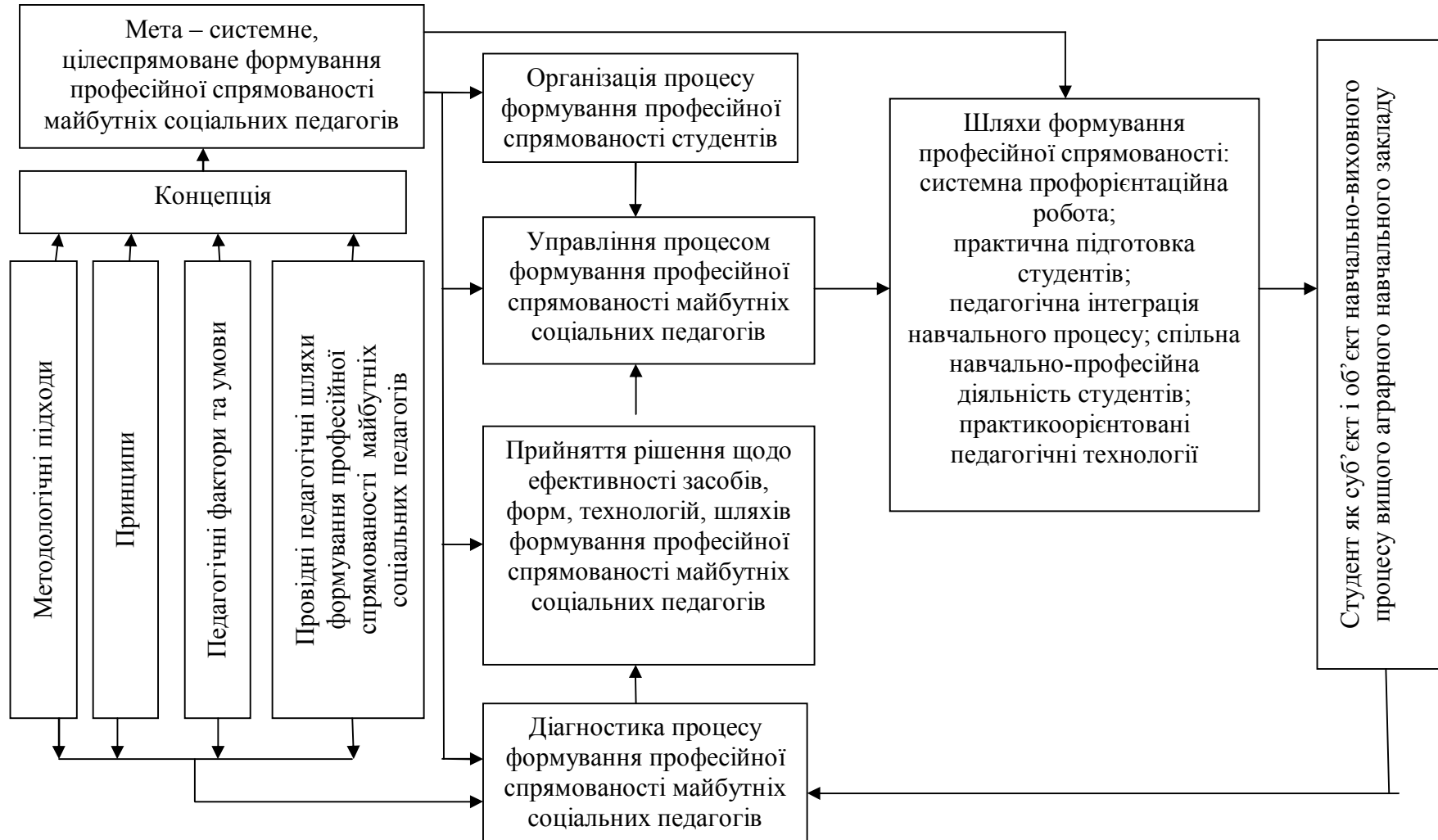
Рис. 1. Концептуальна модель педагогічної системи формування професійної спрямованості майбутніх соціальних педагогів у вищому аграрному навчальному закладі