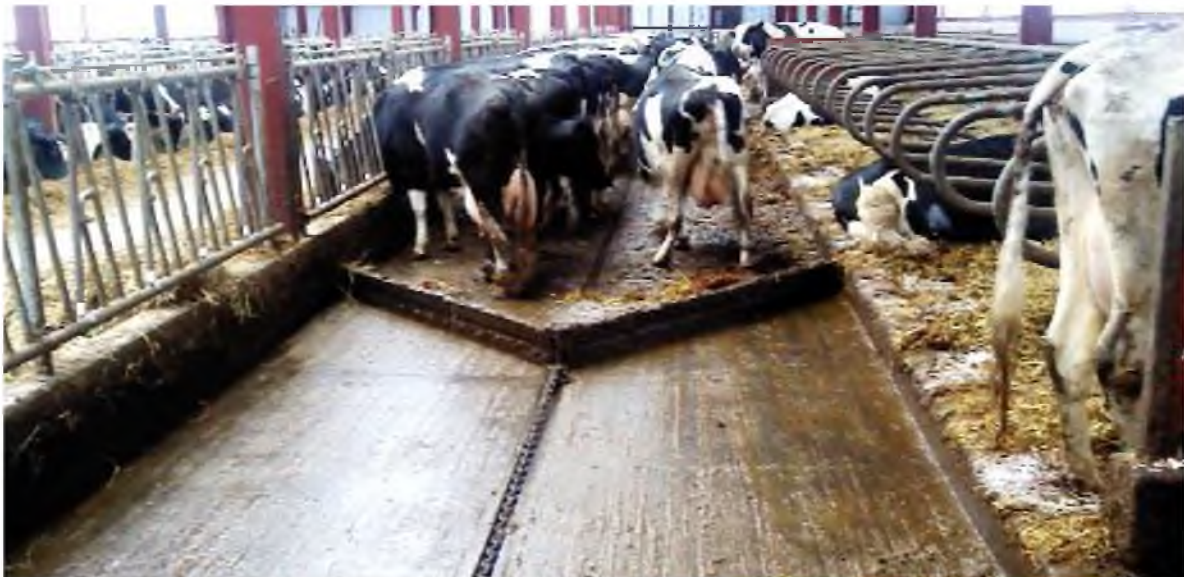
Рис. 2. Установка скреперна для прибирання гною типу УС

На сучасних фермах з безприв'язним утримування поголів'я для видалення гною переважно використовуються скреперні (дельта-скреперні) установки, виробництво яких в Україні освоєно декількома підприємствами, зокрема ТДВ «Брацлав» (рис. 2).