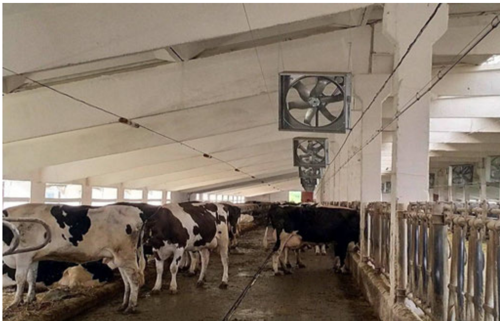
Рис. 3.1. Система охолодження і вентиляції приміщень для утримання ВРХ

розбризкування води під високим тиском через форсунки утворюючи так званий туман. Це забезпечує зниження температури в приміщенні на 6-12 0 С та підвищити ефективність молочного скотарства на 10-15 %.