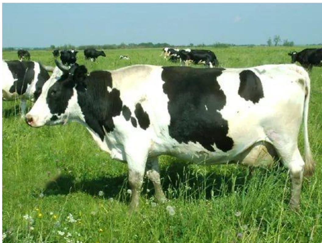
Рис. 1. Українсько-чорно ряба порода ВРХ ( https://sksumykhimprom.com.ua/?p=23739 )

До особливостей екстер'єру можна віднести: роги біло-сірого кольору з темнішими кінчиками не великі за розміром, голова подовжена із загостреною мордою, шия середньої довжини, вкрита складками, з нерозвиненою мускулатурою, глибина грудей 70-75 см, мають короткі, але міцні кінцівки, висота в холці 130-140 см, шерсть коротка, гладка (рис. 1) [33,38].