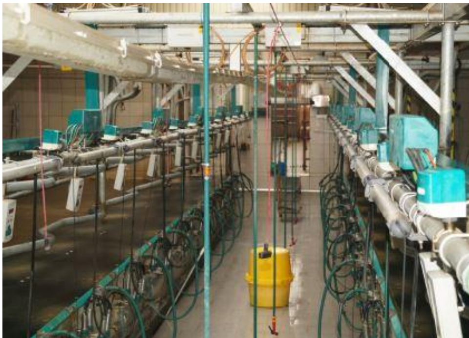
Рис. 3.2. Доїльний зал GEA Паралель

Для годівлі корів використовують кормовий стіл (рис.3.3), який оптимізований для автоматичної подачі кормів. Кормовий стіл розташований уздовж проходу, що дозволяє рівномірний доступ тварин до корму, його конструкція та організація суттєво впливають на споживання корму, рівномірність його розподілу та здоров'я тварин. Побудований з бетонною основою, що запобігає втратам корму та полегшує його очищення. Рівномірний доступ корів до корму сприяє правильному споживанню без перегодування або недоїдання кормів. Ця система годівлі сприяє збільшенню продуктивності ВРХ, мінімізує втрати кормів та покращує організацію