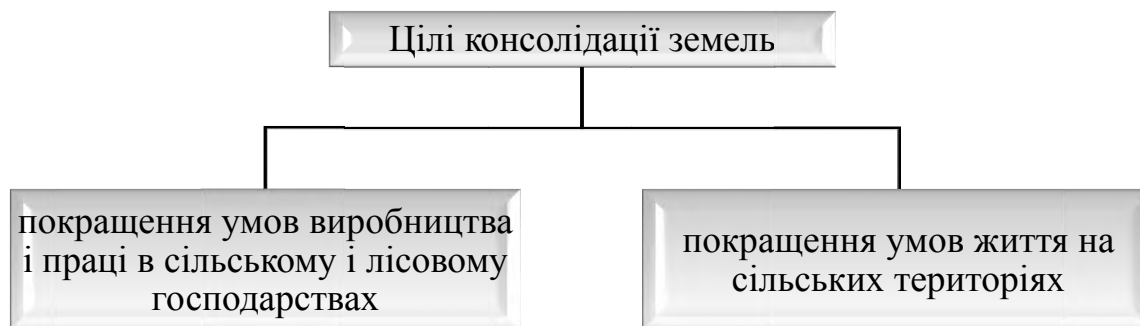
Рисунок 1. Цілі консолідації земель

Відповідно Стандартної процедури консолідації земель територія консолідації проходить реструктуризацію з урахуванням відповідної структури ландшафтів, а також відповідно до балансу інтересів учасників та інтересів загальної культури землекористування і регіонального розвитку, як це вимагає загальний добробут суспільства. Масиви земель отримують нове розмежування, а розпоршені або економічно недоцільно сформовані землеволодіння формуються згідно із сучасними виробничими вимогами щодо доцільного розташування, форми й розміру; слід створювати шляхи, дороги, водойми й інші громадські споруди, запроваджувати заходи із захисту й покращення ґрунту, заходи з формування ландшафтів, а також всі інші заходи, що покращують основи для господарювання підприємств, скорочують робочі витрати й полегшують виробничі умови. Можуть проводитися заходи з модернізації села; у планах забудови або в подібних інших планах не виключається залучення території населених пунктів до процедури консолідації земель. Необхідно впорядкувати правові відносини [4, с. 56].