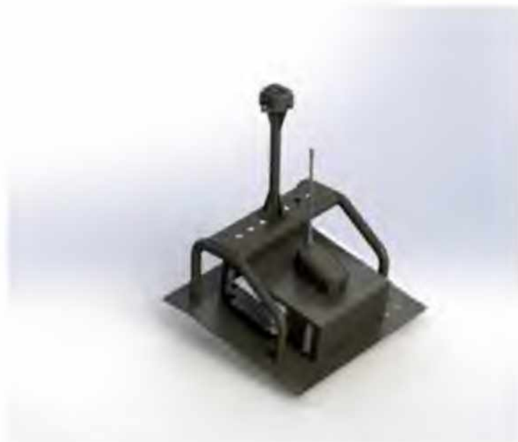
Рис. 1. Комп'ютерна ілюстрація зовнішнього

На рис. 1 показано загальний вигляд системи.