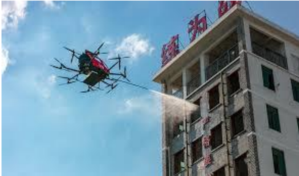
Мал. 1 – дрон EHang 216

Використання дронів у гасінні пожеж має безліч переваг. По-перше, дрони забезпечують оперативність, оскільки можуть бути швидко запуснені та направлені до місця займання, що істотно скорочує час реагування на надзвичайні ситуації. Це особливо важливо в умовах, коли час є критичним фактором для запобігання масштабним пожежам. По-друге, БПЛА здатні досягати важкодоступних районів, де традиційні засоби гасіння можуть бути неефективними або небезпечними для людських операторів. Дрони також забезпечують точність, оскільки завдяки інтеграції сучасних технологій, таких як GPS, камери та сенсори, можуть точно оцінити масштаби пожежі та визначити найбільш вразливі ділянки для гасіння. Крім того, дрони забезпечують збір даних у режимі реального часу, що дозволяє оперативно коригувати тактику гасіння.