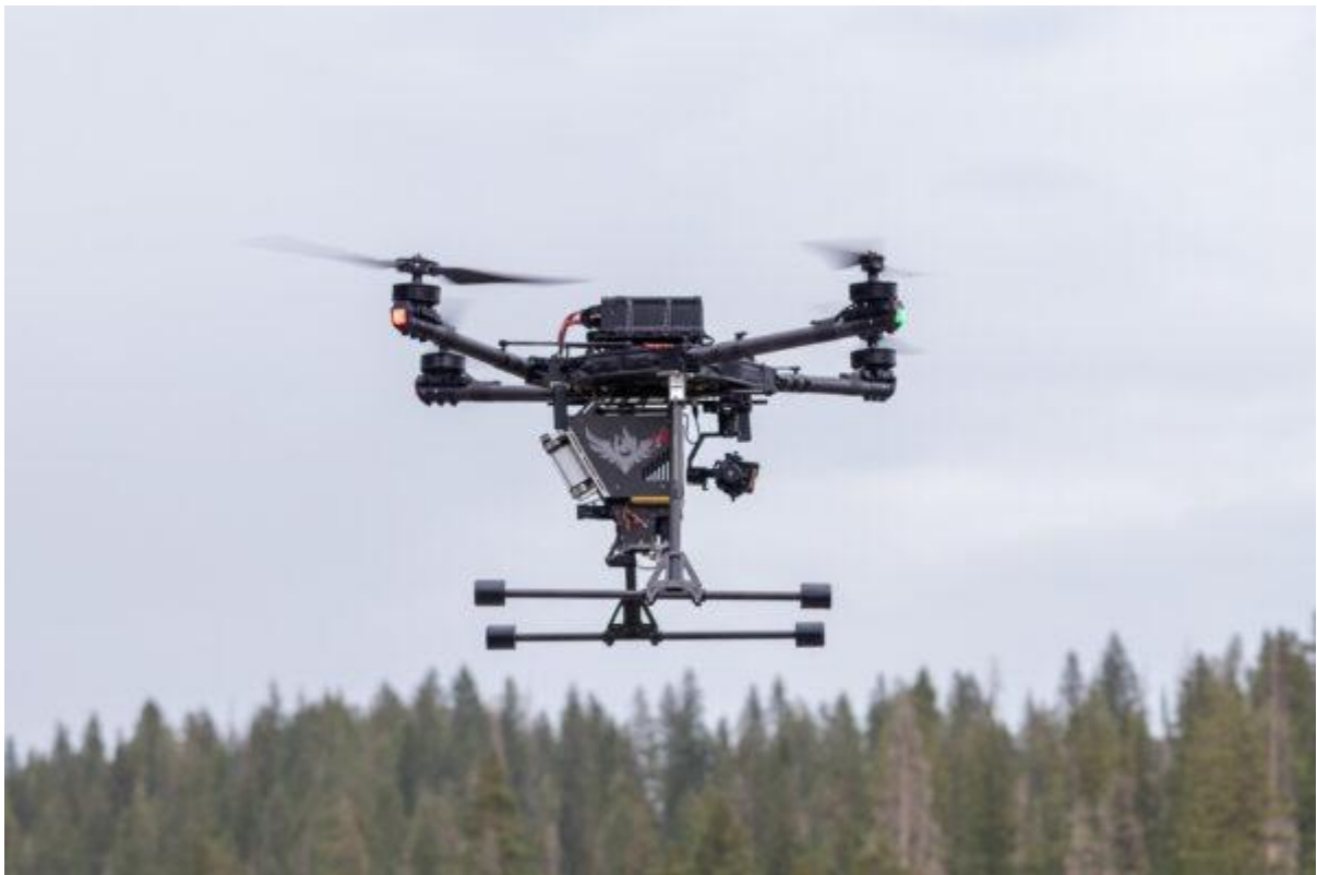
Мал. 1 – Дрон DJI Matrice 600