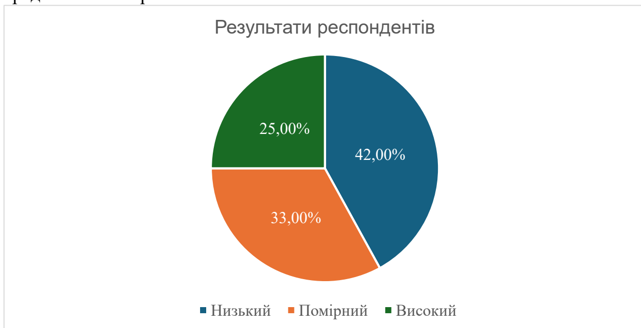
Рис. 2.1. Результати за методикою тест самооцінки стресостійкості С. Коухена та Г. Вілліансона

Першою методикою був обраний нами «Тест самооцінки стресостійкості С. Коухена та Г. Вілліансона», що дозволив виявити три рівні стійкості до стресів: низький, середній, високий. Отримані дані представлено на рис. 2.1.