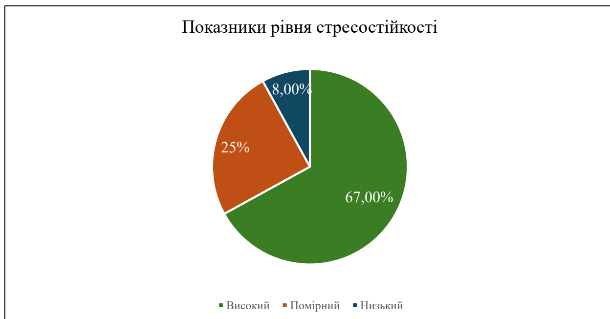
Рис. 2.4. Результати повторного діагностування

Загалом отримані дані свідчать не лише про ефективність тренінгової програми, а й про високу чутливість студентської молоді до психологічної підтримки та готовність працювати над собою у сприятливому середовищі.