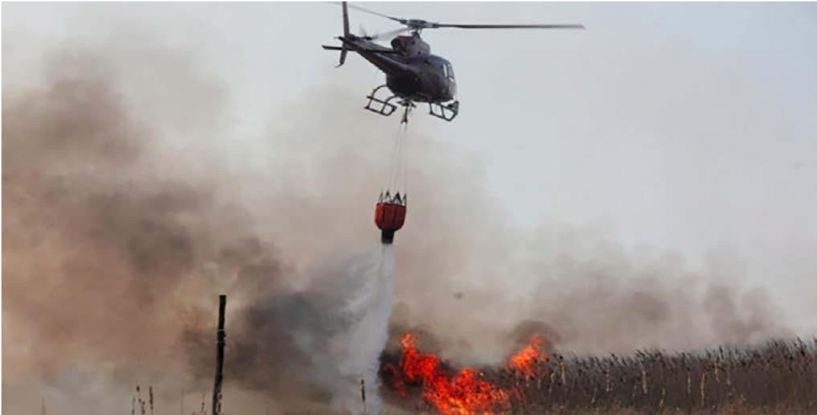
Рис. 1.4. Гасіння лісової пожежі за допомогою авіації

Для правильного вибору способів і технічних засобів ефективної локалізації пожежі, насамперед, потрібно визначити вид, інтенсивність та швидкість поширення пожежі, навколишньої природної обстановки та метеорологічних умов, наявності сил та засобів пожежогасіння, передбачених тактичних прийомів і термінів гасіння.