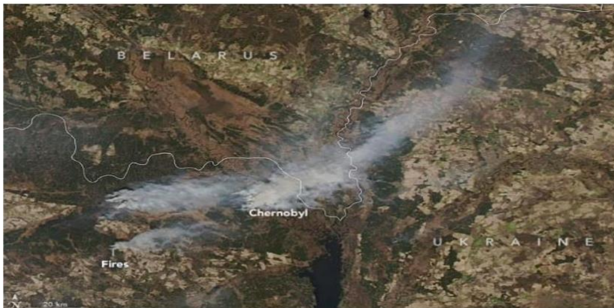
Рис. 3.1. Пожежа в зоні відчуження ЧАЕС, зафіксована супутниками

боролися з пожежею десять днів, було знищено понад 100 гектарів лісу. Крім того, кілька днів зашкалювали показники забруднення повітря в Києві та області [34, 35, 36].