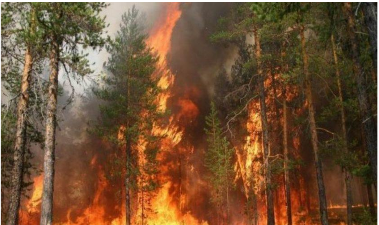
Рис. 1.1. Лісові пожежі

За кілька хвилин вогнем знищується те, що виросло за кілька десятиріч. Пожежа завдає величезної шкоди не тільки коли поширюється лише по землі і не переходить на крони дерев. При цьому горить лісова підстилка, гинуть корисні комахи і мікроорганізми. Вогнем ослаблюються дерева. На них нападають шкідники, що призводить до їх загибелі. Приклад лісової пожежі зображено на рис. 1.1.