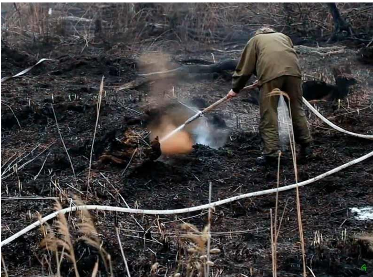
Рис.1.5. Застосуванні торф'яних стволів типу ТС-1

Кромку пожежі, в основному, гасять струменями води зі змочувачем без видалення палаючого торфу та використовують для цього торф'яні стволи ТС-1 (рис. 1.5.) і ТС-2.