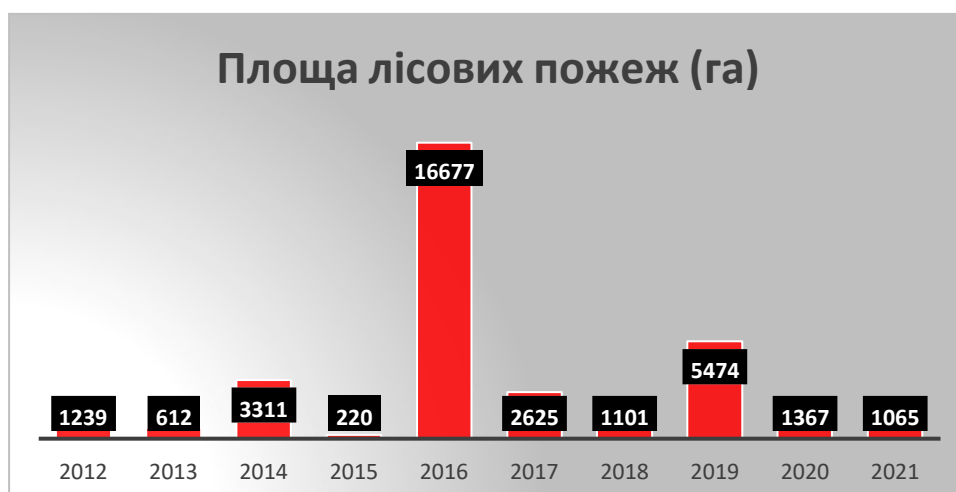
Рис. 3. Динаміка площ лісових пожеж за 2010-2021 роки

Найбільші пожежі (за площею) мали місце у 2014 та 2017 роках (рис. 3). Скорішеза все, узагальнена статистика 2020 року буде також невтішно [5, 6].