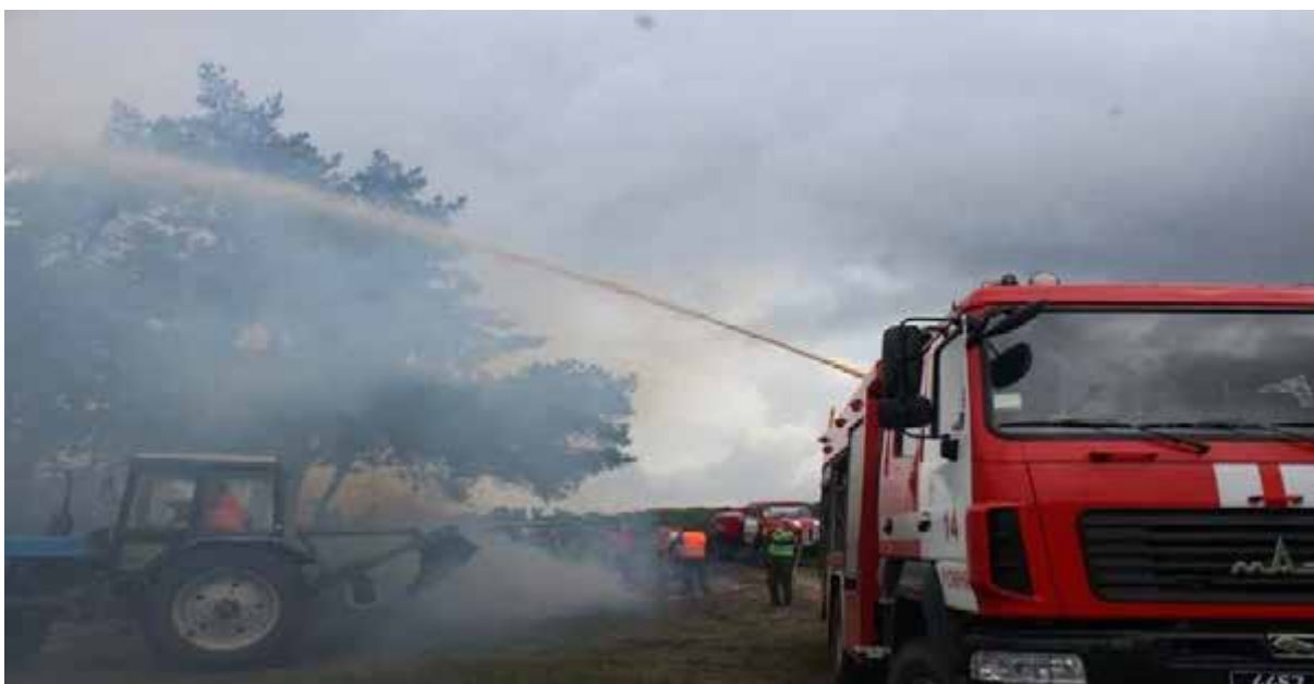
Рис. 1.2. Спецтехніка для проведення ліквідації пожежі

- порядок практичного та ефективного використання пожежної, господарської, інженерної техніки (рис.1.2), інших засобів пожежогасіння та вододжерел (рис. 1.3);