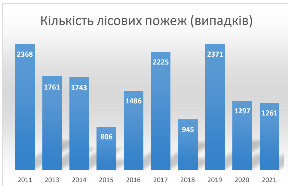
Рис. 2. Динаміка кількості лісових пожеж за 2010-2021 роки

Найбільші пожежі (за площею) мали місце у 2014 та 2017 роках (рис. 3). Скорішеза все, узагальнена статистика 2020 року буде також невтішно [5, 6].