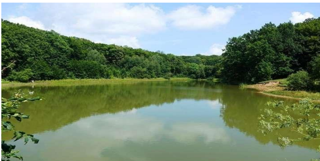
Рис. 1.3. Приклад природного вододжерела