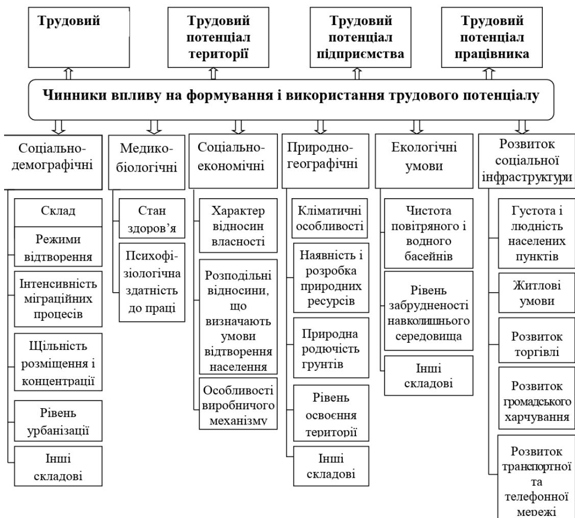
Рис. 1.2. Чинники впливу на формування і використання трудового потенціалу Джерело: [42]

Кваліфікаційна складова трудового потенціалу відіграє важливу роль у його якісному вдосконаленні через постійне підвищення кваліфікації та професійне навчання працівників.