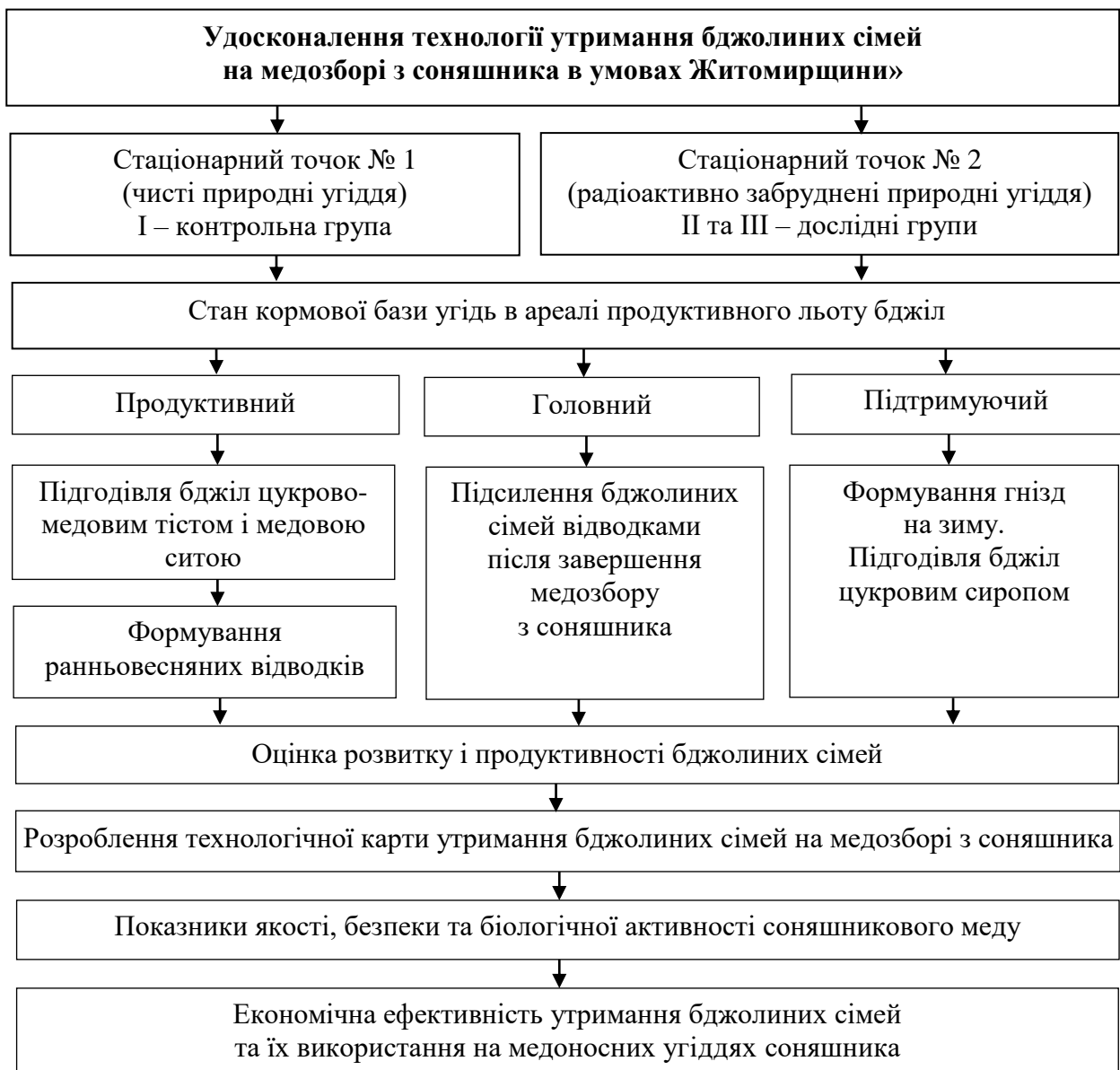
Рис. 1. Загальна схема дослідження

Дослідження проводили згідно зі схемою, представленою на рис. 1.