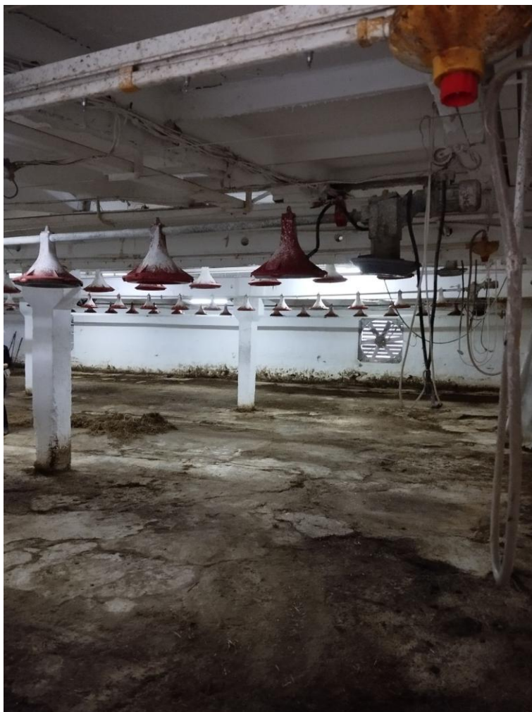
Рис. 3.3. Підготовка приміщення до посадки нової партії каченят

Напувальні системи, годівниці та інші технічні засоби підлягають миттю. Стіни та підлогу обробляють 20% розчином свіжогашеного вапна. Далі здійснюють дезінфекцію приміщення разом з усім обладнанням. Після завершення знезараження пташники щільно закривають і витримують у герметичному стані протягом однієї – двох діб, після чого провітрюють. На фінальному етапі здійснюють просушування приміщень, вносять вапно-пушонку з розрахунку 400–500 г/м 2 товщиною шару близько 5 мм, поверх якої укладають підстилку завтовшки 10–15 см. Як підстильний матеріал у господарстві застосовують подрібнену соломку. Після цього монтують напувальні та годівні пристрої й прогрівають пташник до температури 30–35 °С.