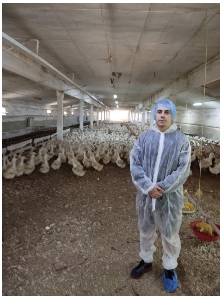
Рис. 3.1. Утримання каченят на підлозі на глибокій підстилці

У господарстві вирощування каченят на м'ясо здійснюється у стандартних пташниках із підлоговим утриманням, що передбачає застосування глибокої підстилки (рис. 3.1). У виробничих приміщеннях встановлено чотири лінії для годівлі у вигляді круглих годівниць, а також п'ять систем напування, оснащених ніпельними напувалками (рис. 3.2).