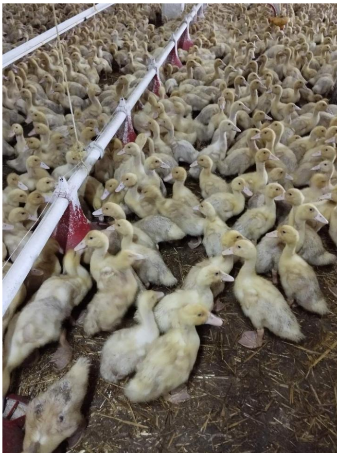
Рис. 3.2. Лінії годівлі та напування для каченят

Біля кожно пташника встановлено бункер для кормів, в який періодично завантажують комбикорм за допомогою спеванажівки.