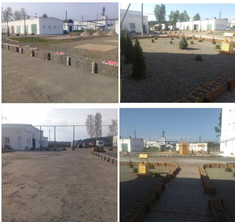
Рис. 2.1. Територія СТОВ "Птахоплемзавод "Коробівський"

В умовах СТОВ «ППЗ «Коробівський» дослідили технологію виробництва м'яса каченят кросу «SM3» (рис. 2.1)