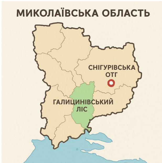
Рис. 2.1 Місце відбору зразків

Місцем відбору зразків були ґрунтовий покрив Галицинівського лісу Миколаївської області та ґрунти селітебної території Снігурівської ОТГ (Рис. 2.1).