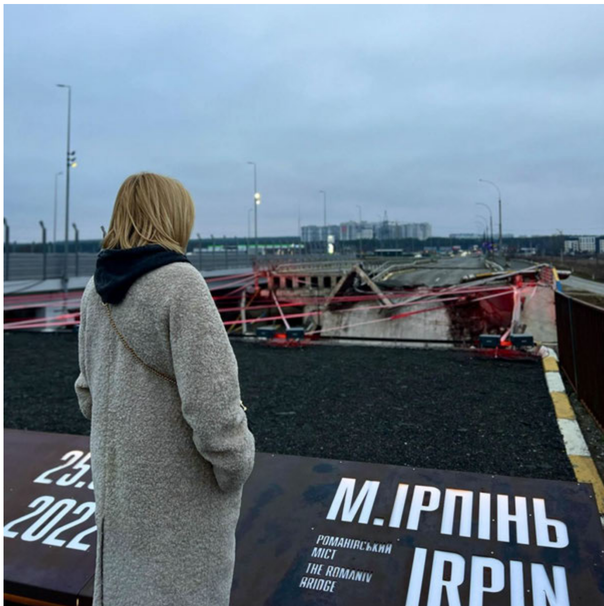
с.Романівка, 31 січня 2025 року. Міст у Романівці.