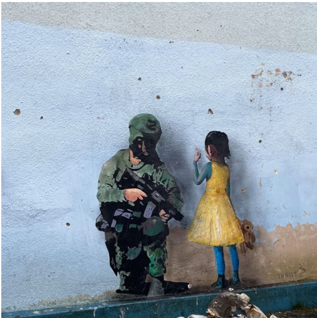
Ірпінь, 2 лютого 2023 року. Будинок культури.