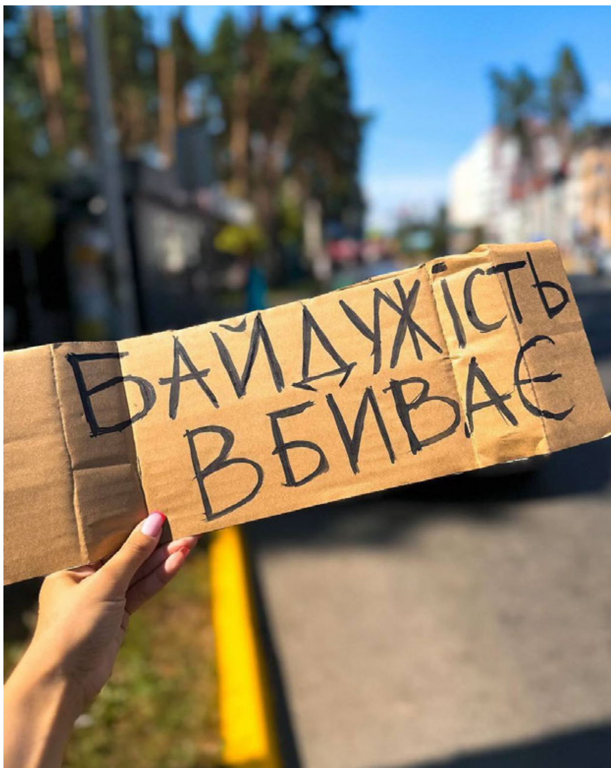
Ірпінь, 8 березня 2025 року. Акція «Не мовчи! Полон вбиває!»