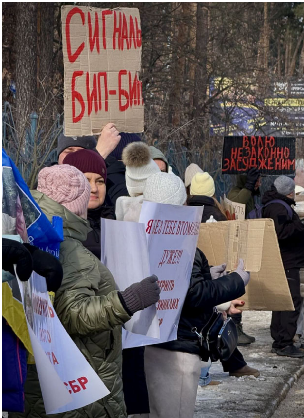
Ірпінь, 8 січня 2025 року. Акція «Не мовчи! Полон вбиває!»