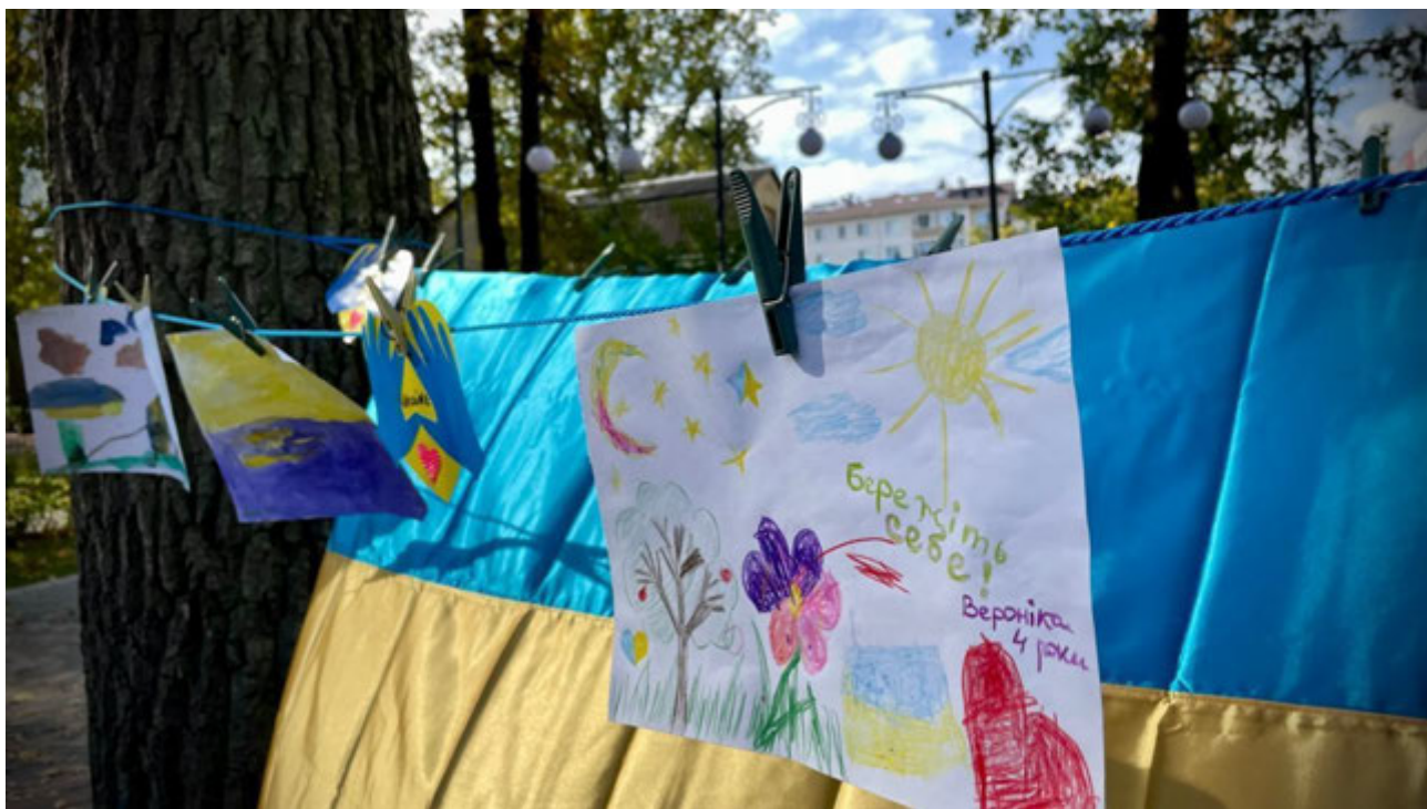
Ірпінь, 9 жовтня 2022 року. Ярмарок на підтримку ЗСУ.