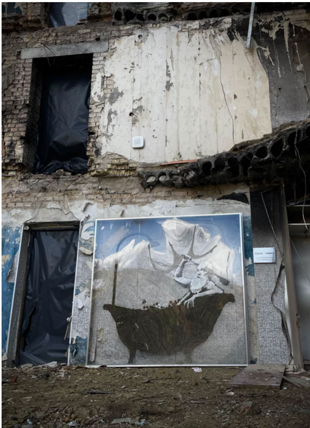
Горенка, 8 квітня 2023 року. Житловий будинок.