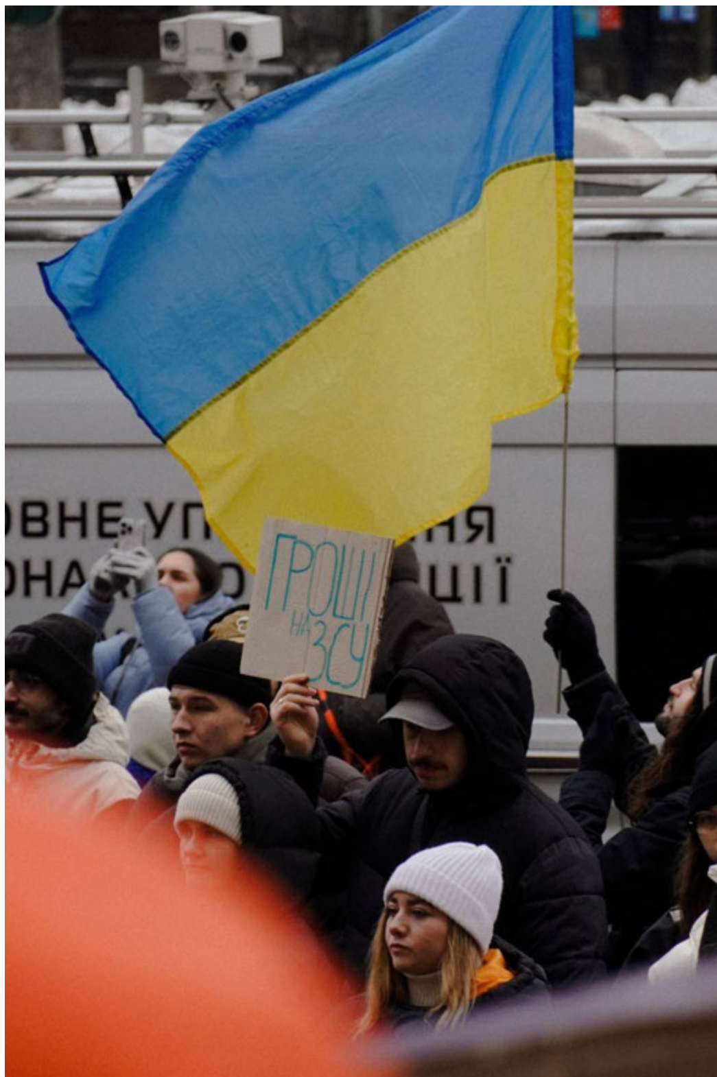
Київ, 16 листопада 2023 року. Акція під КМДА з гаслами на підтримку військових.