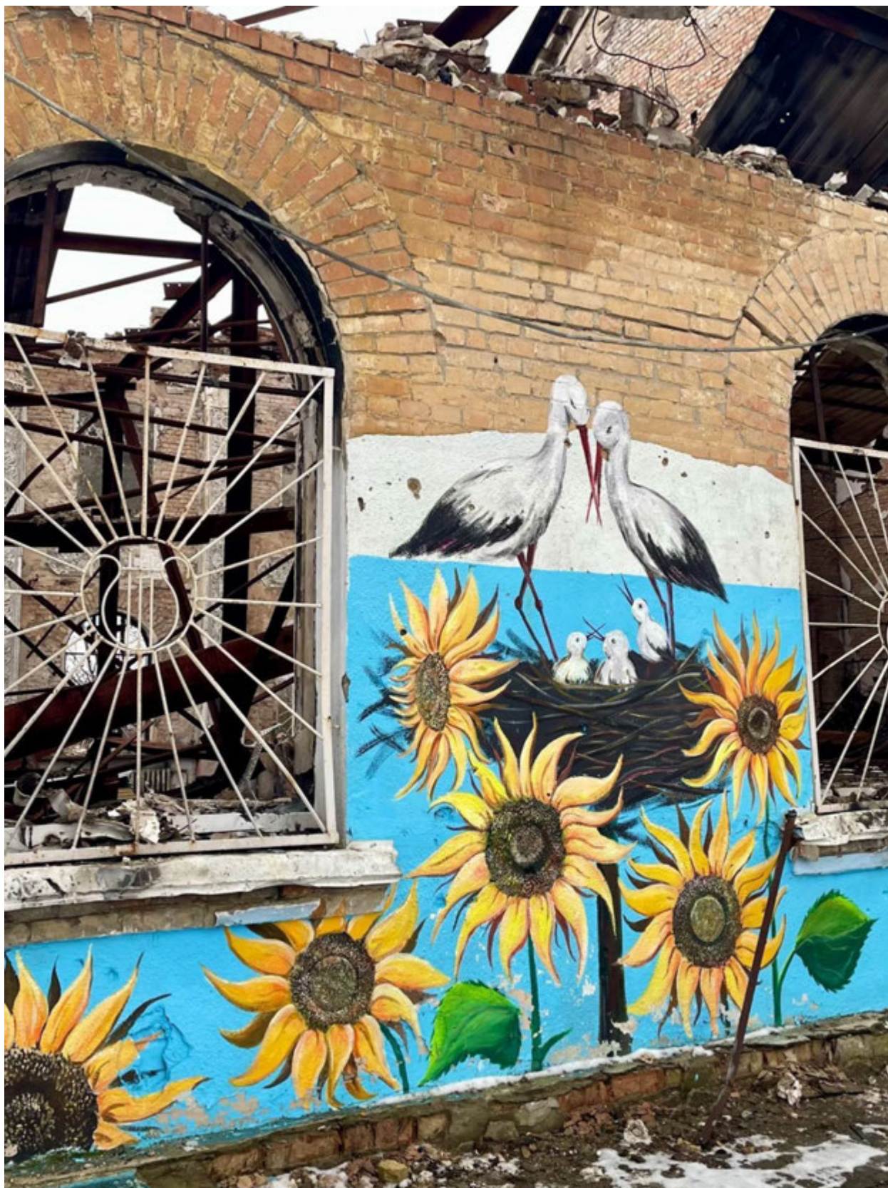
Ірпінь, 2 лютого 2023 року. Будинок культури.