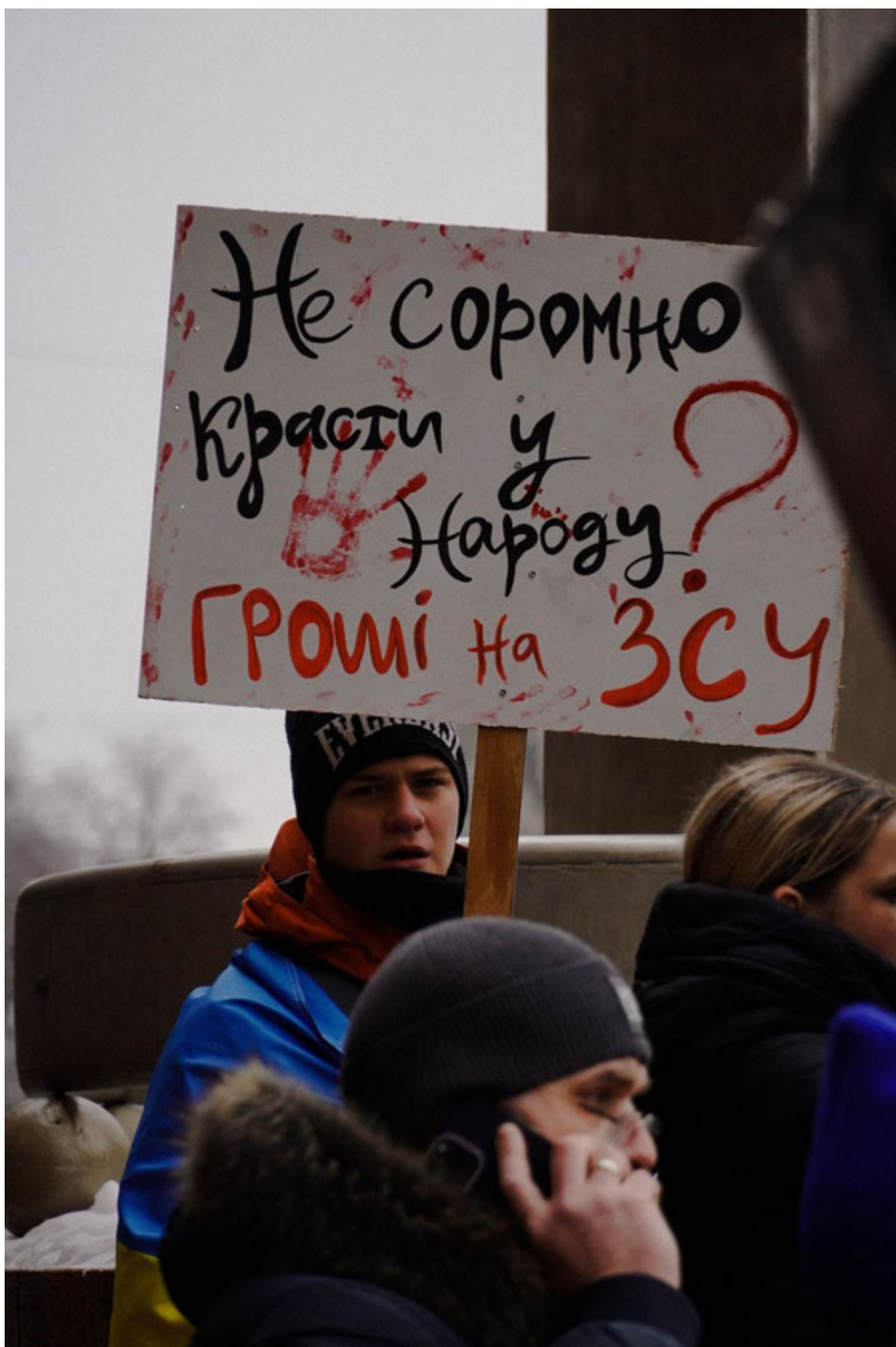
Київ, 16 листопада 2023 року. Акція під КМДА з гаслами на підтримку військових.