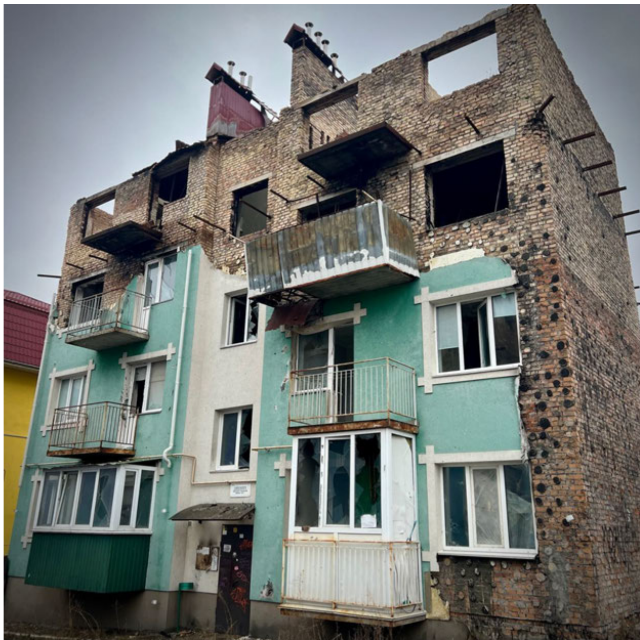
Ірпінь, 23 лютого 2023 року. Розбитий будинок, вул. Мечникова.