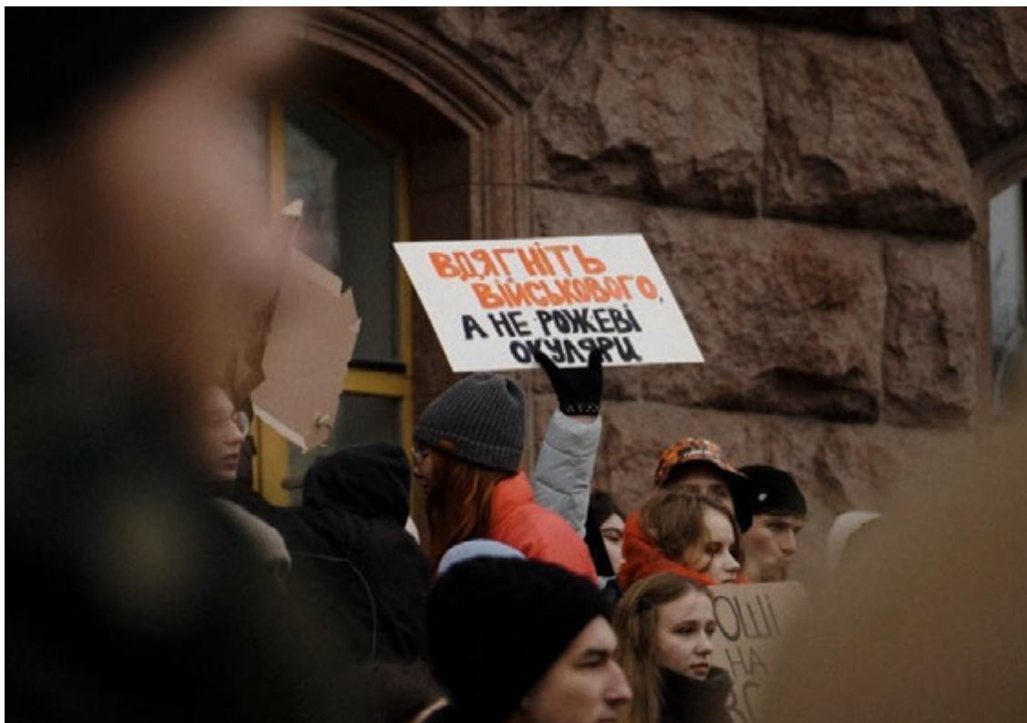
Київ, 16 листопада 2023 року. Акція під КМДА з гаслами на підтримку військових.