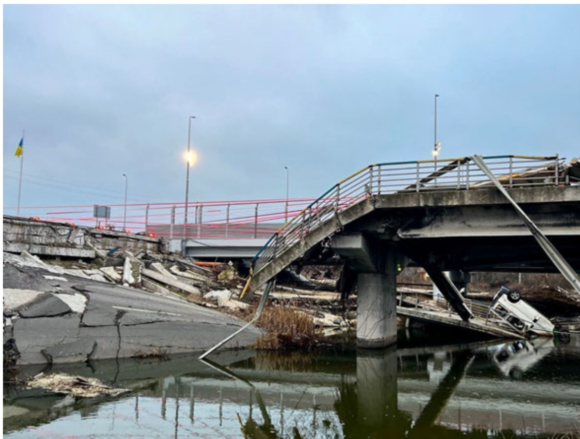
с.Романівка, 31 січня 2025 року. Міст у Романівці.