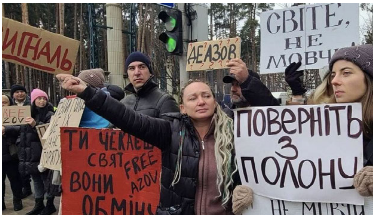
Ірпінь, 8 січня 2025 року. Акція «Не мовчи! Полон вбиває!»