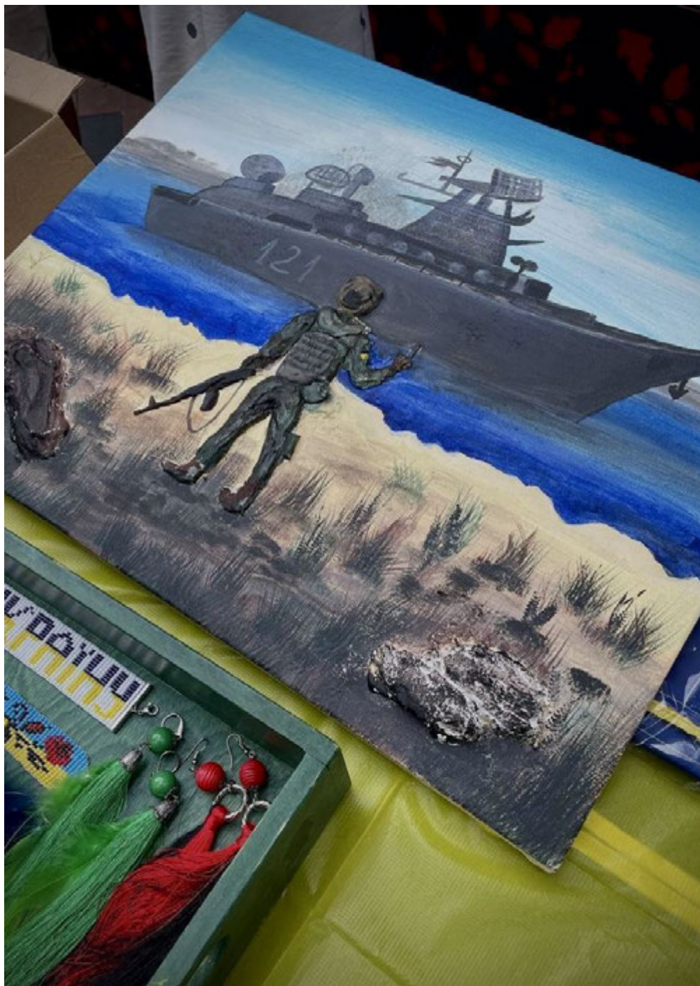
Ірпінь, 9 жовтня 2022 року. Ярмарок на підтримку ЗСУ.