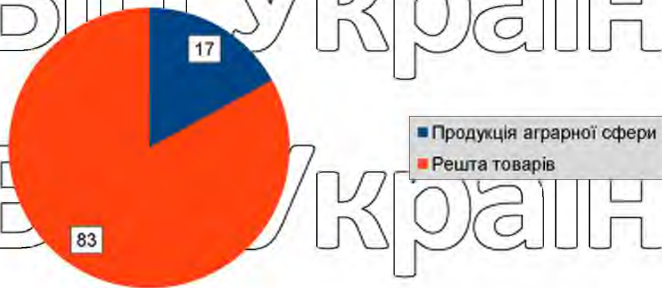
Рис. 2.1. Частка продукції аграрної сфери в експорті та імпорті Україна-ЄС

Як бачимо з наведених вище даних, за всіма категоріями продукції аграрної сфери відбулося збільшення обороту як в експорті, так і в імпорті. При цьому найбільше збільшення у відсотковому вираженні спостерігається серед деревина та виробів з деревини 146,5% та 135,6% відповідно. З іншого боку, найбільша