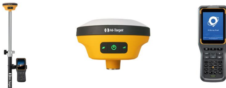
Рис.1. GNSS/RTK приймач Hi-Target V200

Використання датчиків і систем моніторингу дозволяє безперервно слідкувати за станом будівельних конструкцій, виявляти аномалії та попереджати про можливі ризики. Ці системи включають в себе вимірювальні прилади для виявлення деформацій, температурних коливань та інших параметрів.