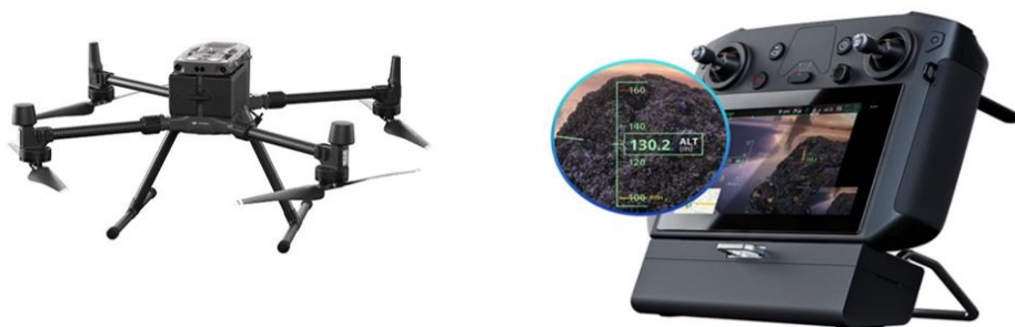
Рис.4. Matrice 300 RTR промисловий дрон

На основі дослідженого робимо висновок, що спільне використання цих технологій та заходів забезпечує комплексний підхід до будівельної безпеки, покращуючи якість та ефективність запобігання аваріям та максимально знижуючи ризики для працівників та майна.