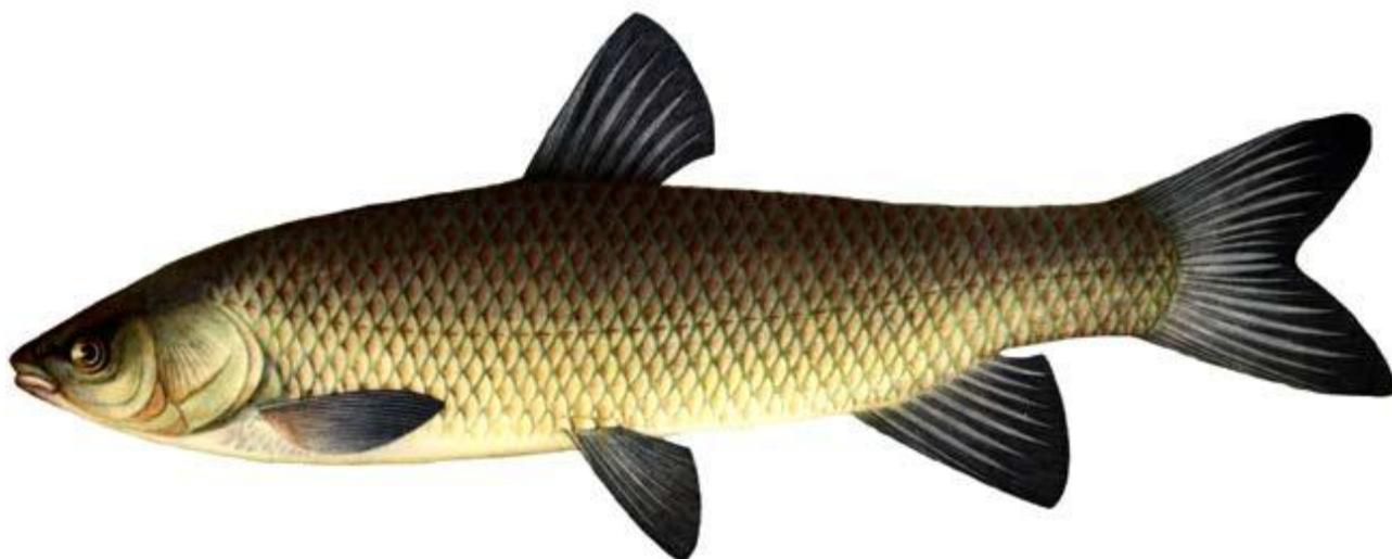
Рис. 1. Білий амур ( Stenopharyngodon idella Val.)

Білий амур ( Stenopharyngodon idella Val.) — велика прісноводна риба, яка може вирости понад 1 метр у довжину та набирати вагу понад 30 кг. Він має витягнуте, майже циліндричне тіло, вкрите щільною лускою, широколобу голову та гладке черево без кіля (рис. 1).