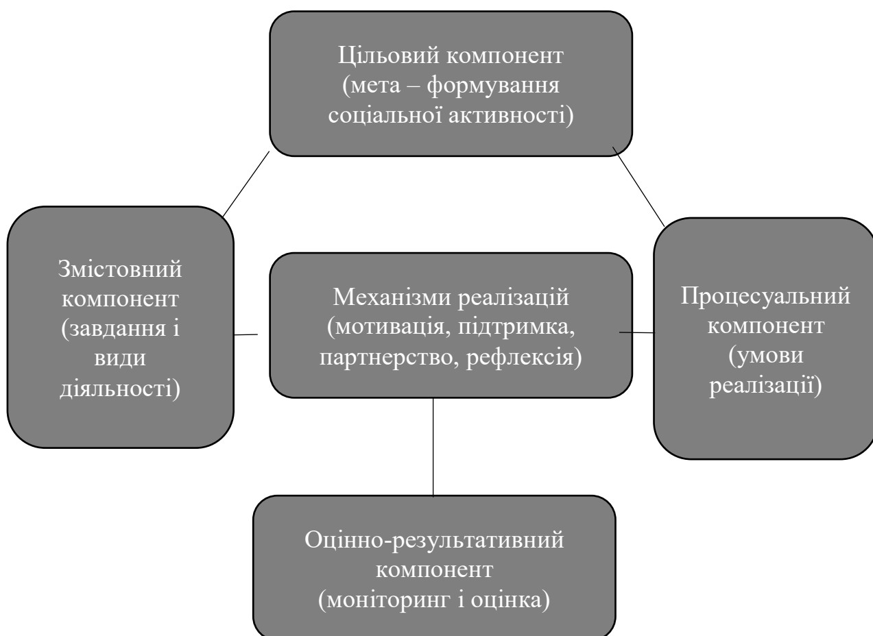
Рис. 3.2. Альтернативна візуалізація авторської моделі формування соціальної активності здобувачів педагогічних спеціальностей засобами студентського самоврядування

можливостей для особистісної самореалізації. По-друге, механізм організаційної підтримки забезпечує створення умов для активної участі студентів у роботі органів самоврядування через надання ресурсів, можливостей для планування та реалізації власних проєктів. По-третє, механізм партнерської взаємодії формує горизонтальні зв'язки між студентами, викладачами та адміністрацією, що сприяє виробленню навичок демократичного лідерства і колективної відповідальності. Нарешті, механізм рефлексії дозволяє студентам осмислювати власний досвід, усвідомлювати значення набутих компетентностей для майбутньої професійної діяльності та інтегрувати отримані знання у систему власних цінностей.