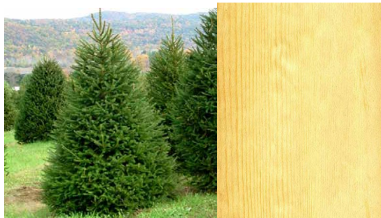
Рис. 1.2. Ялина і її деревина

По міцності ялина (рис. 1.2) майже не поступається сосні (у сухому стані).