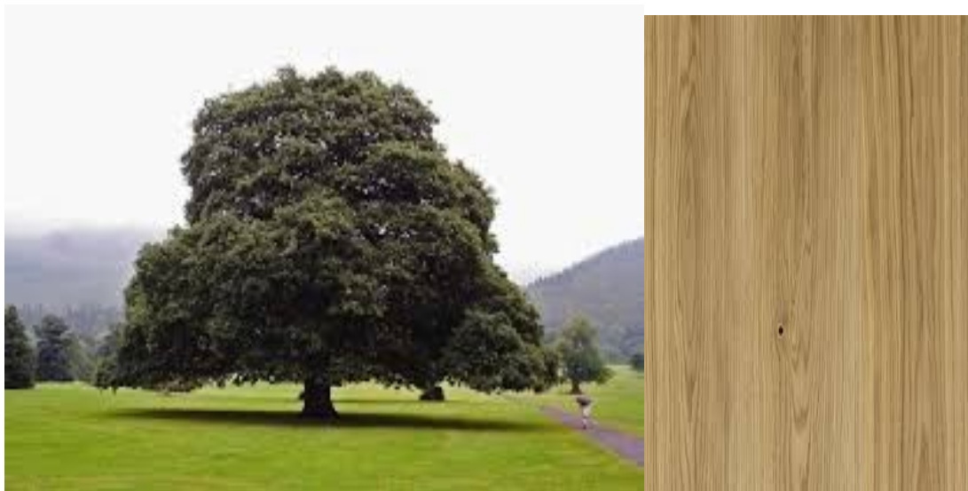
Рис. 1.6. Дуб і його деревина

Більшість листяних порід поступається хвойним у міцності і стійкості до загнивання (у них відсутні смоляні ходи), через що їх застосування в будівництві кілька обмежена. Найбільшою популярністю в якості будівельних листяних порід користуються дуб, ясен і гру. Деревина дуба це міцний, твердий, довговічний і стійкий до гниття матеріал, що використовується для виготовлення меблів, паркету, дверей, бочок, а також у кораблебудуванні. Вона має красиву текстуру, насичений коричневий колір (або світло-жовтий у заболоні), яка з часом стає благороднішою, та добре полірується. Завдяки високому вмісту дубильних речовин, дуб стійкий до вологи та біологічних ушкоджень. Має високу міцність (близько 60 МПа при стисненні вздовж волокон), добре чинить опір гниття. Застосовується для виготовлення зовнішніх конструкцій (хоч і не так активно, як сосна або модрина), а також в якості оздоблювального матеріалу (стать, вікна, двері) [9].