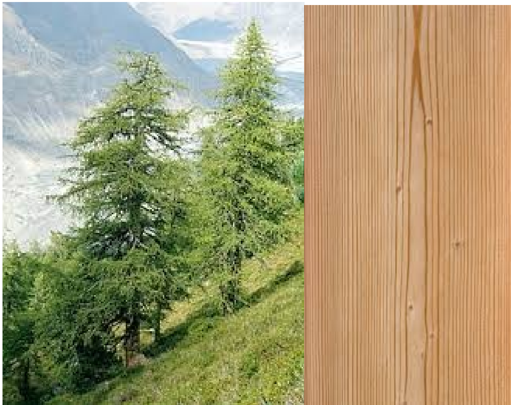
Рис. 1.3. Модрина і її деревина

Для модрини (рис. 1.3) характерна висока щільність та міцність (на 30 % вище, ніж у сосни), а крім того вона стійка до загнивання. Високо цінується властивість модрини стає надзвичайно міцної після сушки. Надзвичайну міцність підтверджує і той факт, що будинки з модрини, побудовані більш 300 років тому, стоять і досі.