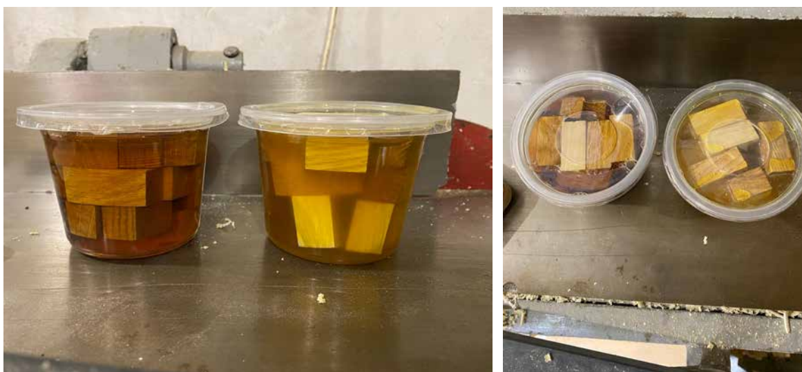
Рис. 3.1. Зразки деревини

Зміщення 5 мм у комбінованих зразках типу дуб–ясен було обрано з метою оцінити міцність з'єднання в умовах нерівномірного навантаження та імітації можливих виробничих відхилень.