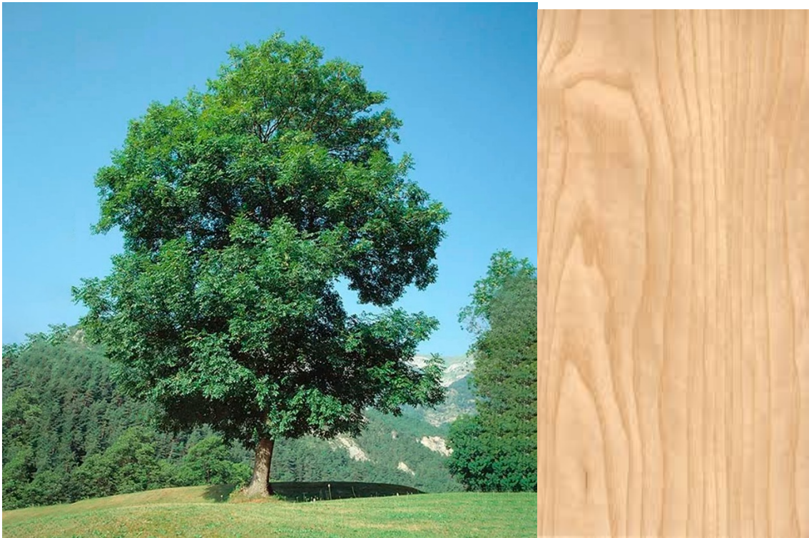
Рис. 1.7. Ясен і його деревина

Для деревини основними й найважливішими є такі властивості [8]: