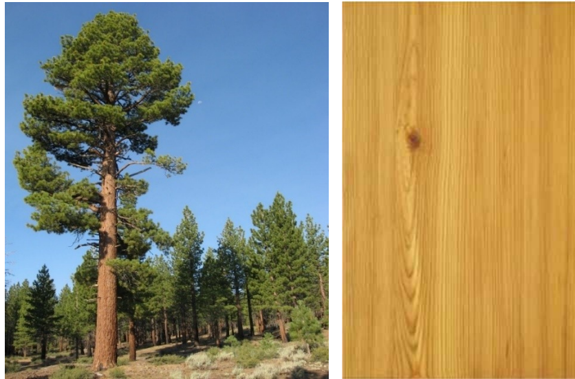
Рис. 1.1. Сосна і її деревина [10]

Деревина сосни (рис. 1.1) займає, мабуть, перше місце за популярністю серед хвойних порід, використовуваних для спорудження будівель. І не випадково – адже сосна володіє цілим рядом позитивних властивостей: висока міцність (межа міцності при стисненні вздовж волокон близько 50 МПа), щільність, стійкість до розтріскування, усихання і гниття (деревина сосни має безліч смоляних ходів), зносостійкість [5].