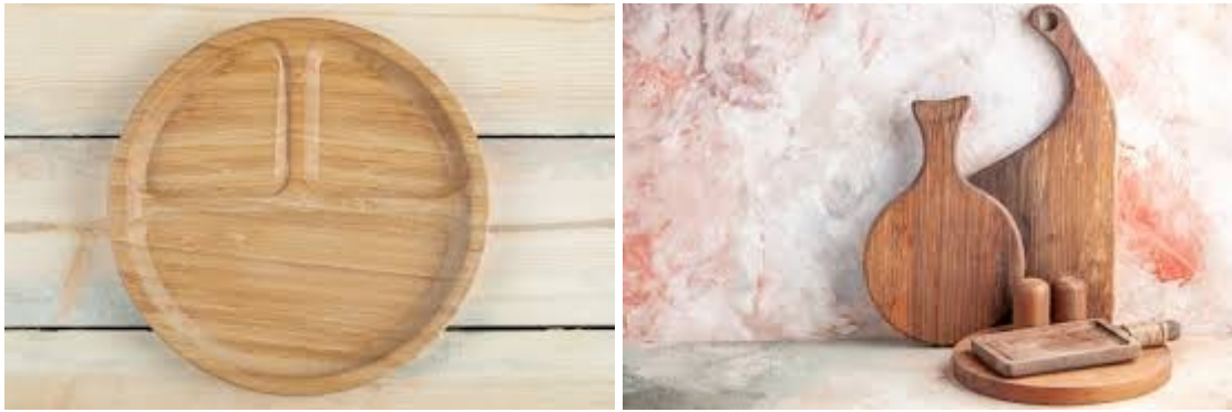
Рис. 1.9. Вироби компанії VWood

Компанія Artemida Trading використовує високоякісну деревину та сучасне обладнання, що дозволяє створювати надійні та довговічні вироби. Виробничий процес включає ретельний контроль якості, що гарантує відповідність продукції міжнародним стандартам.