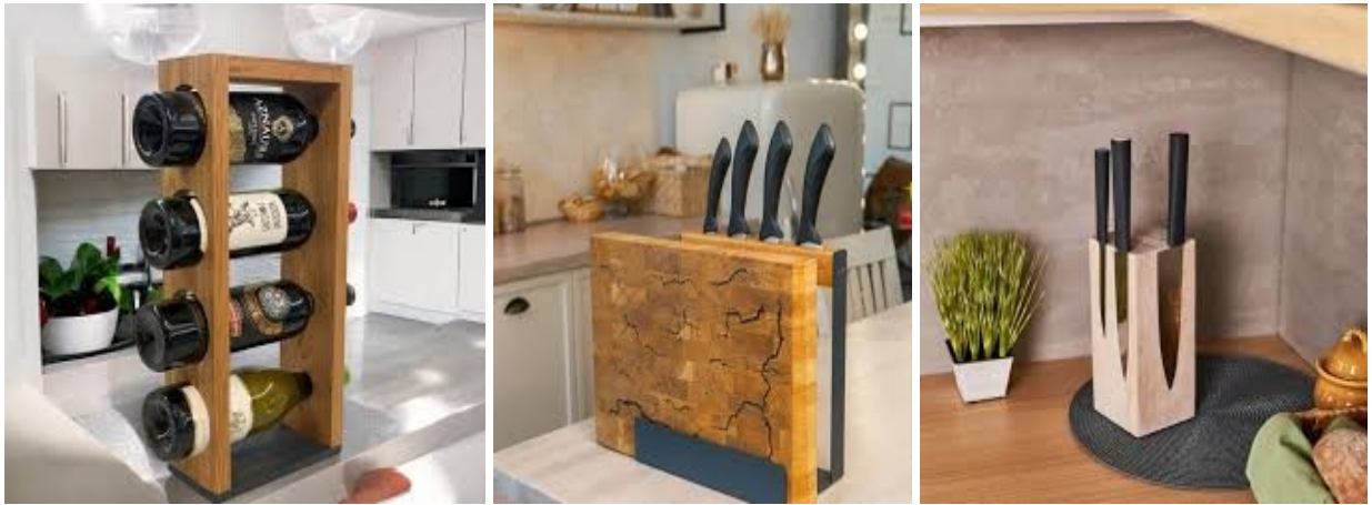
Рис. 1.8. Вироби компанії VWood

Компанія VWood пропонує широкий асортимент дерев'яних виробів, які поєднують функціональність, стильний дизайн та довговічність. Всі продукти виготовляються з натуральної деревини, що забезпечує їхню екологічність та безпеку у використанні [45].