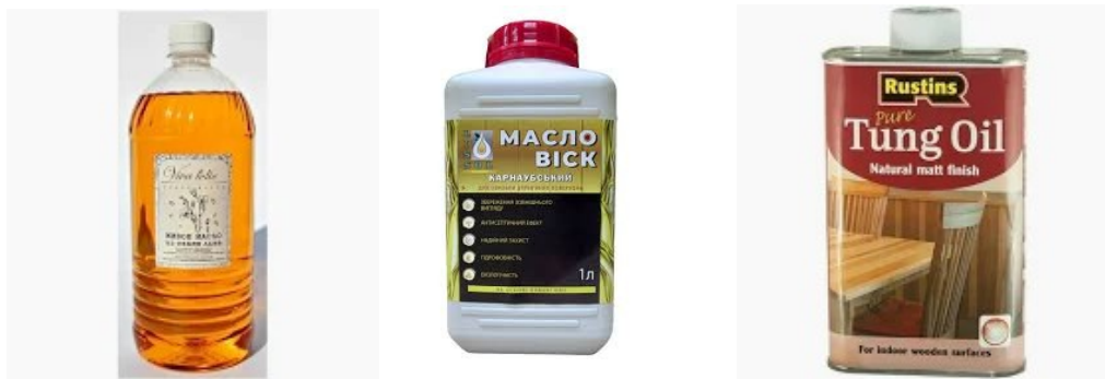
Рис. 1.10. Натуральні олії для захисту деревини

Для обробки деревини можна використовувати натуральні олії та воски (рис. 1.10). Наприклад, лляна олія, бджолиний віск або карнаубський віск є відмінними природними засобами для захисту дерева. Вони проникають у пори деревини, створюючи бар'єр від вологи та бруду, але при цьому не блокують природне дихання матеріалу. Ці речовини безпечні для здоров'я і легко наносяться, що робить їх популярним вибором серед майстрів і любителів.