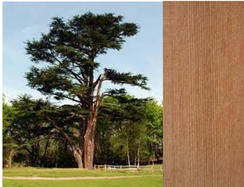
Рис. 1.5. Кедр і його деревина

За фізико-механічними властивостями деревина кедра (рис. 1.5) поступається деревині модрини і наближається до сосни.