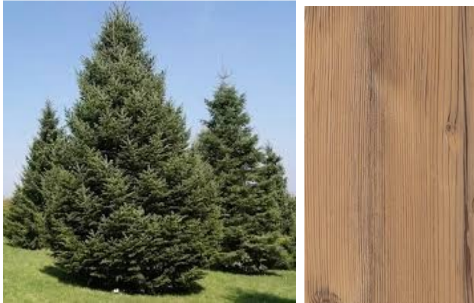
Рис. 1.4. Ялиця і її деревина

Через відсутність смоляних ходів деревина ялиці (рис. 1.4) набагато сильніше схильна до загнивання, ніж деревина сосни, тому не використовується для виготовлення зовнішніх конструкцій. Область застосування ялиці – вікна, двері, підлогу і інші внутрішні конструкції.