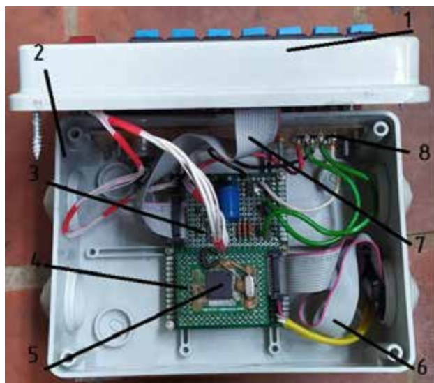
Рис. 4. Пристрій мікроконтролерного блока керування: 1 – панель керування; 2 – корпус; 3 – монтажна плата аналогової частини схеми; 4 – монтажна плата цифрової частини схеми; 5 – мікроконтролер MSP430; 6 – CAN-шина роз'єму для налагодження; 7 – CAN-шина панелі керування; 8 – роз'єм для датчиків і виконавчих пристроїв.

Датчик моменту впорскування активатора і швидкісного режиму служить для визначення тактів впуску в циліндрах двигуна для здійснення фазованого впорскування паливного активатора, а також використовується як датчик частоти обертання к.в. дизеля. Основними елементами датчика є неодимовий магніт 3, встановлений радіально на приводній шестерні ПНВТ, що обертається разом із нею, і магнітокерована мікросхема 2 від датчика Холла, нерухомо закріплена на передній кришці 1 ПНВТ.