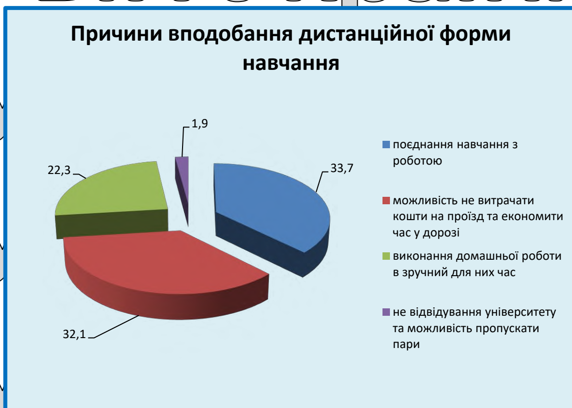
Рис. 3.2 Причини вподобання дистанційної форми навчання

можливість – 33,7% поєднання навчання з роботою. 32,1% визначили, як вагому перевагу, можливість не витрачати кошти на проїзд та економити час у дорозі. 22,3% обрали варіант виконання домашньої роботи в зручний для них час. Не відвідування університету та можливість пропускати пари обрали меншість (1,9%), що тільки підкреслює переважне прагнення сучасного студента до отримання фахових знань (Рис.3.2).