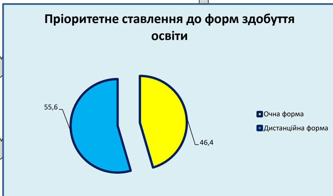
Рис. 3.1 Пріоритетне ставлення до форм здобуття освіти

Першим питанням доцільно було узагальнити ставлення респондентів до даної форми освітнього процесу. 45,4 % студентів визначилися в бік очної форми здобуття освіти, а саме відвідування закладу, можливості живого спілкування з викладачами, зустрічі з одногрупниками, обговорення та вирішення проблемних питань щодо навчання та організації спільного дозвілля. 55,6 % респондентів обрали дистанційну форму навчання, що пояснювали потребою паралельного працевлаштування з метою покращення матеріального становища, допомоги батькам, які у період локдауну втратили місце роботи тощо (Рис. 3.1.).