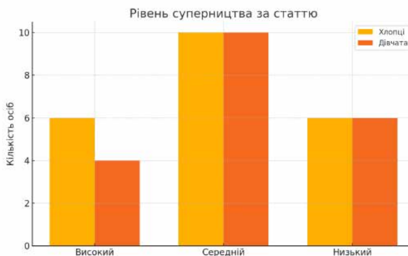
Рис. 2.2. Порівняння за статтю та типом поведінки «Суперництво» (методики вияву схильності до конфліктної поведінки Методика К.Томаса (адаптація Н.В.Гришиної))

У результаті емпіричного дослідження рівнів схильності до конфліктної поведінки серед підлітків за методикою К. Томаса було виявлено такі особливості. Основна маса респондентів продемонструвала середній рівень схильності до всіх типів конфліктної поведінки, що є типовим для підліткового віку. Це свідчить про поступове формування навичок регуляції власної поведінки у конфліктних ситуаціях та пошуку збалансованих моделей взаємодії. Співпраця виявилася найбільш вираженим конструктивним типом поведінки: високий рівень за цим типом продемонстрували 31% підлітків, що свідчить про наявність позитивних соціальних установок і бажання вирішувати конфлікти спільно.