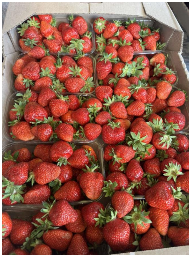
Рисунок 3.3. Ягоди суниці сорту Азія після першого збору врожаю (2025)

За результатами органолептичної оцінки смаку було відмічено високі смакові властивості більшості досліджуваних сортів. Найкращим за смаковими якостями визнано сорт Клері, який отримав 9,0 балів завдяки збалансованому кислувато-солодкому смаку. Дещо нижчі показники відмічено у сортів Хоней, Ельсанта та Азія — по 8,5 бала, тоді як Вайбрант мав 8,0 бали. Найменшу оцінку за смак (7,0 балів) отримав сорт Квікі, що може бути зумовлено менш насиченим ароматом і щільнішою текстурою ягід.