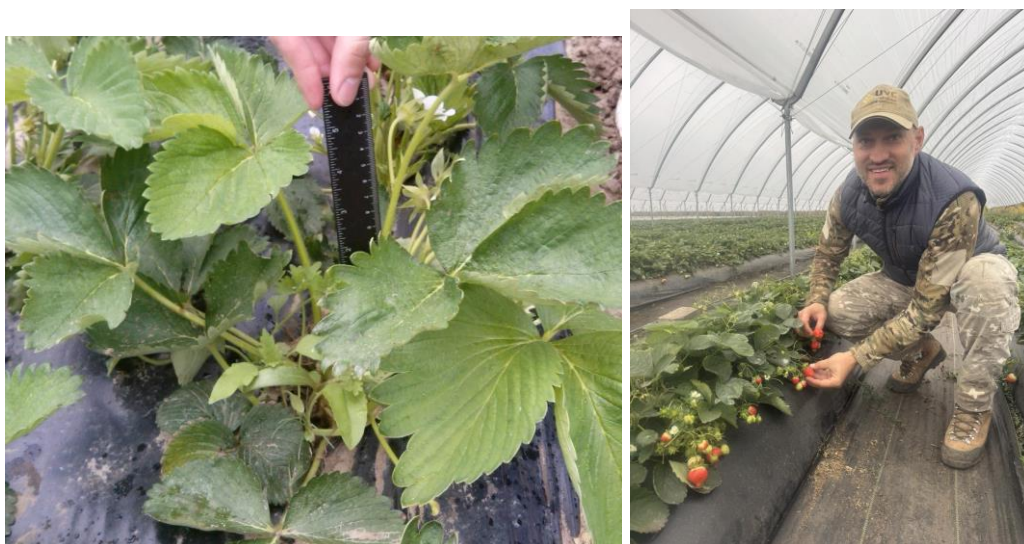
Рисунок 3.1 Збір біометричних та фенологічних даних

Фенологічні спостереження, які тісно пов'язані з метеорологічними умовами конкретного року, є невід'ємною складовою сортовипробування. За результатами наших досліджень встановлено, що початок цвітіння для більшості досліджуваних сортів суниці припав на першу декаду травня. Пізній початок квітування був зумовлений несприятливими погодними умовами, зокрема частими зниженнями нічних температур, що сповільнювало розвиток рослин.