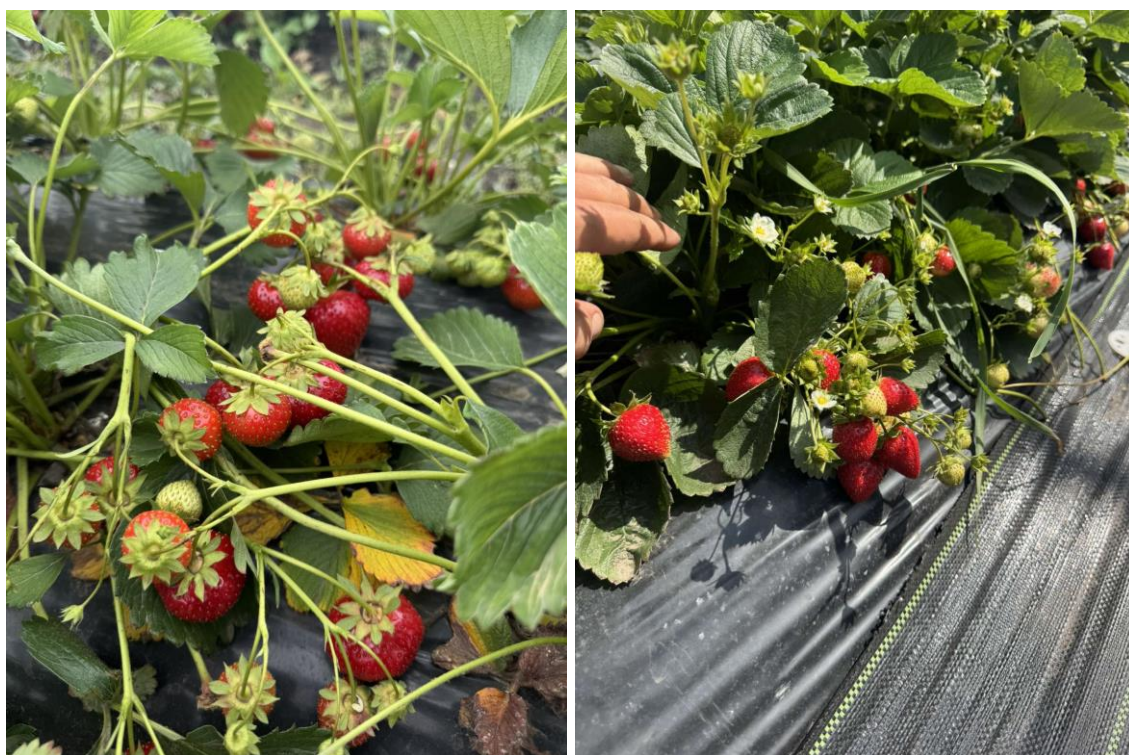
Рисунок 3.2. Плодоношення суниці сорту Вайбрант (2025 рік)

Варто врахувати, що ранньостиглі сорти суниці, як правило, поступаються середньостиглим за рівнем урожайності. Це зумовлено коротшим періодом вегетації та меншим потенціалом формування генеративних органів. Проте їх економічна привабливість полягає у можливості отримання ранньої продукції, коли ціна на ягоду традиційно є найвищою. Таким чином, навіть при дещо нижчому валовому зборі загальний прибуток від вирощування ранніх сортів може бути вищим, ніж від середньопізніх.