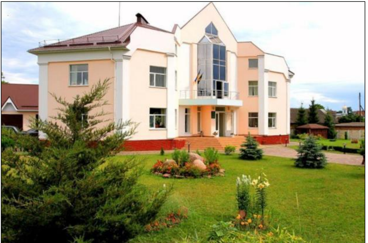
Рис. 3.1. Контора державного підприємства «Ніжинське лісове господарство» ( https://negles.at.ua/ )

Державне підприємство «Ніжинське лісове господарство» (далі лісгосп) розташоване в південно-східній частині Чернігівської області на території Ніжинського, Чернігівського, Корюківського, Новгород-Сіверського та Прилуцького адміністративних районів.