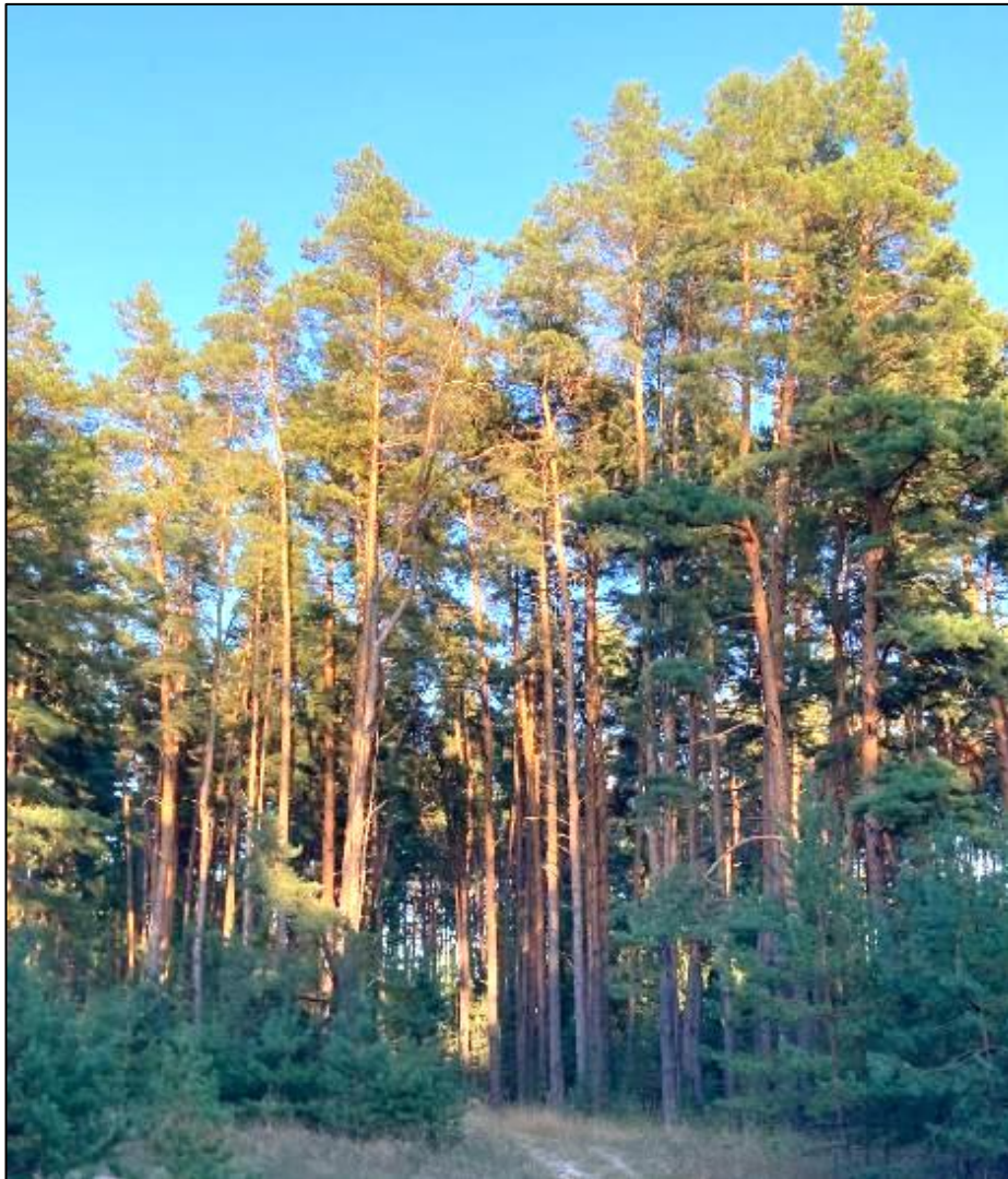
Рис.1.2. Приклад цінного насадження у Ічнянському лісництві (головна порода сосна звичайна)

Цінні насадження – це стандартні насадження, які відповідають загальноприйнятим лісівничим критеріям (зокрема, середній повноті і переважанню головної породи) та мають середні або близькі до них лісівничо-таксаційні показники. Такий тип насаджень є найпоширенішим у лісовому господарстві.