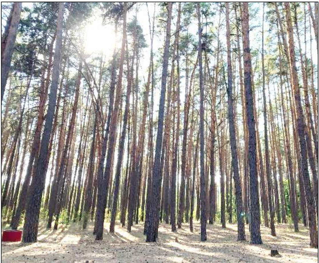
Рис. 1.1. Приклад еталонних насаджень Ніжинського лісгоспу (головна порода сосна звичайна)

Еталонні насадження – це зразкові насадження, що є орієнтиром для вирощування лісів певної породи в конкретних типах лісорослинних умов (ТЛУ). Еталонні насадження можуть відрізнятися залежно від категорії лісів. Основні вимоги до таких насаджень описані в літературі (Лосицький, Чуєнков, 1980; Свириденко, 2007). Однак через різноманітність природних та економічних умов в Україні, параметри еталонних насаджень можуть уточнюватися для кожної природної зони, підзони або окремого лісового підприємства.