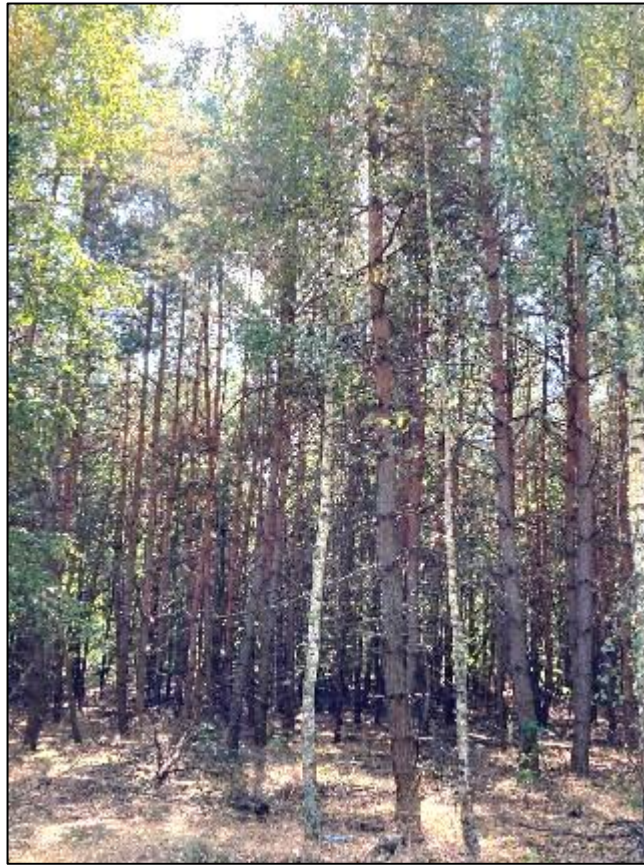
Рис. 1.3. Приклад малоцінного насадження. (головна порода сосна звичайна)

Малоцінні насадження – це насадження з низькою продуктивністю та низькою повнотою, які можуть втратити перевагу головної породи або зовсім не мати її.