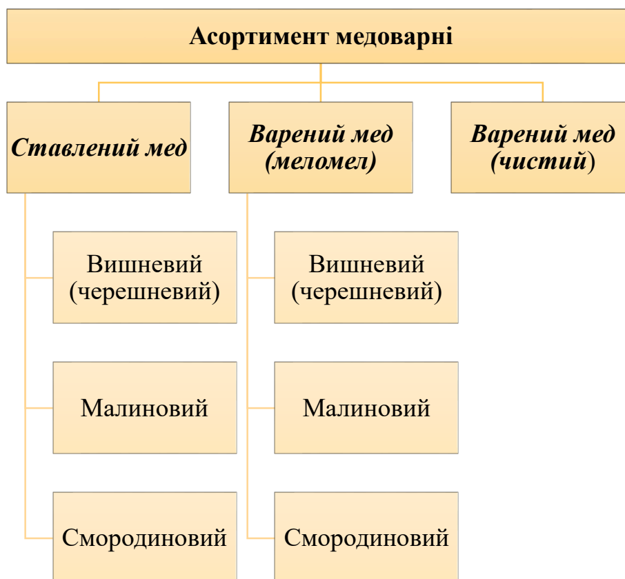
Рис. 2.2. Асортимент власної медоварні