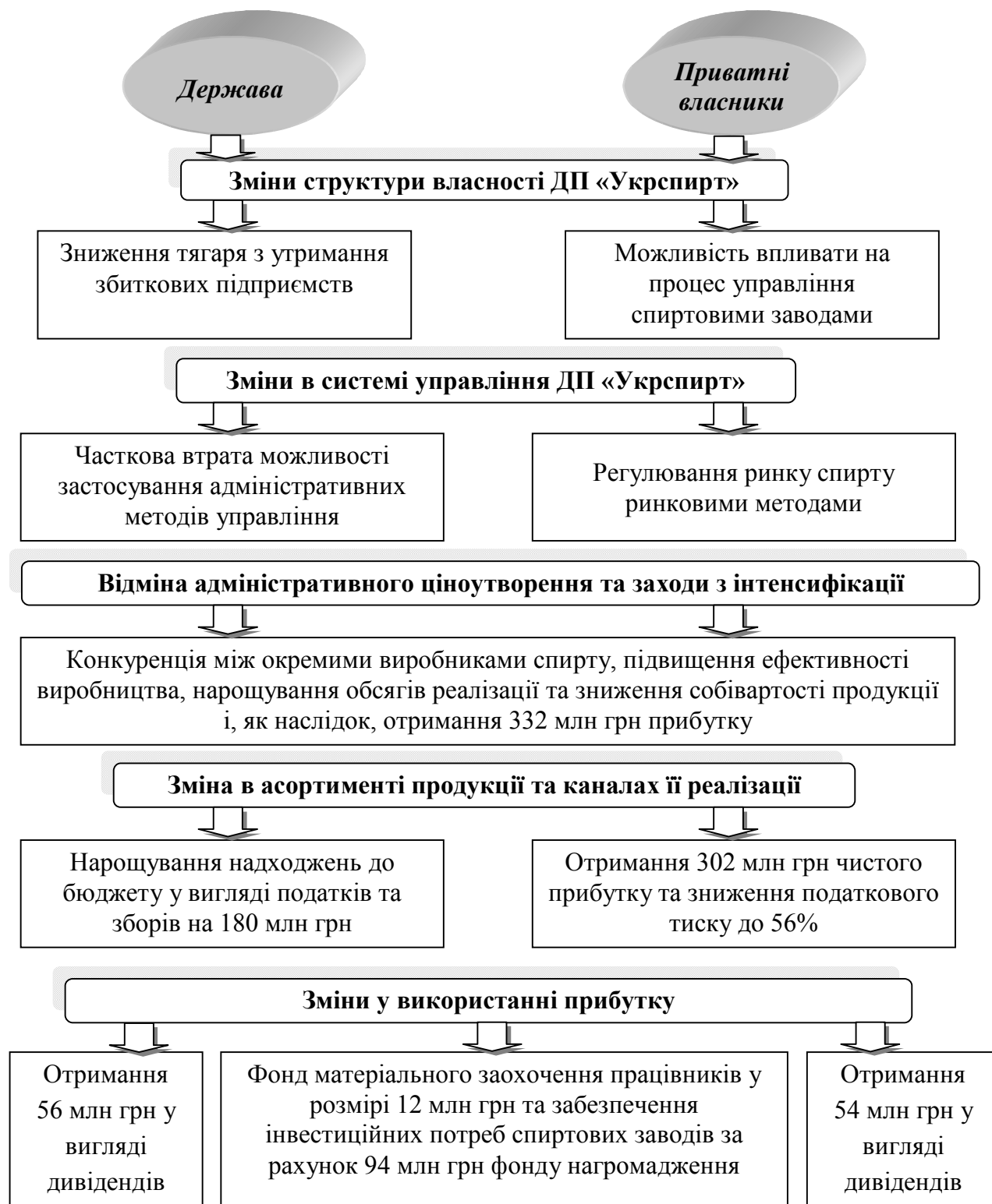
Рис. 3. Модель комбінованого управління прибутком ДП «Укрспирт»

пропонується варіант часткової приватизації спиртових заводів зі збереженням у їх власному капіталі переважної частки державних коштів. Таким чином, стає можливим залучення в цілому по ДП «Укрспирт» 548,8 млн грн приватних коштів. Реалізація всіх запропонованих заходів дозволить сформувати модель комбінованого управління прибутком спиртових заводів (рис. 3).