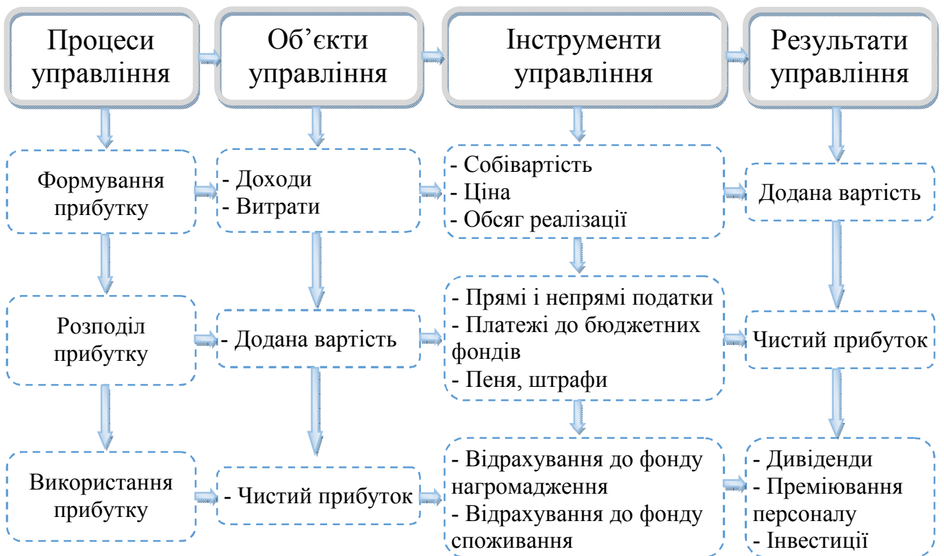
Рис. 2. Дескриптивна модель процесного управління прибутком

На основі даного визначення побудовано дескриптивну модель процесного управління прибутком спиртових заводів (рис. 2), відповідно до якої на кожному етапі управління прибутком слід виділяти окремі об'єкти цього управління.