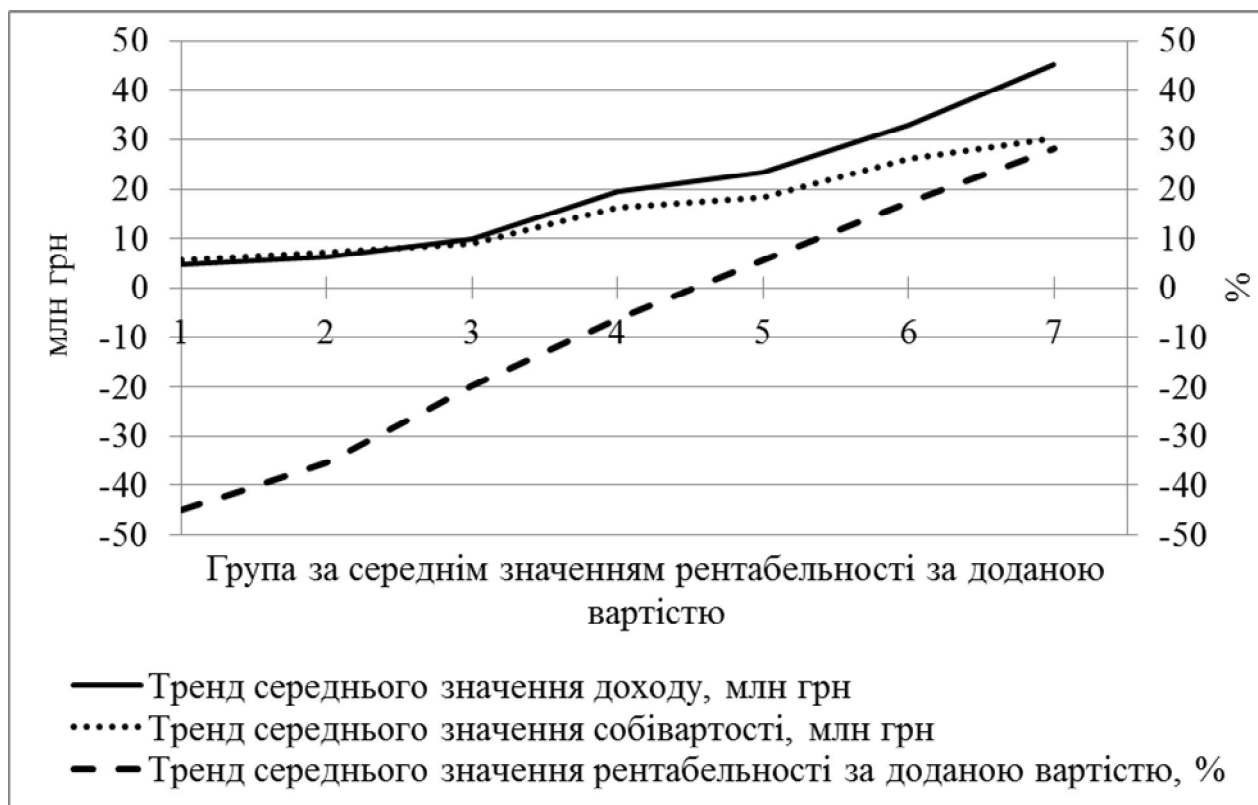
Рис. 3. Зміна середнього значення рентабельності доданої вартості в залежності від доходу та собівартості продукції ДП «Укрспирт»

Для оцінки ефективності розподілу прибутку запропоновано внести зміни до алгоритму розрахунку коефіцієнта податкового тиску (формула (3)):