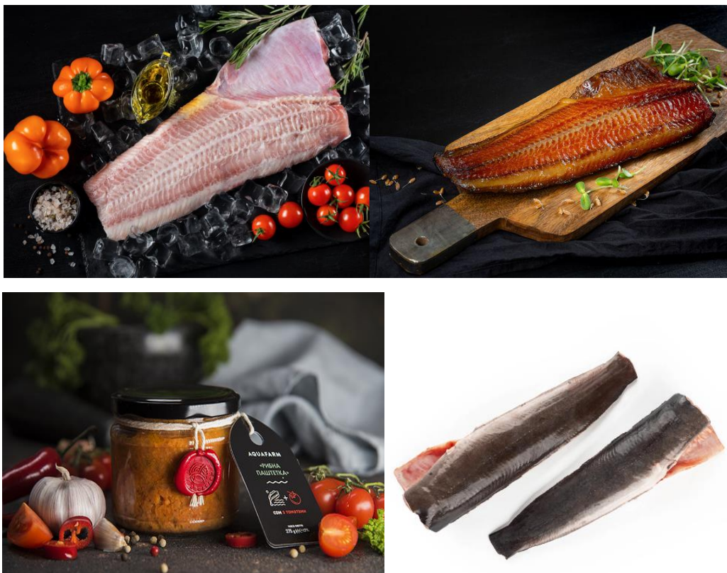
Рисунок 4 – Продукція з кларієвого сома, що виготовляється за рахунок доданої вартості

Ще розглядають переробку сировини кларієвого сома на різного виду консерви, пресерви та паштети (рис. 4).