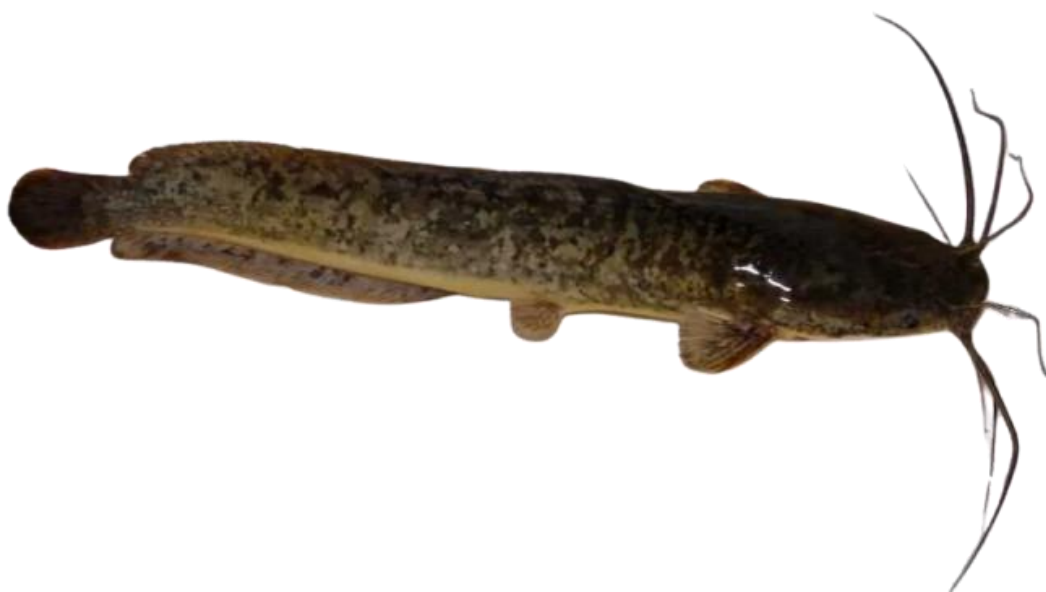
Рисунок 2 – Зовнішній вигляд кларієвого сома ( Clarias gariepinus )

Кларієвий сом ( Clarias gariepinus ) – один із перспективних об'єктів аквакультури (рис. 2). З огляду на доволі динамічний розвиток рециркуляційної аквакультури в Україні, зацікавленість вітчизняних виробників у вирощуванні африканського сома, наявні біотехнології та досвід, за умови ефективної промоції цей напрям аквакультури може стати пріоритетним.