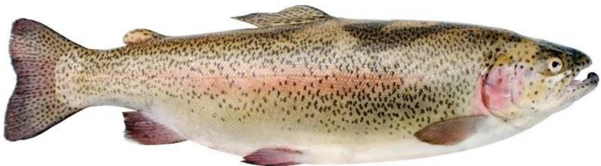
Рисунок 5 – Зовнішній вигляд райдужної форелі ( Oncorhynchus mykiss )

Райдужна форель є типовою холоднолюбивою рибою, яка живе переважно в гірських річках і струмках, а також на рівнинних річках із піщано-гальковим дном, з холодною багатою на кисень джерельною водою не забрудненою відходами промислових підприємств чи лісосплаву, вільною від шкідливих газів та токсичних речовин.