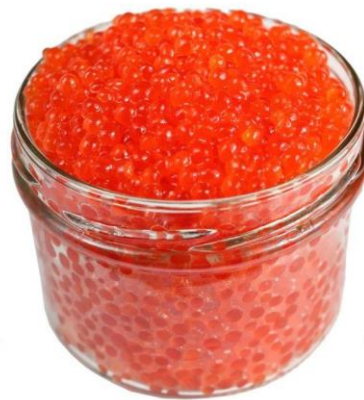
Рисунок 7 – Продукція з райдужної форелі, що виготовляється за рахунок доданої вартості