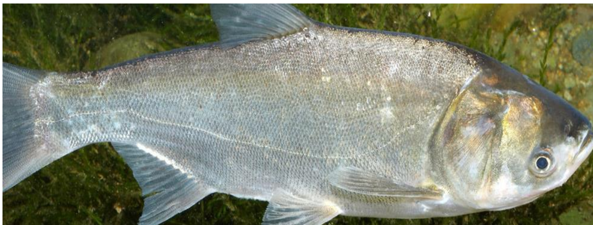
Рис. 1.1.3. Білий товстолобик ( Hypophthalmichthys molitrix )

ряд зябрових тичинок, які формують особливу «сітку» для затримання планктону. Будучи пелагічним видом, білий товстолобик зазвичай виростає до метра в довжину і може важити до 16 кг. Така структура тіла дозволяє йому ефективно фільтрувати воду та споживати дрібні організми, що сприяє підтриманню чистоти водойм. Біла луска і обтічна форма тіла допомагають йому легко пересуватися у товщі води, забезпечуючи кращу ефективність харчування та швидкий темп росту. (Рис. 1.1.3) [2].