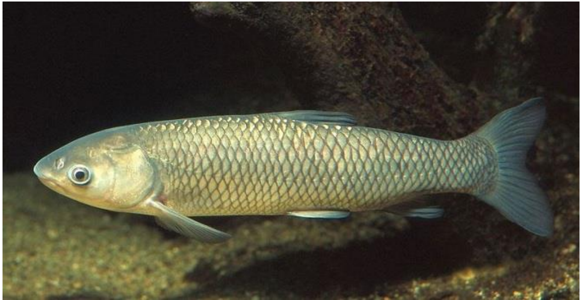
Рис. 1.1.2. Білий амур ( Stenopharyngodon idella )

Білий амур ( Stenopharyngodon idella ) є одним із найбільш поширених видів риби, які вирощують у прісноводних ставках для комерційного використання (Рис. 1.1.2).