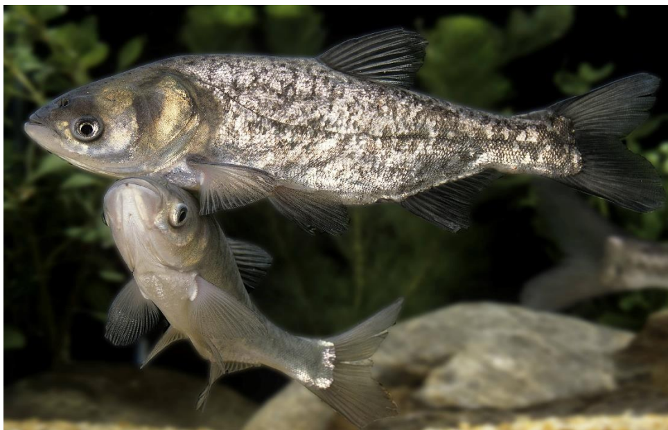
Рис.1.1.4. Строкатий товстолобик ( Hypophthalmichthys nobilis )

становить приблизно 5-6 кг. Завдяки здатності до інтенсивного набору маси та добрій адаптації до теплих умов, строкатий товстолобик є популярним у ставкових господарствах. Його висока продуктивність має значення для забезпечення стабільних обсягів рибної продукції, особливо в регіонах із теплішим кліматом, що робить його перспективним для комерційного розведення (Рис.1.1.4.) [2].