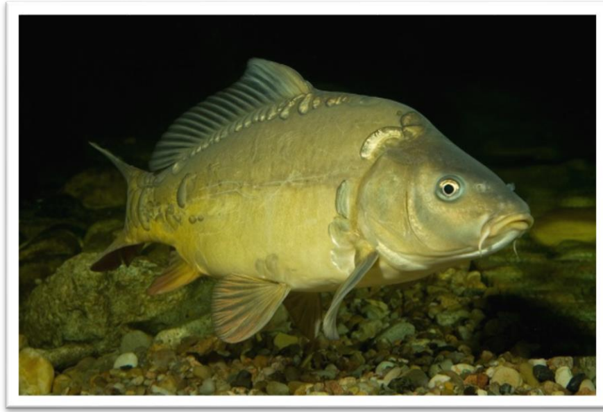
Рис. 1.1.1. Короп звичайний ( Cyprinus carpio )

Короп ( Cyprinus carpio ) є найпоширенішою рибою у ставкових господарствах України та багатьох інших країн (Рис. 1.1.1).