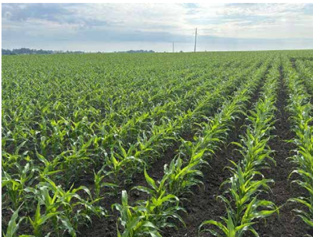
Технологічні операції при технології «No-till»