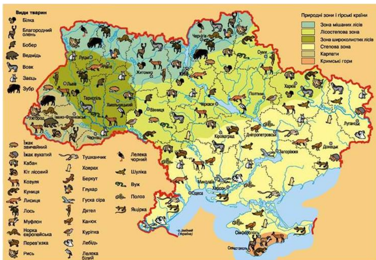
Рис. 1.2. Тваринний світ території України [24]

Зоогеографічне розташування України (рис. 1.2) сприяє поширенню як європейських, так і азіатських видів. У степовій зоні домінують дрібні копитні, зайцеподібні та гризуни, у лісовій зоні – великі копитні, хижі ссавці та птахи [19].