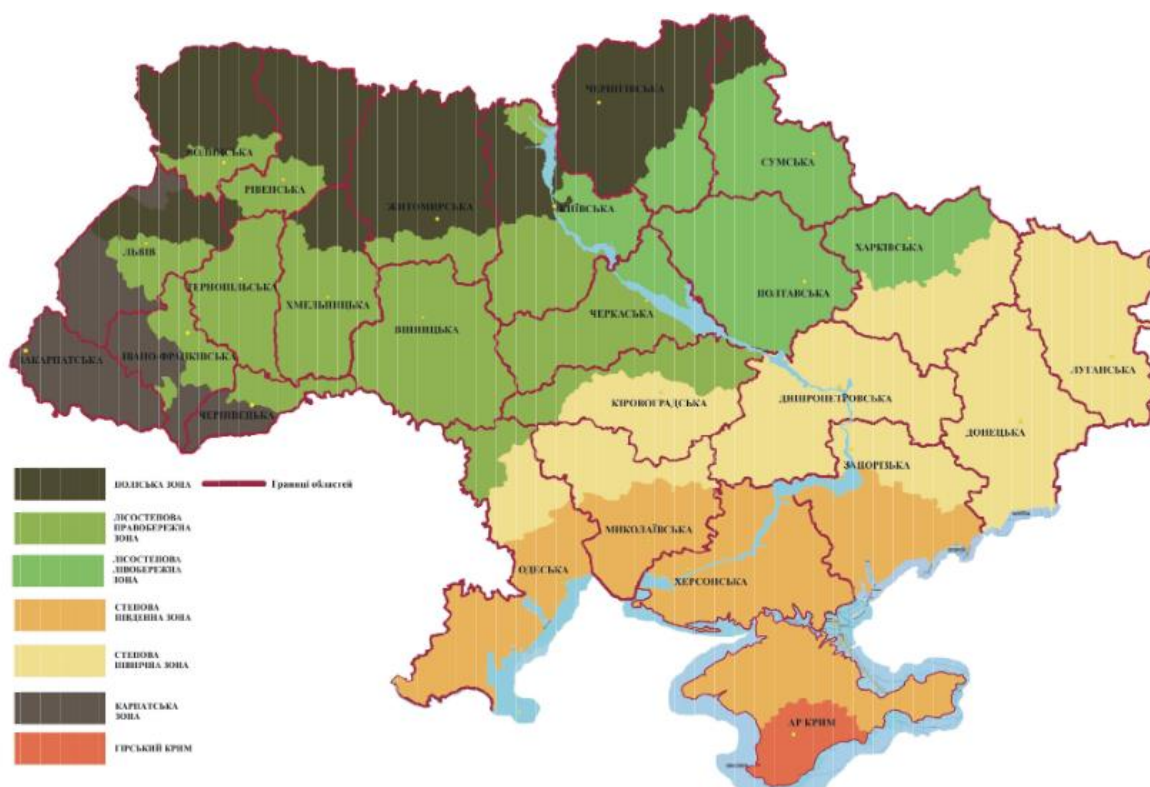
Рис. 1.1. Лісомисливське районування території України []

Лісомисливське районування території України представлено на рис. 1.1.