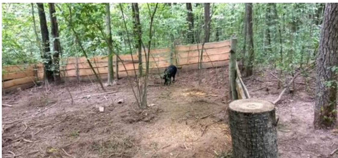
Рис. Б.1. Місце підгодівлі та відпочинку мисливських тварин у мисливських угіддях Овруцького надлісництва