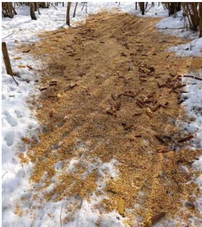
Рис. А.1. Підгодівля мисливських тварин у мисливських угіддях Овруцького надлісництва в необладнаних місцях