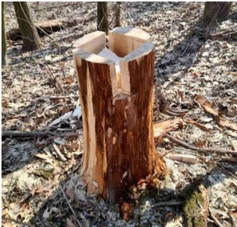
Рис. В.1. Годівниця для копитних мисливських тварин у мисливських угіддях Овруцького надлісництва