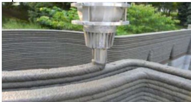
Fig. 3. 3D Construction Process Using the Concrete Printing Technology [1]

Later, another construction 3D printing technology called «Concrete Printing» (CP) was developed. It operates on a similar principle to the CC technology, based on the layered extrusion of a construction mixture. The main difference between CP and CC is the absence of spatulas on the extruder, which allows for the creation of more complex geometric shapes.