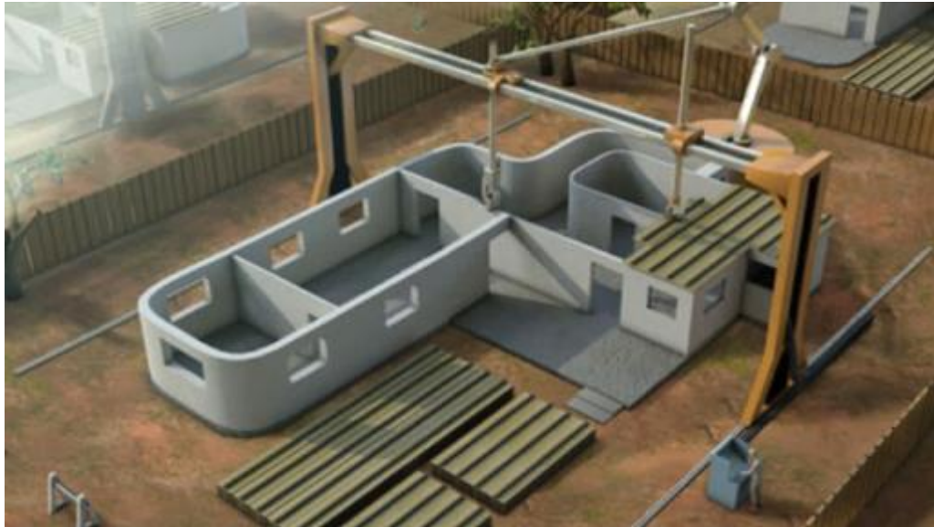
Fig. 2. 3D Printing Setup for Building Construction Using the «Contour Crafting» Technology [1]

The «Contour Crafting» (CC) technology allows for the design of engineering communications within wall cavities and automates their installation using specialized equipment mounted on a frame. During material extrusion, spatulas located on the dispensing nozzle smooth the surface. The height of each layer depends on the size of the spatula and must be sufficient for the upper layers to begin hardening while maintaining the required load-bearing capacity.