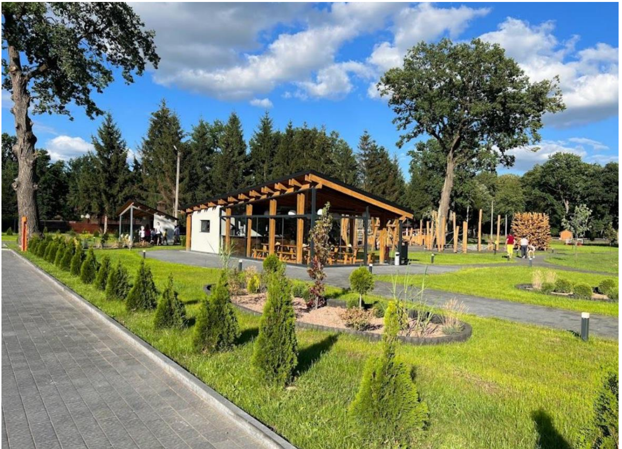
Рис. 4.3. Місце відпочинку «Лісовичок» яке розташоване поруч з дорогою загального користування.

Для недопущення виникнення пожеж в надлісництві проектують та доглядають за рекреаційними пунктами, що дозволяє запобігти потенційним пожежам.