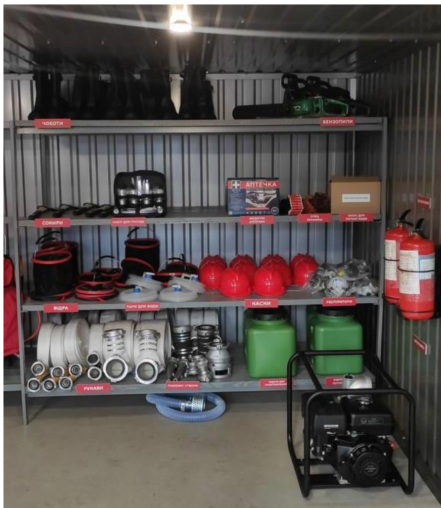
Рис. 4.5 Пункт зберігання протипожежного інвентарю

доступність є запорукою швидкого реагування на загоряння та мінімізації збитків від лісових пожеж.