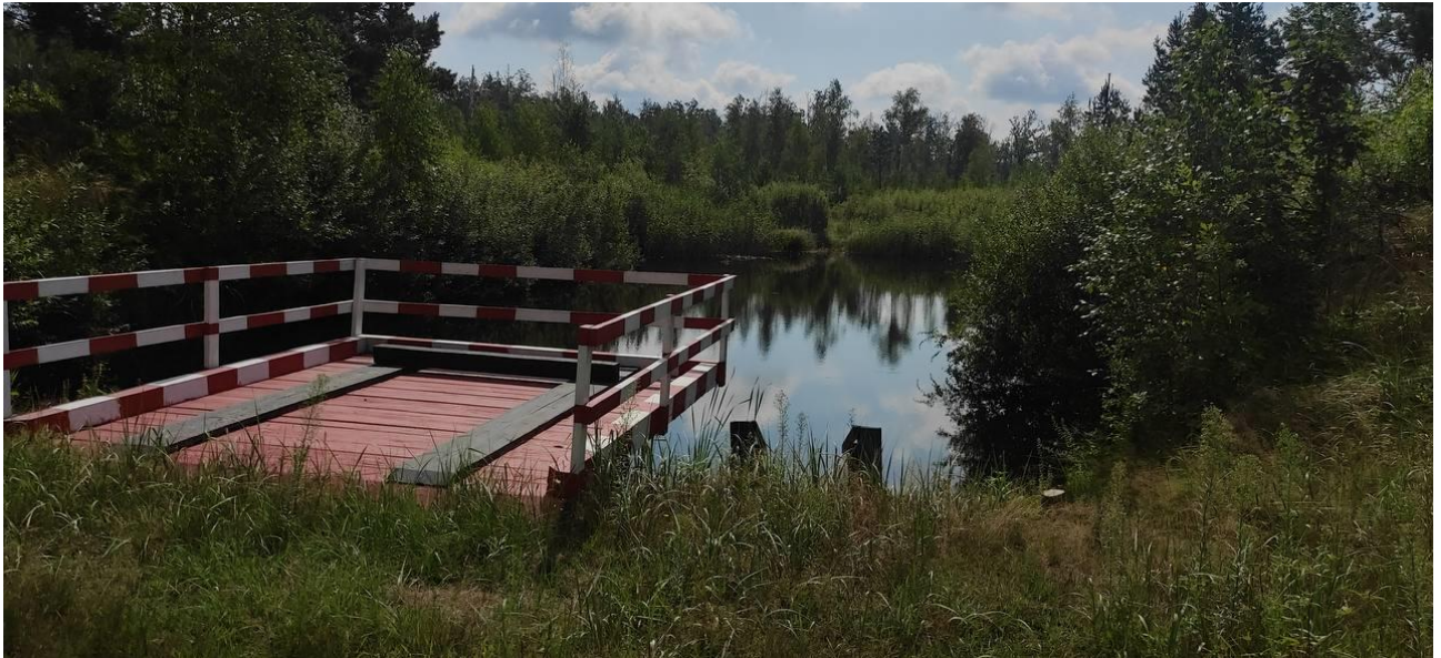
Рис.4.4 пожежна водойма для забору води

На рис. 4.4–4.6 представлено інвентар та засоби для гасіння лісових пожеж.