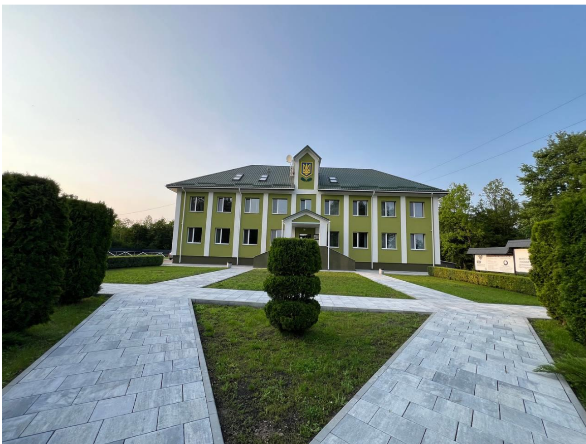
Рис. 3.1. Контора Білокоровицького надлісництва філії «Столичний лісовий офіс» ДП «Ліси України»

Білокоровицьке надлісництво філії «Столичний лісовий офіс» ДП «Ліси України» розташоване в північно-західній частині Житомирської області на території Олевського, Ємільчинського і Лугинського адміністративних районів. Адміністративно-організаційна структура лісгоспу наводиться в таблиці 3.1, а фото контори надлісництва зображено на рис.3.1. Адреса контори: вул. Гагарина, 1 смт. Нові Білокоровичі Коростенський район Житомирська обл.