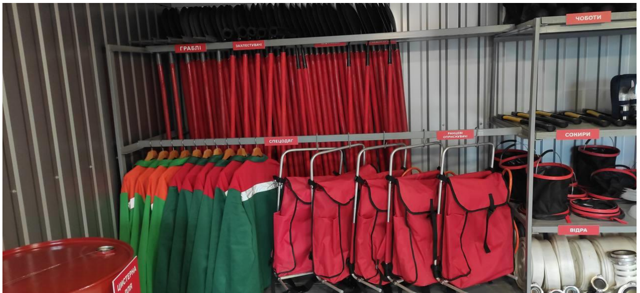
Рис.4.6. Спецодяг та інструмент для гасіння лісових пожеж

Дане фото доповнює картину матеріально-технічного забезпечення підрозділу, демонструючи наявність великої кількості ручного інструменту для безпосередньої боротьби з вогнем на землі та спеціалізованих ранцевих вогнегасників для мобільного реагування. Систематизація, велика кількість однакових одиниць інвентарю та його відмінний стан свідчать про високу готовність підрозділу до ліквідації лісових пожеж та укомплектованість з розрахунку на значну кількість особового складу.