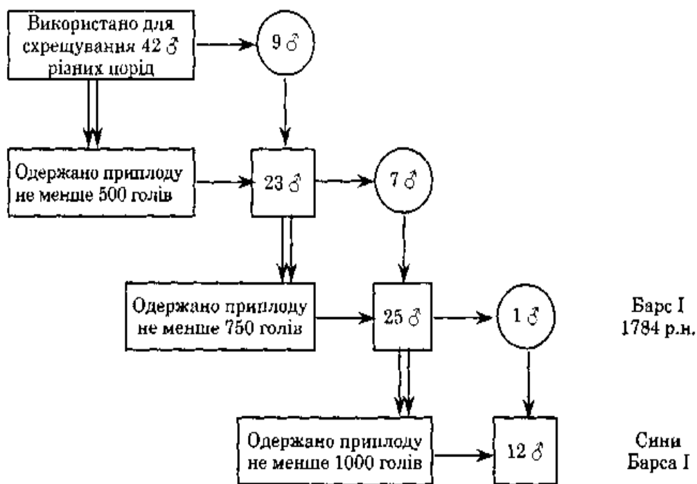
Рис. 1.2. Схема добору жеребців під час створення орловського рисака (у крузі зазначено кількість жеребців, потомки яких мали найбільший вплив на формування породи) за даними автора Мельника Ю.Ф. 2008 р [ 47 ].

Так, серед жеребців першого покоління було відібрано 22 особини, що становило 9,2 % від загальної кількості ровесників. У другому поколінні цей показник склав 25 голів (6,7 %), а в третьому — лише 12 жеребців, або 2,4 %. Усі ці жеребці були нащадками видатного плідника Барса I (1784 р.н.), що свідчить про його виняткову селекційну цінність (рис. 1.2).