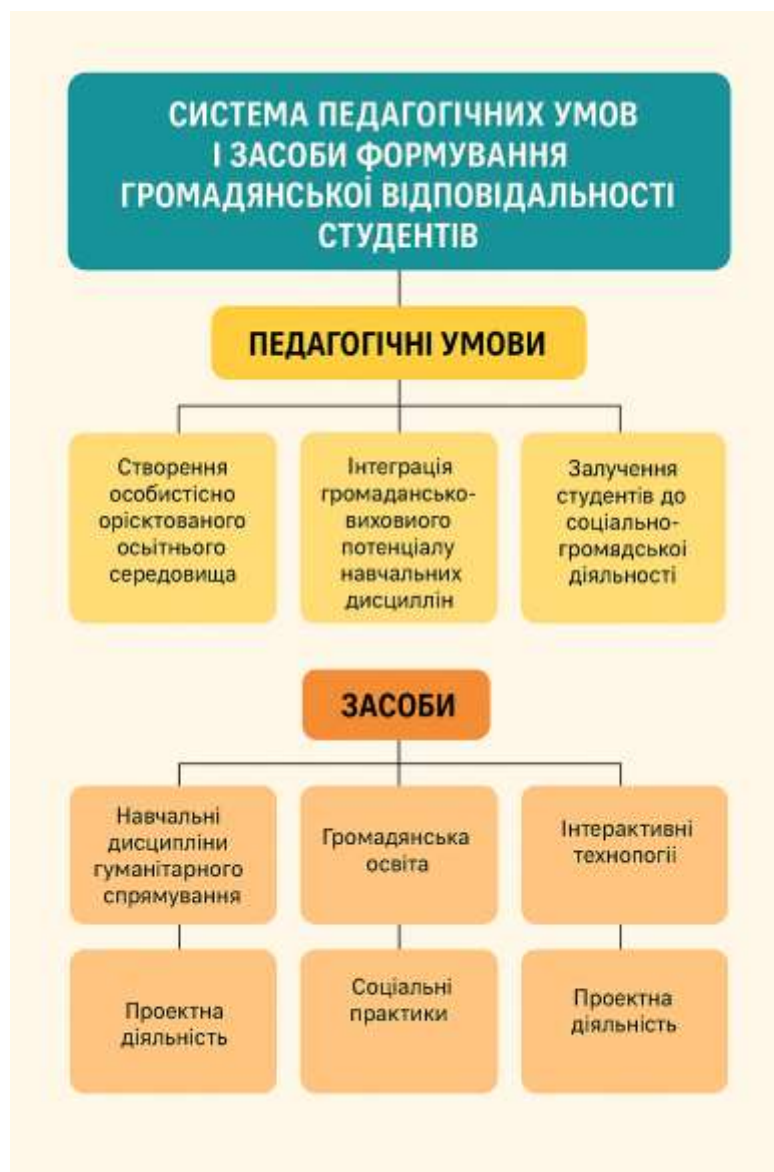
Рис.4. Система педагогічних умов і засобів формування громадянської відповідальності студентів

Ефективність формування громадянської відповідальності забезпечується системним поєднанням педагогічних умов і засобів, що діють у взаємозв'язку (рис. 4).