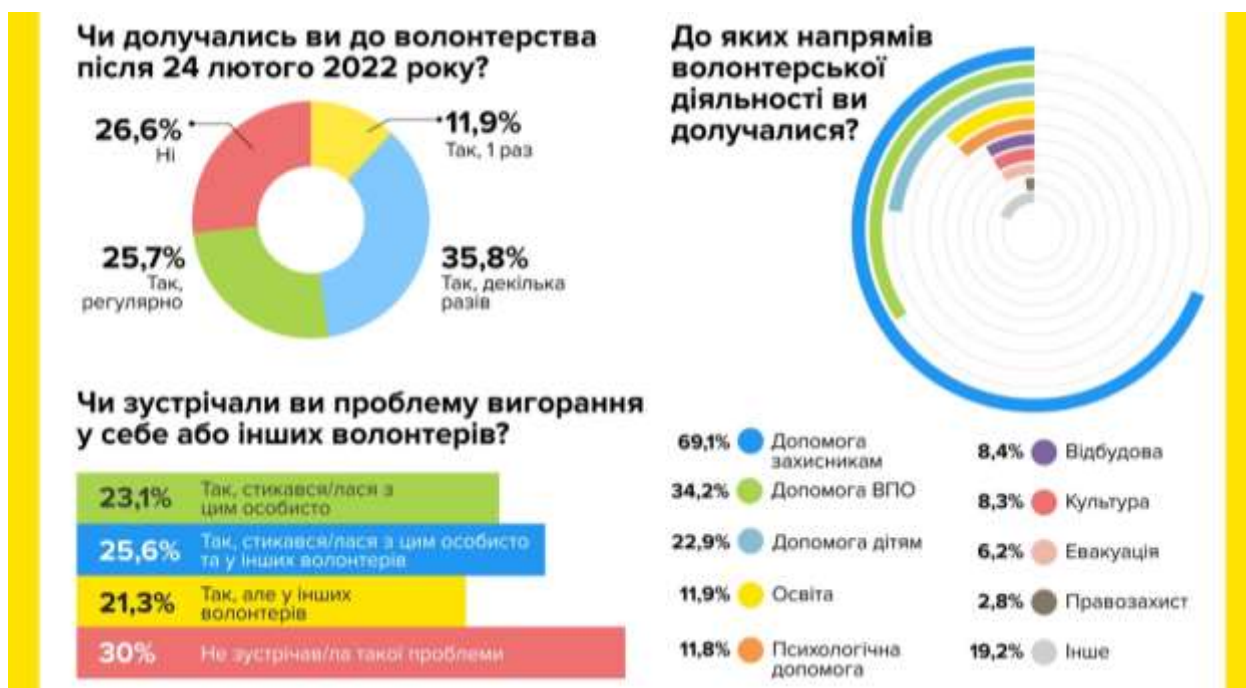
Рисунок 6. Інформація про участь українців у волонтерській діяльності з лютого 2022 р.(за даними УВС та U-Report)

У соціальних мережах Українська Волонтерська Служба (УВС) та U-Report - цифрова платформа ЮНІСЕФ, яка гуртує проактивну молодіжну аудиторію ( https://ukraine.ureport.in/story/1617/ ), надала інфографіку даних про кількість проактивних українців, які взяли участь у волонтерстві, починаючи з початку повномасштабного вторгнення, та напрямів їх діяльності (рис.6).