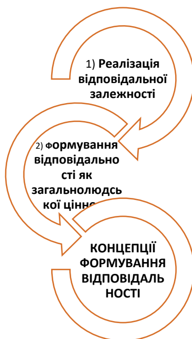
Рисунок 2. Концепції формування відповідальності (за Т.Куницею)[21]

Автором другої концепції є В.Сухомлинський, який вважав, що з раннього віку слід формувати в особистості потребу і здатність жити за принципами загальнолюдських цінностей, добра, відповідно до високих ідеалів, що передбачає розвиток душевності, сердечності, людяності, милосердя тощо.