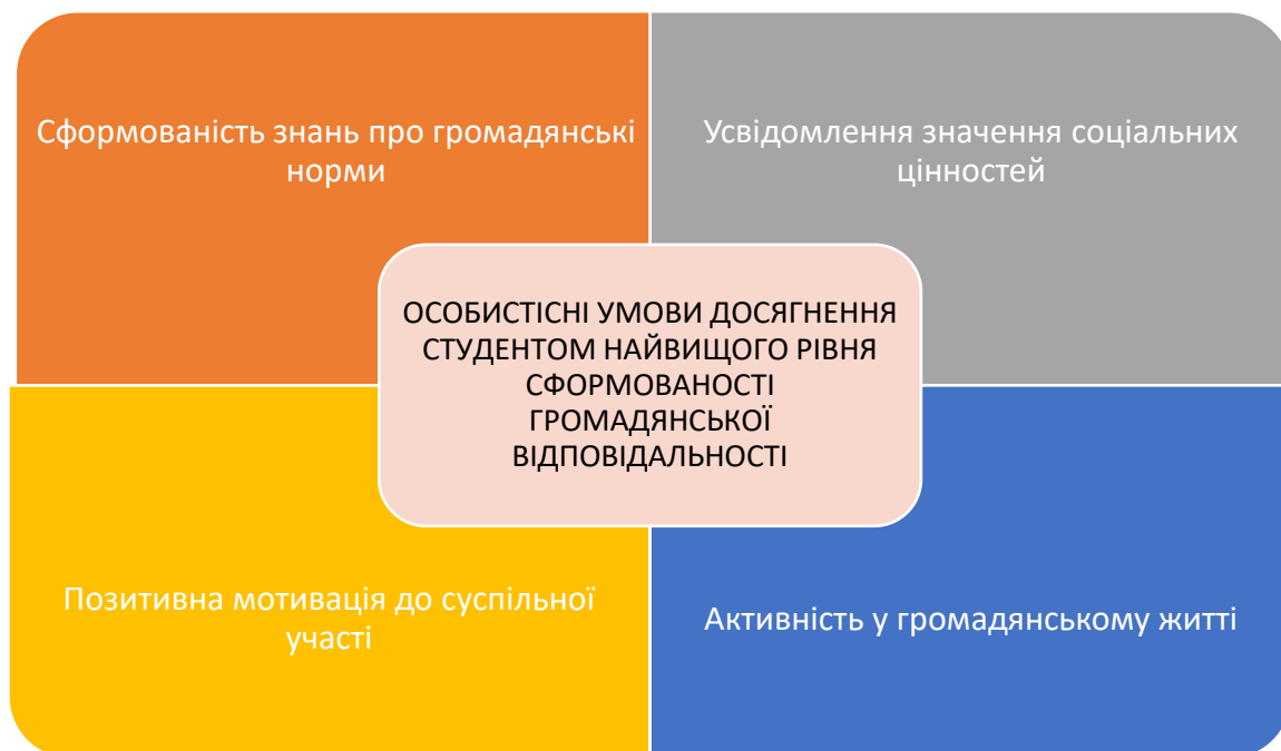
Рис.5. Особистісні умови досягнення студентом найвищого рівня сформованості громадянської відповідальності

Згідно з дослідженнями Л. Хомич [57] і Т. Ладиченко [22], найвищий рівень громадянської відповідальності досягається тоді, коли студент володіє знаннями про громадянські норми; усвідомлює значення соціальних цінностей; має позитивну мотивацію до суспільної участі; виявляє активність у громадському житті (рис.5).