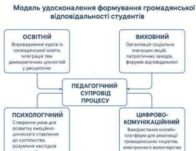
Рис.9. Модель удосконалення процесу формування громадянської відповідальності студентів