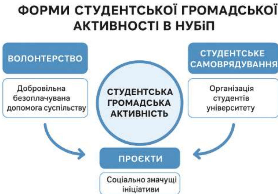
Рис.7. Форми студентської громадської активності у НУБіП України

компетентності: усвідомлення прав і обов'язків, здатність до колективної дії, готовність до суспільного служіння (рис.7).