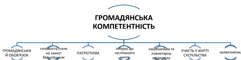
Рис.3. Компоненти громадянської відповідальності (за І.Сопівник)

Контент-аналіз наукових напрацювань з проблеми структури громадянської відповідальності дає змогу диференціювати її загальні компоненти за такими ознаками, що характеризують людину: почуття громадянського обов'язку, патріотизм, готовність стати на захист батьківщини, просуспільна діяльність, інтерес до суспільного життя, участь у житті суспільства, потреба у спілкуванні, колективізм, національна та планетарна свідомість (рис. 3).