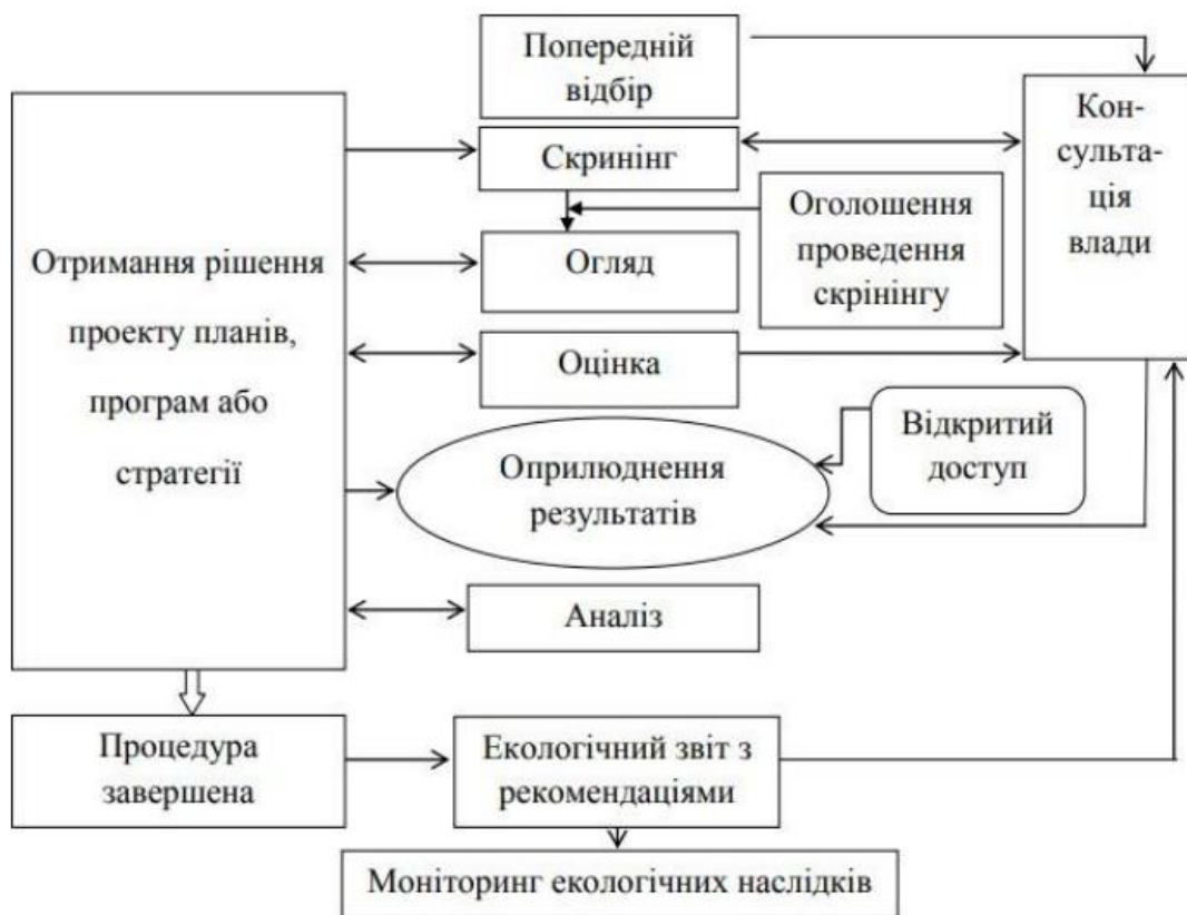
Рис. 1.1. Узагальнена схема процедури СЕО

СЕК ООН. Метою Протоколу є забезпечення високого рівня захисту довкілля, у тому числі здоров'я населення, шляхом: