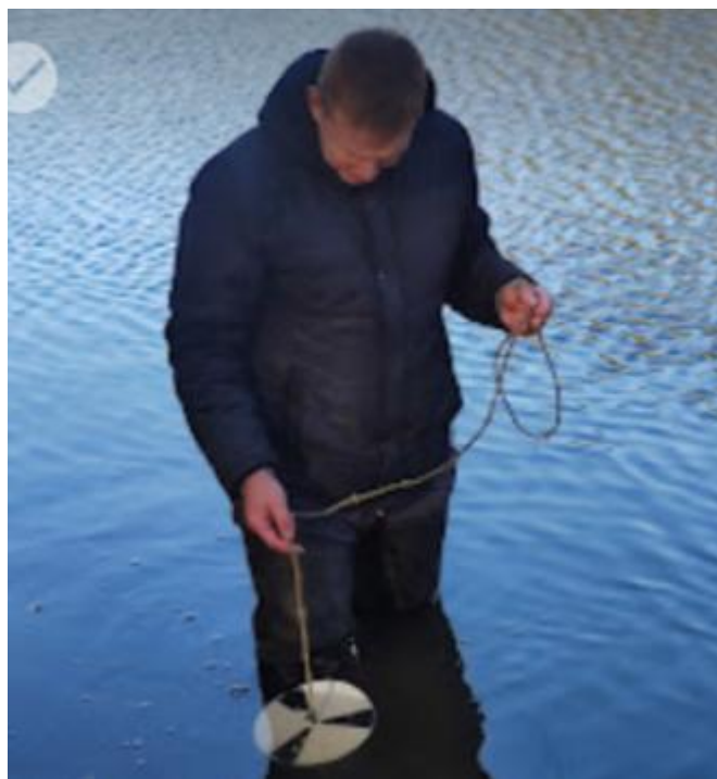
Рис. 2.2. Дослідження прозорості води з диском Секкі.

Прозорість води досліджували з допомогою диску Секкі (рис. 2.2)