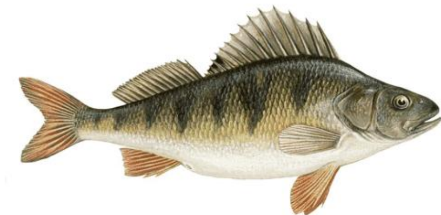
Рис. 1.7. Зовнішній вигляд річкового окуня ( Perca fluviatilis )

Окунь звичайний ( Perca fluviatilis ) (рис. 1.7) поширений в Європі, за виключенням Іспанії, Португалії та північної Скандинавії).