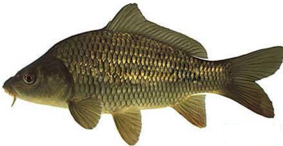
Рис. 1.4. Зовнішній вигляд коропа ( Cyprinus carpio )

Короп ( Cyprinus carpio ). Тіло коропа може сягати приблизно 1 м завдовжки, а маса окремих особин інколи перевищує 20 кг. Риба має масивну будову та широку спину. Забарвлення плавців варіює від світло-коричневого чи червонуватого до майже чорного. Луска відрізняється за величиною й кольором залежно від форми. Існують різновиди, у яких луска покриває лише частину тіла (дзеркальний короп), а також форми, практично позбавлені луски (рис. 1.4).