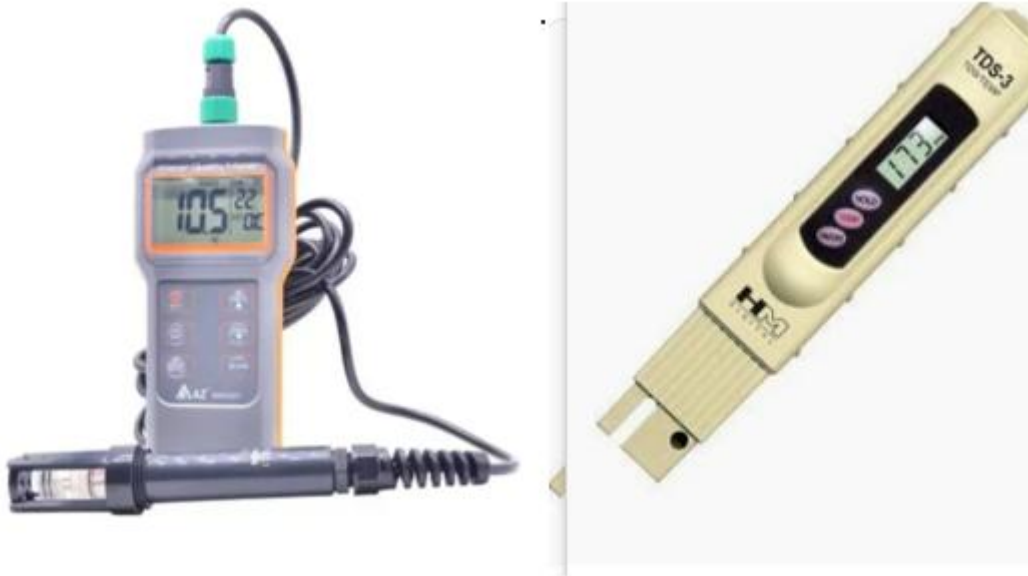
Рис. 2.3. Прилади для дослідження рН, кількості розчиненого у воді кисню та ТДС.

водоймі заміряли рН та кількість розчиненого у воді кисню та ТДС з допомогою електронних приладів (рис. 2.3).