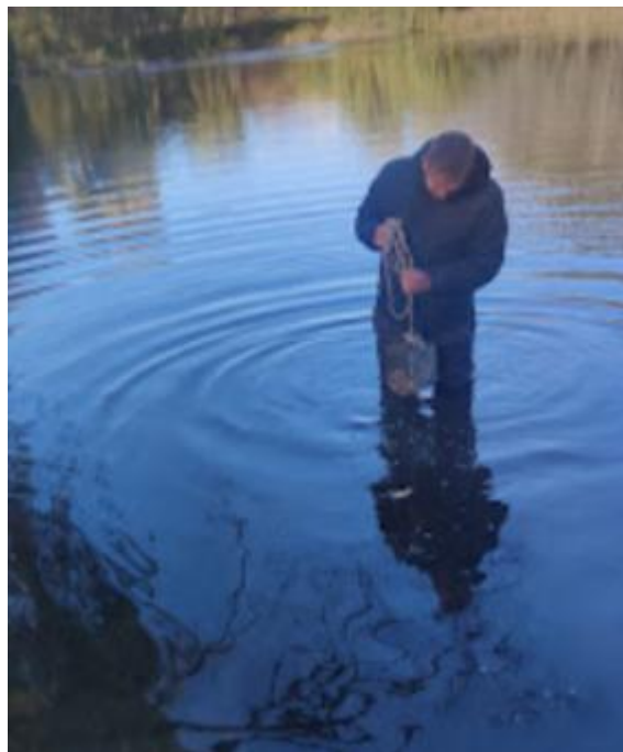
Рис. 2.4. Збір проб зообентосу.

Збір проб бентосу здійснювали з допомогою дночерпака (рис. 2.4).