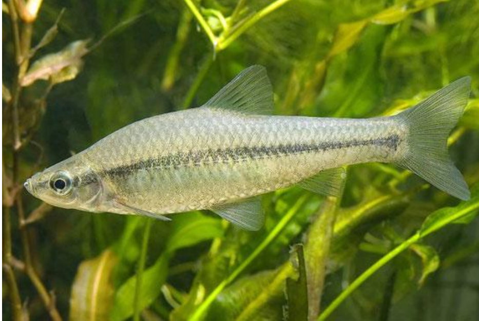
Рис. 1.5. Зовнішній вигляд амурського чебачка ( Pseudorasbora parva )

Амурський чебачок ( Pseudorasbora parva ). Вид досягає довжини 10 см. (рис.1.5).