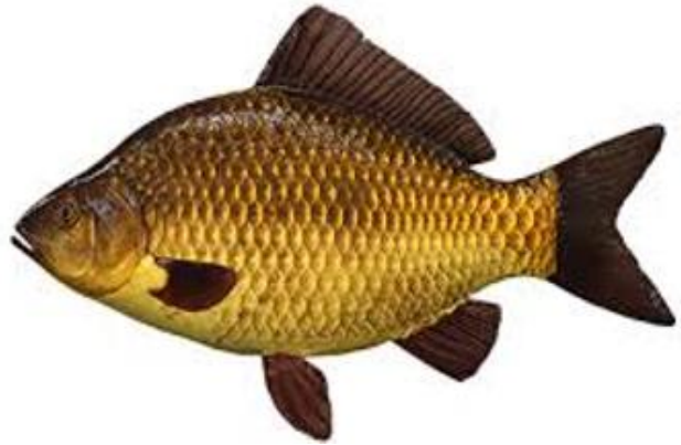
Рис. 1.3. Зовнішній вигляд сріблястого та звичайного карася ( Carassius gibelio )

В Україні мешкає два види карась звичайний, або золотий та сріблястий, який є інтродуцентом. Назви карасі отримали через своє забарвлення. Сріблястий карась виявився більш пристосований до екологічних умов України і поступово витісняє звичайного. Сріблястий карась помітно відрізняється від золотого: у нього світле, срібне черевце, більша кількість зябрових тичинок, а хвостовий плавець має глибшу виїмку. Промені спинного та анального плавців у цього виду жорсткіші, часто із зазубреними краями, що також є характерною видовою ознакою. Спинний плавець у карасів обох видів довгий і злегка заокруглений на верхівці. У золотого карася грудні та черевні плавці мають слабкий червонуватий відтінок, тоді як у сріблястого вони переважно сірі або жовтуваті, подібно до решти плавців у риб обох видів. Рот у карасів невеликий, позбавлений вусиків і зубів; натомість глоткові зуби розташовані в один ряд.