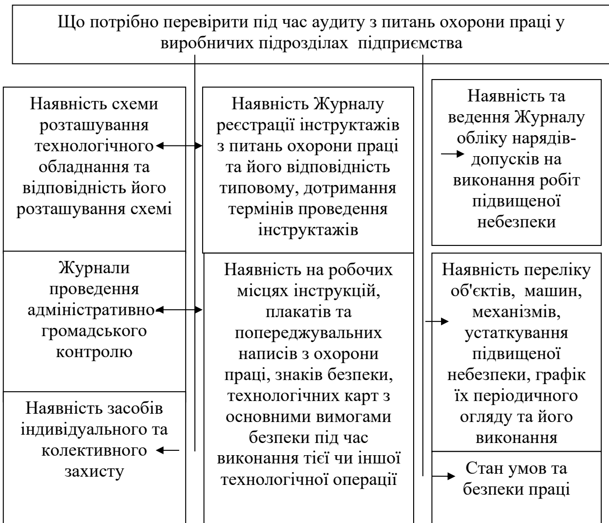
Рис. 5. 1. Перелік працезохоронних документів та місць контролю з охорони праці у виробничих підрозділах

На підприємствах практикується оперативний контроль за охороною праці. Головний рибовод разом із уповноваженим від трудового колективу здійснює періодичний огляд виробничих ділянок, перевіряє дотримання трудового законодавства, стан обладнання, наявність інструкцій, проведення інструктажів, використання засобів індивідуального захисту і вживає заходів щодо усунення недоліків. Після отримання повідомлення про плановий захід із контролю стану охорони праці, головний рибовод проводить попередній внутрішній аудит у підрозділах, що йому підпорядковані (рис. 5.1).