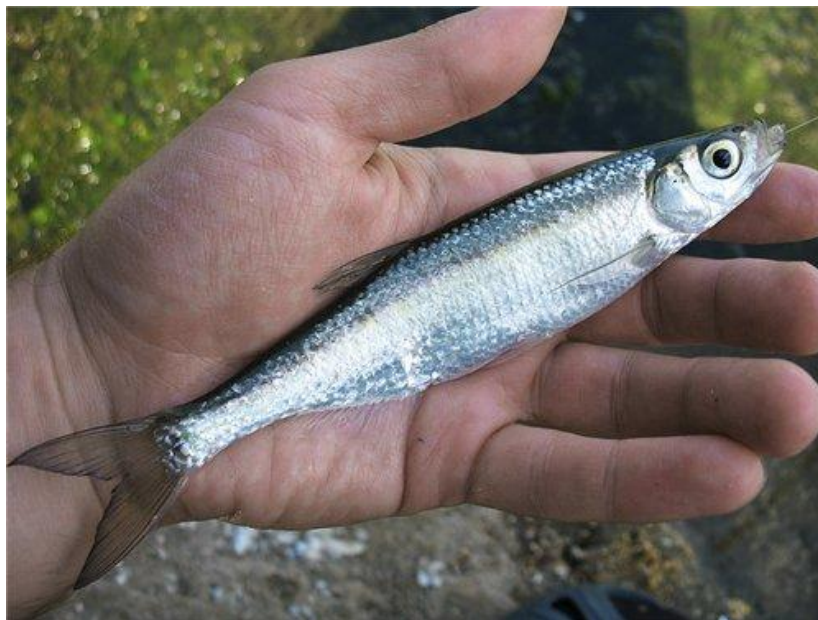
Рис. 1.2. Зовнішній вигляд верховодки ( Alburnus alburnus alburnus L.)

Верховодка (Уклея)- ( Alburnus alburnus alburnus L.) (рис. 1.2).