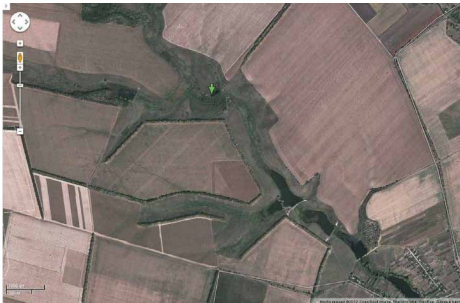
Рис. 2.1. Схема водосховищ річки Здвиж за космічним знімком

Дослідження проводили в листопаді 2025 р. В якості водойми було вибрано мале водосховище на річці Здвиж в межах села Капустинці. (рис. 2.1).