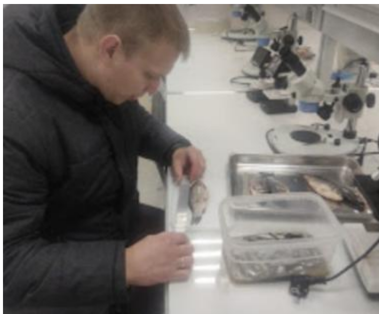
Рис. 2.5. Обробка іхтіологічних проб.

іхтіології. Зоопланктон збирався шляхом проціджування ста літрів води через планктонну сітку. Іхтіологічні проби оброблялись в Центрі водних біоресурсів і аквакультури (рис. 2.5).