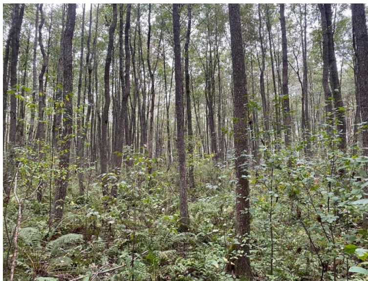
Рис. Б.2. Насадження на ТПП 5. Склад – 5Влч5Бп, вік – 67 років