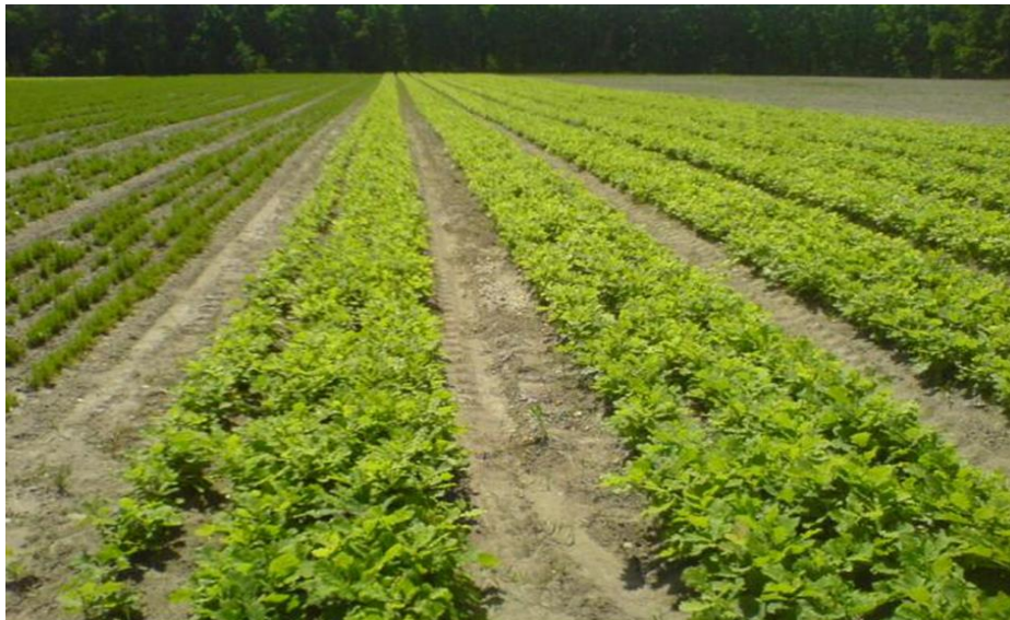
Рис. 3.3. Посівне відділення базового розсадника

Садивний матеріал, що вирощений у лісових шкілках, використовують переважно під час озеленення садиб та адміністративних будівель лісництв, сільських рад, шкіл в районі діяльності підприємства, а надлишковий матеріал реалізують за межі цього району.