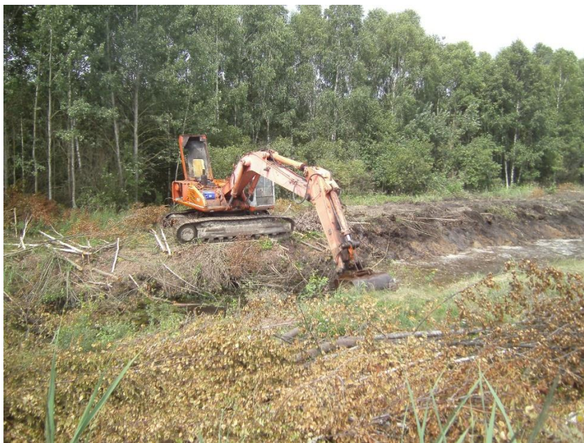
Рис. 4.1. Розчищення меліоративного каналу в Жиричівському лісництві

Протягом останніх двох років фінансування даного напрямку робіт дещо покращилося. Завдяки наданому фінансуванню проведено розчищення осушувальних каналів загальною протяжністю 18 км. На рис. 4.1 проілюстровано розчищення осушувального каналу в Жиричівському лісництві.