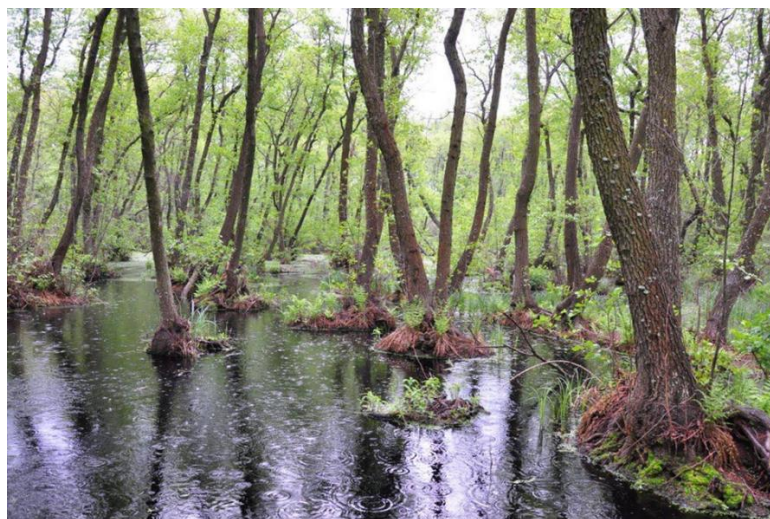
Рис. 5.5. Насадження вільхи клейкої в умовах із проточним зволоженням

річкових заплав та на вологих рівнинах. Відзначається досить інтенсивним ростом. Це світлолюби вий вид, який може доживати до 80-100 років. Здебільшого рекомендується для використання під час створення лісових насаджень у заплавах частинах річок, місцях із проточним зволоженням. Вона поселяється здебільшого на достатньо дренованих і аерованих ґрунтах алювіального походження, зокрема сірих лісових із суглинистим механічним складом, а також чорноземних ґрунтах з високим вмістом гумусу. Оптимальними умовами для зростання цього деревного виду є сирі діброви, де рівень ґрунтових вод під час літнього періоду залягає на глибині 0,5-1,0 м. Достатньо інтенсивним ростом вільха клейка відзначається і на вологих та мокрих ґрунтах болотної місцевості (рис. 5.5). Найбільшою продуктивністю характеризуються вільхові насадження переважно в судібровних типах лісу, які мають відповідну вологість. Вільха клейка також може поширюватися в посушливих районах і може за достатнього вмісту вологи в ґрунті досить легко переносити сухе повітря.