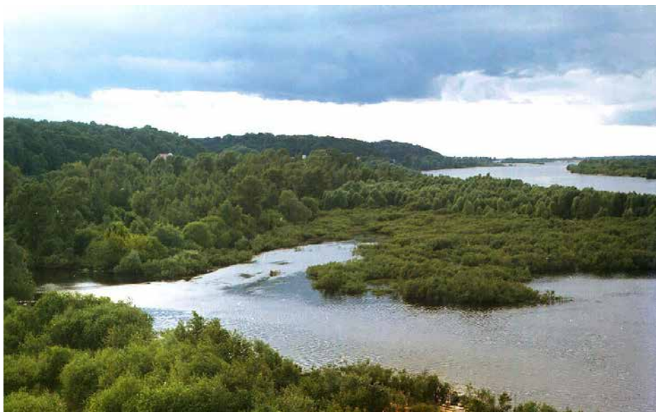
Рис. 4.2. Загальний вигляд річки Прип'ять

Загальна довжина русла річки Прип'ять складає 775 км (територією України – 261 км), площа її басейну становить 121000 км 2 . У верхів'ї долина річки виражена досить слабо, у в пониззі – значно чіткіше. Заплава досить розвинена по всій протяжності річки. На заплаві виділяють дві надзаплавні тераси. У верхній частині течії ширина заплави складає 2-4 км і більше. Під час окремих років вона здатна затоплюватися на кілька місяців [13]. У нижній частині течії ширина заплави може сягати 10-15 км. Річище у верхів'ї каналізоване, а в нижній – переважно звивисте, формує стариці, меандри, багато проток (одна з яких сполучена з озером Нобель), наявні піщані острови (рис. 4.2). Ширина русла Прип'яті у верхній течії становить до 40 м, у середній течії сягає 50-70 м, в нижній частині – від 100 до 250 м. У місці впадання русла у Київське водосховище його ширина становить 4-5 км. Дно переважно піщано-мулисте і піщане. Ухил річки складає 0,08 м/км. Живлення річки мішане.