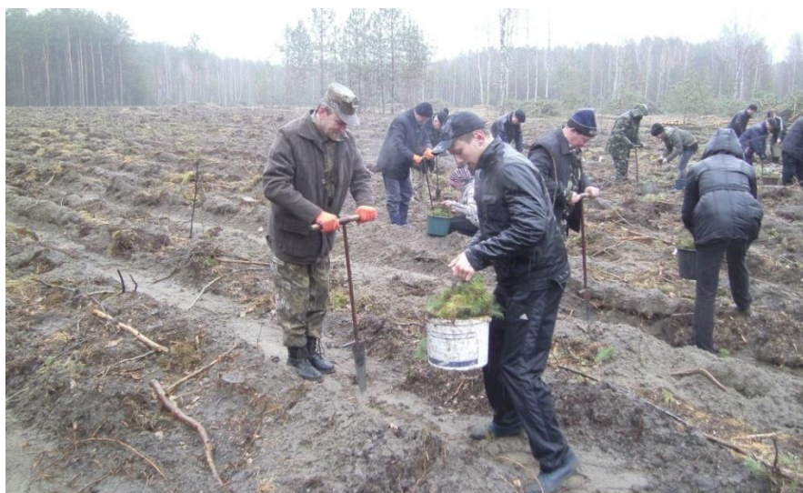
Рис. 5.1. Садіння лісових культур під меч Колесова у Кортеліському лісництві

Основним способом створення лісових культур протягом досліджуваного періоду було ручне садіння. Ручне садіння виконувалося під меч Колесова (рис. 5.1). Головний деревний вид визначали згідно типу лісорослинних умов лісокультурної ділянки. В умовах сухих, свіжих і вологих борів, а також суборів і складних суборів у якості головного виду використано сосну звичайну. Культури вільхи, як зазначалося вище, створювалися переважно в умовах сирих суборів, а також сирих і вологих складних суборів.