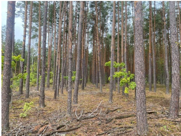
Рис. Б.1. Насадження на ТПП 10. Склад – 8Сз2Бп, вік – 33 роки