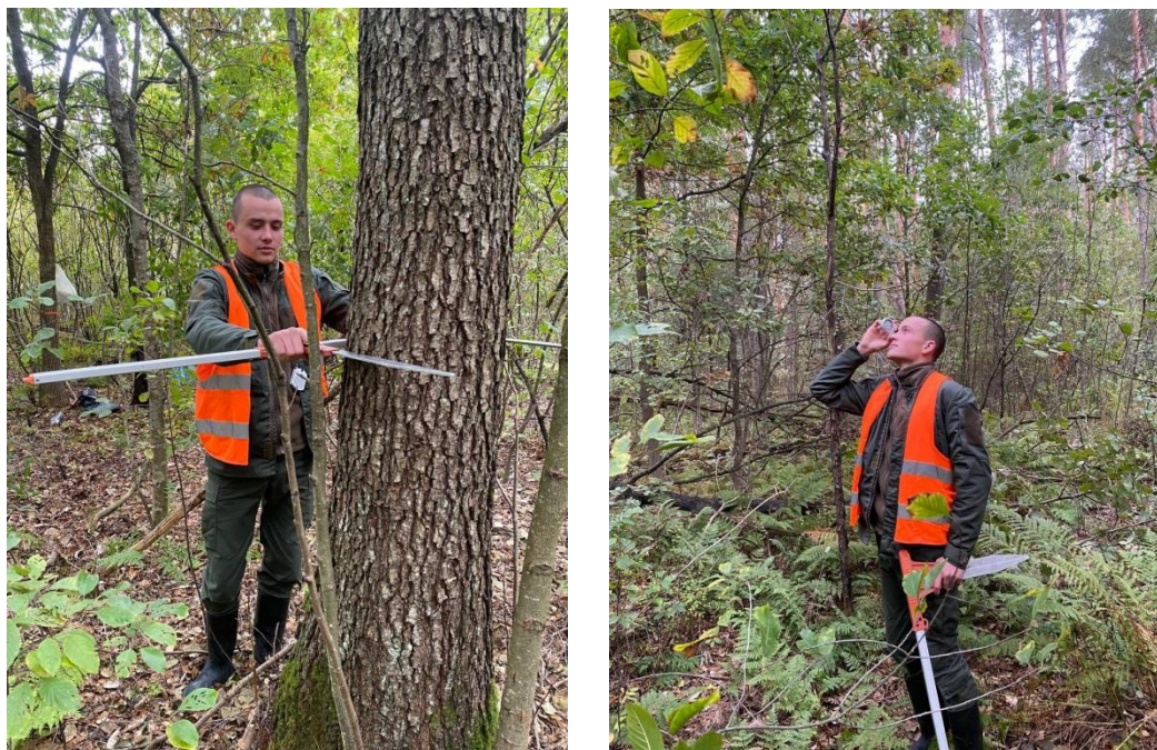
Рис. 2.1. Вимірювання діаметрів стовбурів та висот дерев під час закладки ТПП

методиками визначали особливості росту деревних видів рослин, наявність та склад підліску, підросту, товщину лісової підстилки тощо.