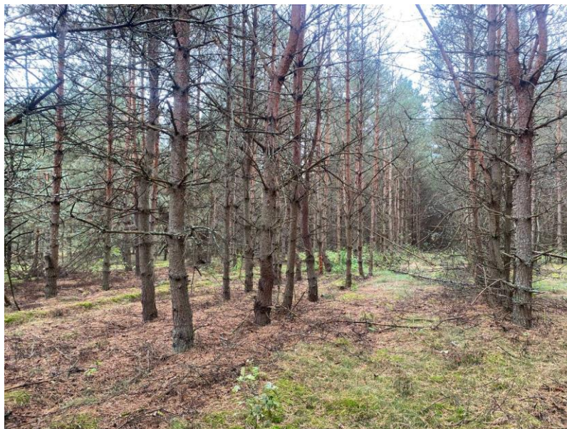
Рис. Б.3. Насадження на ТПП 2. Склад – 7Сз3Бп, вік – 44 роки