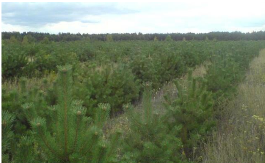
Рис. 5.2. Лісові культури сосни звичайної в Гірницькому лісництві

Всі закладені протягом останнього ревізійного періоду лісові культури за агротехнікою обробітку ґрунту, способу садіння, а також підбору головного та супутніх деревних видів рослин, здебільшого відповідали рекомендаціям лісовпорядкування (рис. 5.2).