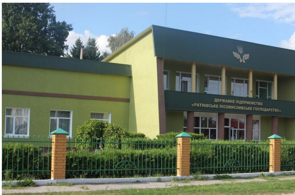
Рис. 3.1. Адміністративна будівля філії “Ратнівське лісомисливське господарство”

Філія «Ратнівське лісомисливське господарство» Державного спеціалізованого господарського підприємства «Ліси України» була організована у жовтні 2022 року. Підприємство розташоване в північній частині Волинської області на території Ратнівського та Камінь-Каширського адміністративних районів. Поштова адреса підприємства: 44100 Волинська область, смт Ратно, вул. Б.Хмельницького, 67. На рис. 3.1 показана адміністративна будівля філії.