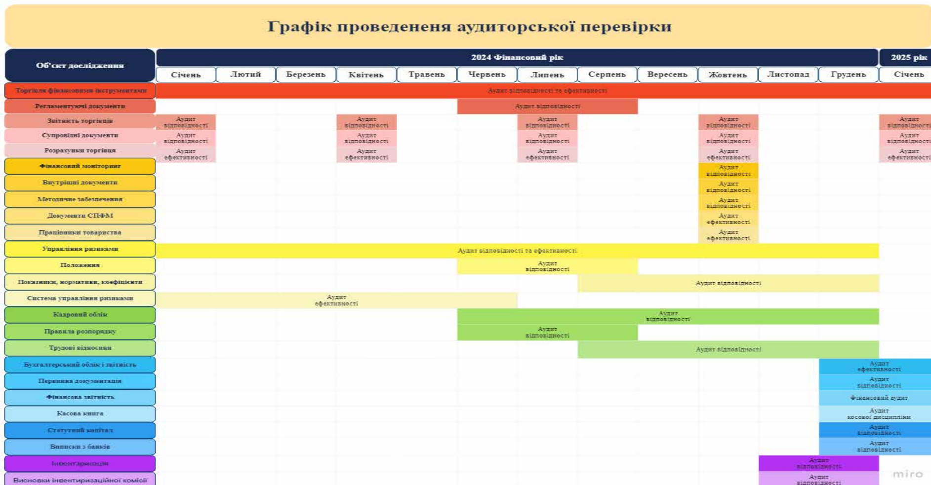
Графік проведення аудиторських перевірок в ТОВ «ІНВЕСТУДІО» на 2024 рік