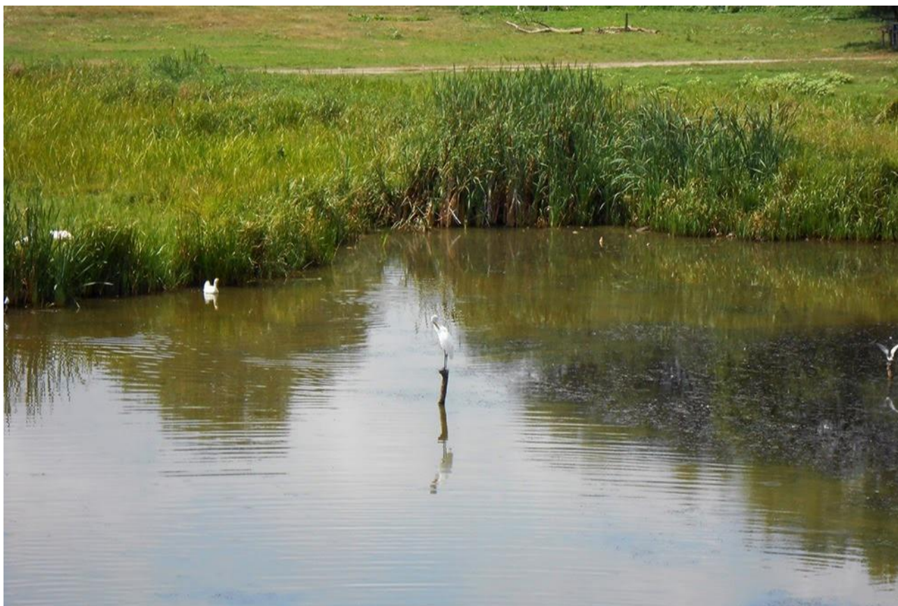
Рис. 1.5. Орнітофауна Турбівського водосховища [11]

Птахи цього регіону представлені водно-болотними видами, зокрема лискою, водяною курочкою, крижнем та деркачем, на яких дозволено любительське полювання. Крім того, на цій водоймі зустрічаються лебеді-шипуні, крячки, сірі та білі чаплі (рис.1.5).