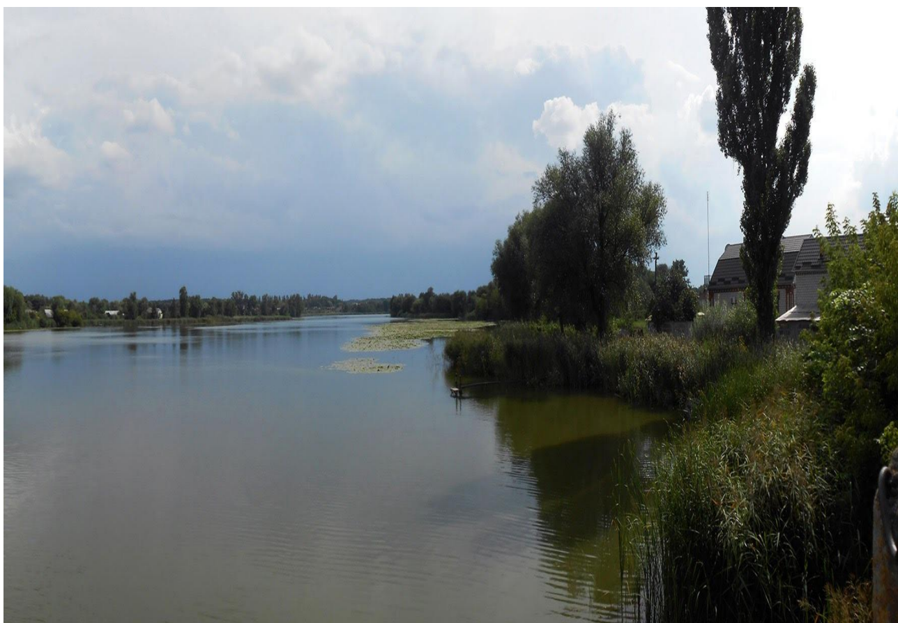
Рис. 1.4. Флора Турбівського водосховища [11]

Територія навколо водосховища та його приток (річок) захищена деревами та чагарниками (рис.1.4).