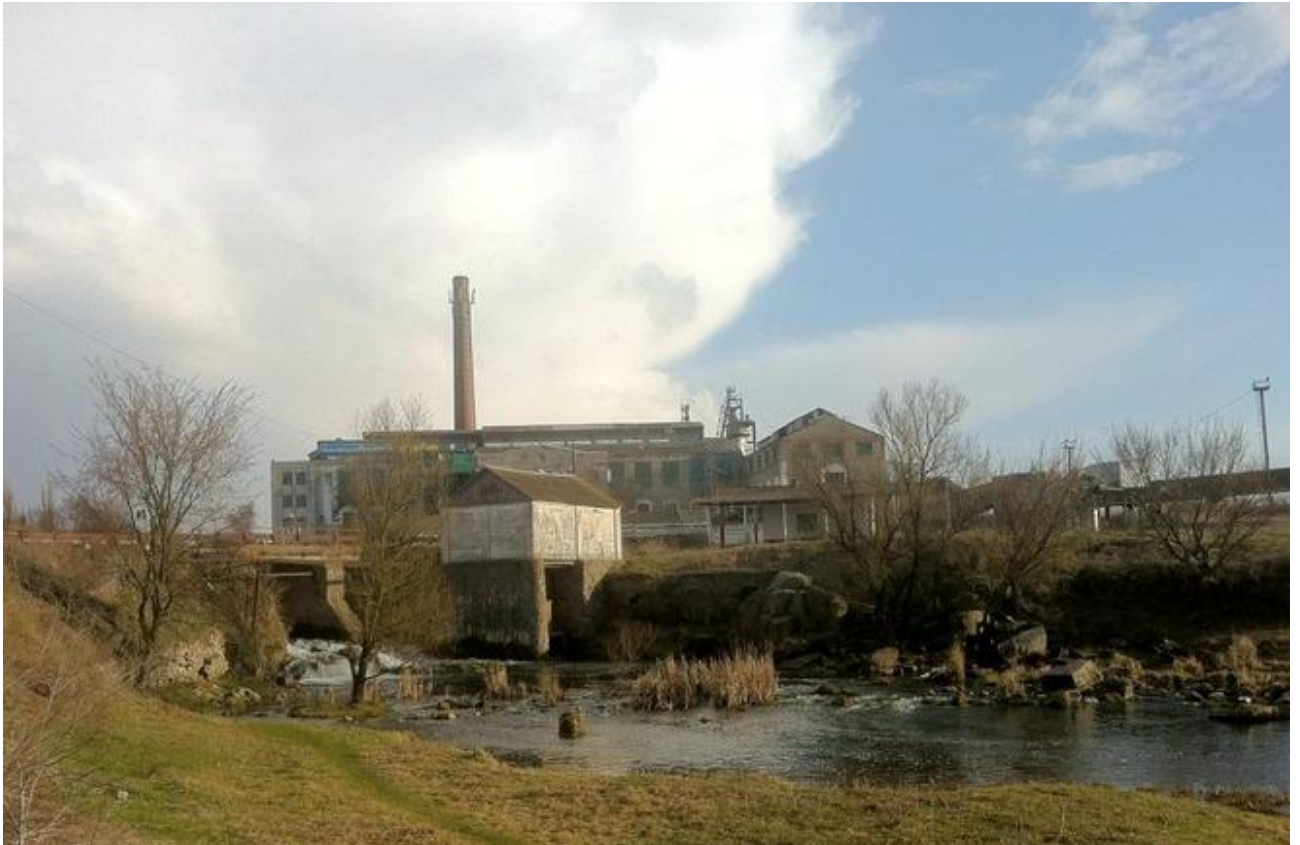
Рис. 3.1. Гребля Турбівського водосховища на тлі цукрового заводу [14]