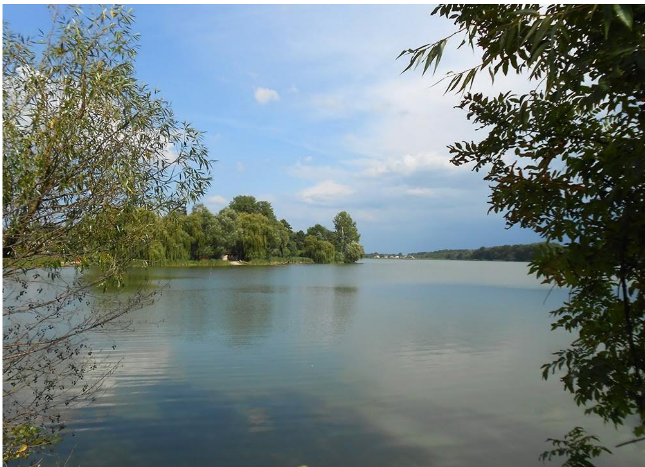
Рис. 1.2. Турбівське водосховище [11]

Турбівське водосховище (рис. 1.2) було споруджене у 1892 році на річці Десна з метою водопостачання [9].