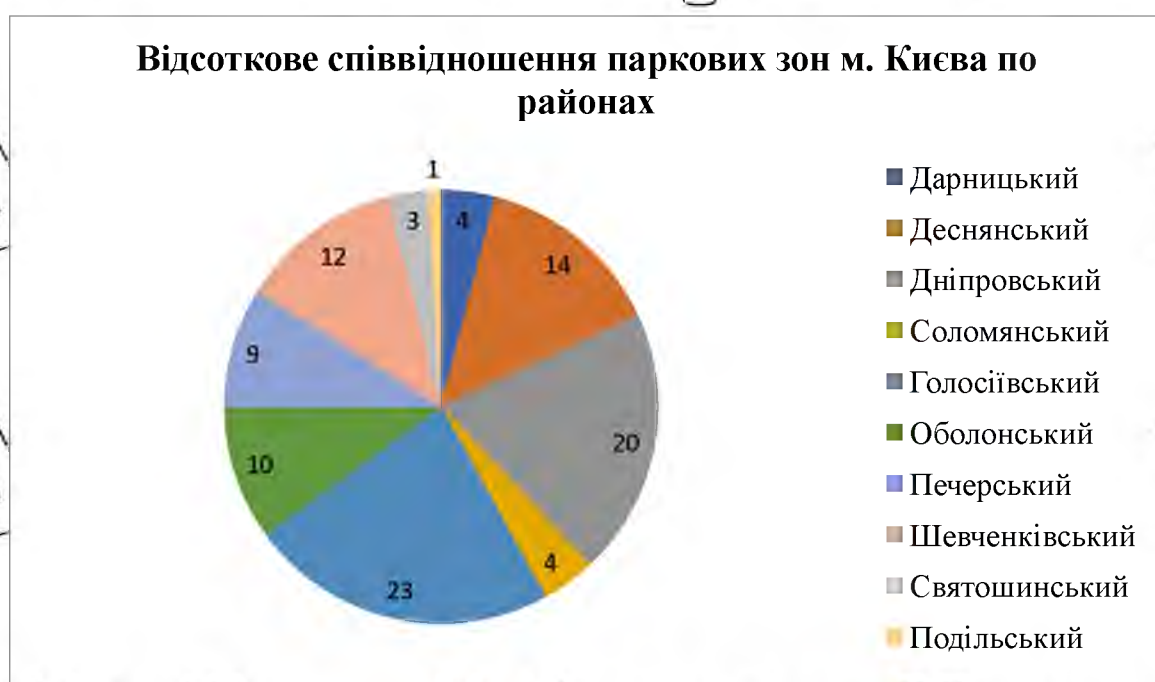
Рис. 1.3.1. Відсоткове співвідношення паркових зон м. Києва по районах

Якщо говорити про паркові зони у розрізі окремих районів Києва, то можна представити їхнє співвідношення наступним чином (Рис. 1.3.1. Відсоткове співвідношення паркових зон м. Києва по районах) [57, с. 70]