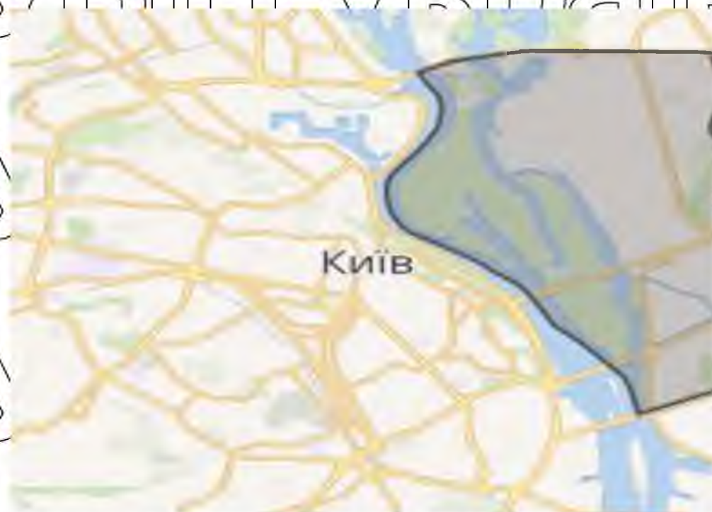
Рис. 2.1.1. Дніпровський район м. Києва

Район межує із Правим берегом Києва, проспектом Генерала Ватутіна, Братиславською вулицею, чернігівським напрямком. Загалом район межує із Дарницьким, Деснянським, Печерськими районами міста. Карту Дніпровського району подано на Рис. 2.1.1. Дніпровський район м. Києва.