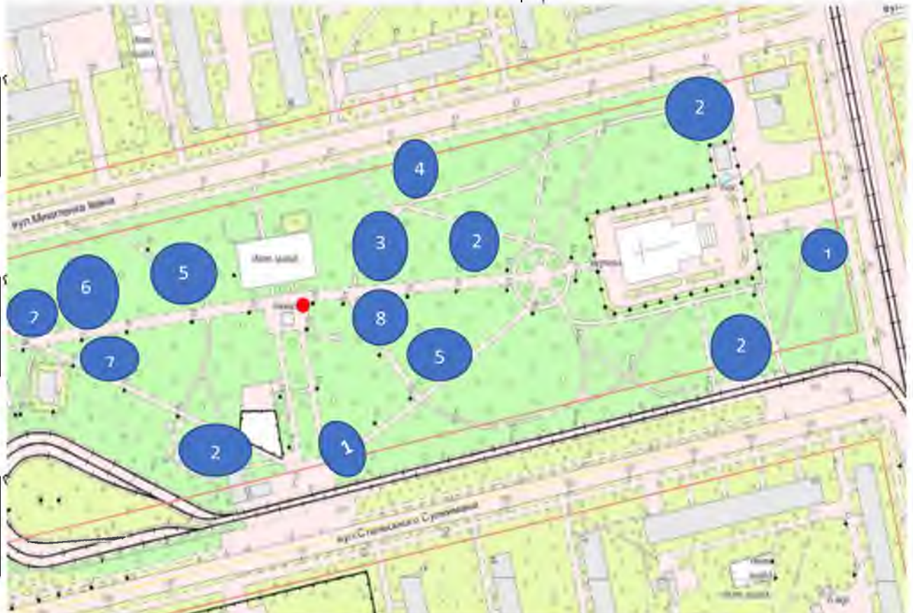
Рис. 3.1.1. Покращення паркової зони Дніпровського району м. Києва на прикладі парку «Аврора»

що відображено на Рис. 3.1.1. Покращення паркової зони Дніпровського району м. Києва на прикладі парку «Аврора».