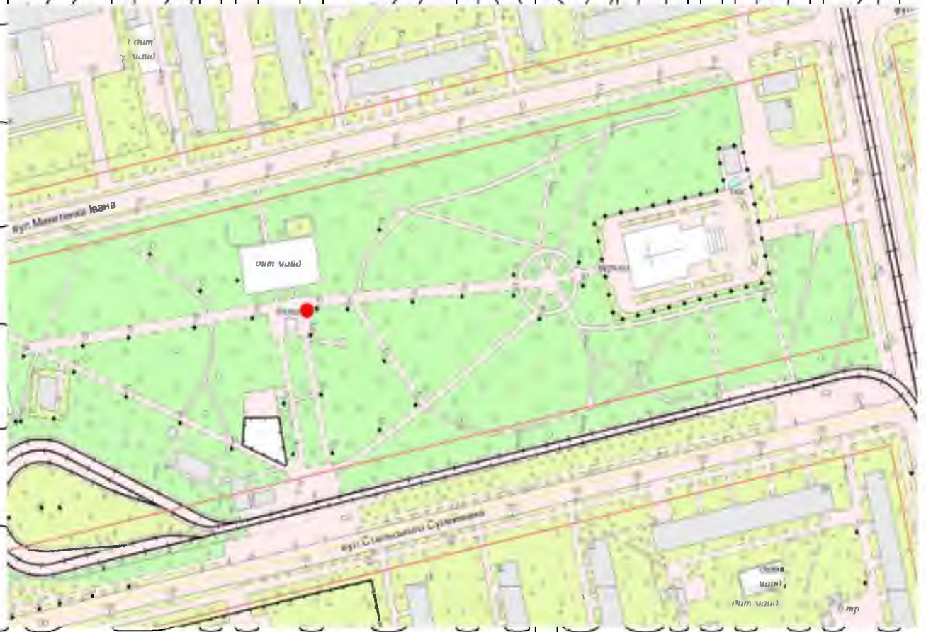
Рис. 2.3.1. Схема парку «Аврора» у Дніпровському районі Києва

Умовно схема парку подана на Рис. 2.3.1. Схема парку «Аврора» у Дніпровському районі Києва [60, с. 31]