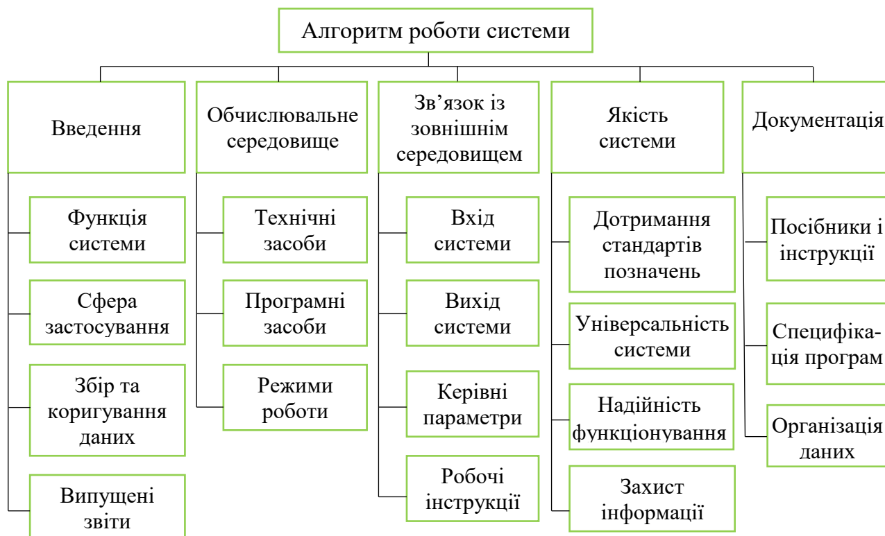
Рис. 3. Структура алгоритму роботи системи

На етапі тестування визначали правильність виконання програм. При цьому використовували дані, характерні для системи у робочому стані. Тут же проводили випробування системи, тобто виконували тести, що показують, що система функціонує відповідно до розроблених до неї специфікацій.