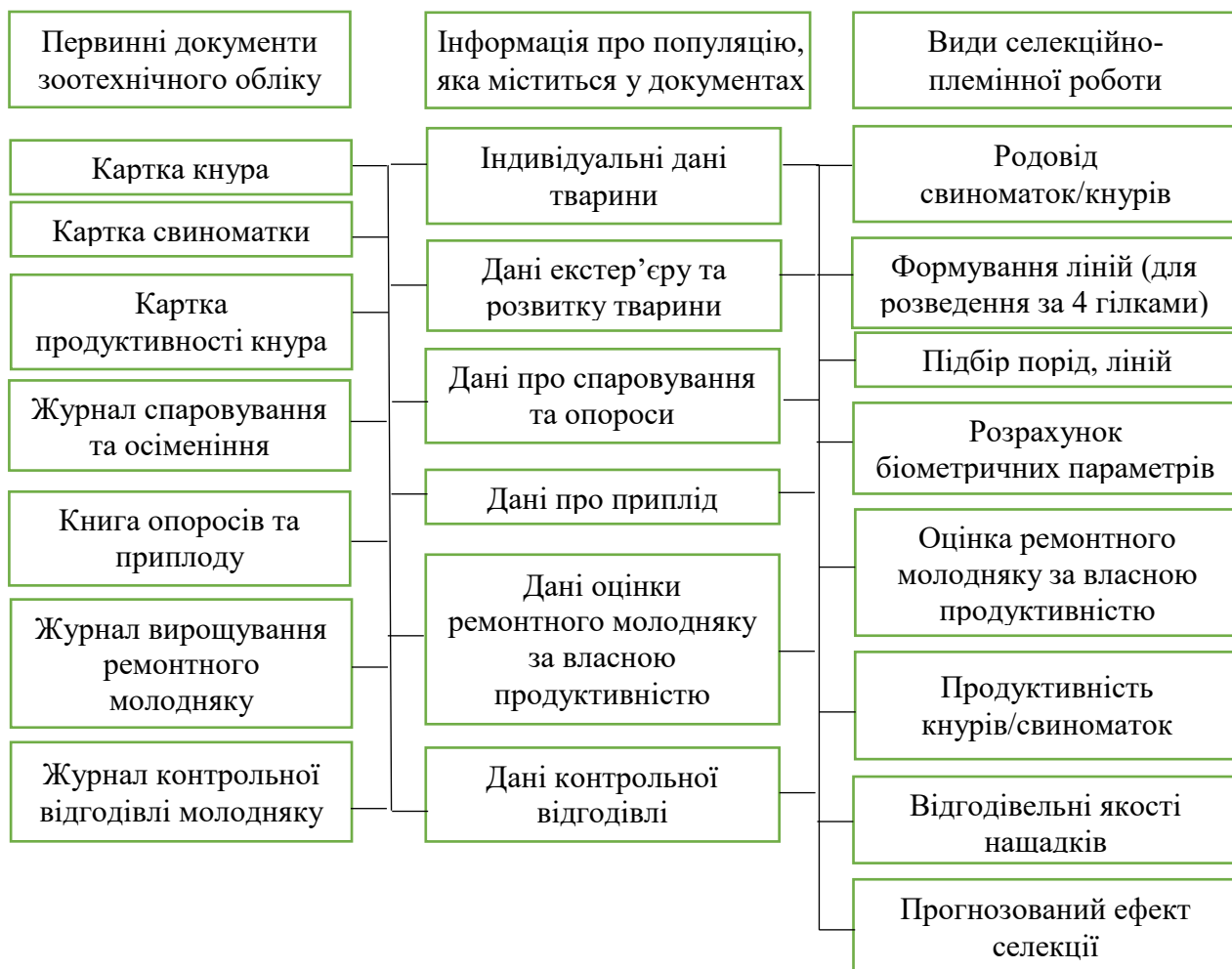
Рис. 2. Використання даних зоотехнічного обліку у селекційному процесі

З метою логічного використання інформаційних даних продуктивності аналізувалась схему руху та використання даних у селекційному процесі за схемою рис. 2.