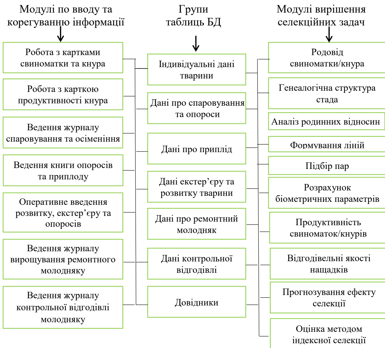
Рис. 4. Схема функціональних модулів та груп даних системи ІАС

На початковому етапі роботи в системі Windows був розроблений блок програмних засобів по автоматизації збору та накопичення інформативно-довідкової інформації, а також даних первинного зоотехнічного обліку за встановленими формами.