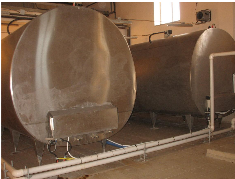
Рис. 3.6. Танки-охолодники фірми ДеЛаваль на 32 т молока

сортом екстра. Перевозять молоко в автоцистерні, яку після завантаження молока пломбують, на реалізоване молоко оформляється товарно-транспортна накладна.