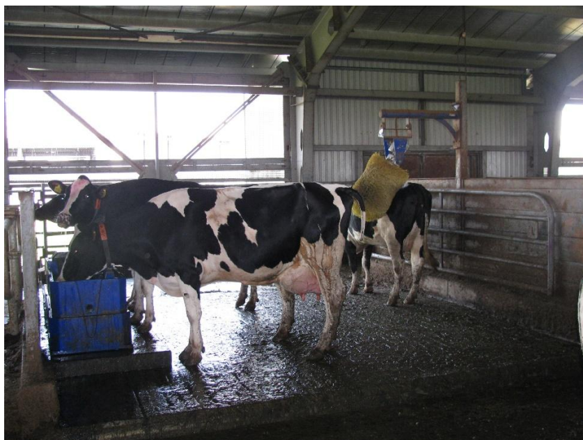
Рис. 3.4. Автонапувалка

Доїння корів проводиться в 2 доїльних залах обладнаних доїльною установкою типу Паралель 2x36 фірми DeLaval (рис. 3.5) триразово: один цикл доїння триває близько 5 годин після чого протягом години в них проводиться прибирання та миття.