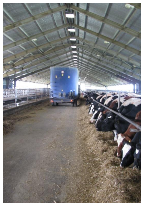
Рис. 3.6. Кормороздавачі

Кормороздавачі ефективно подрібнюють корми, які входять у склад раціону перемішують і рівномірно роздають на кормовий стіл.