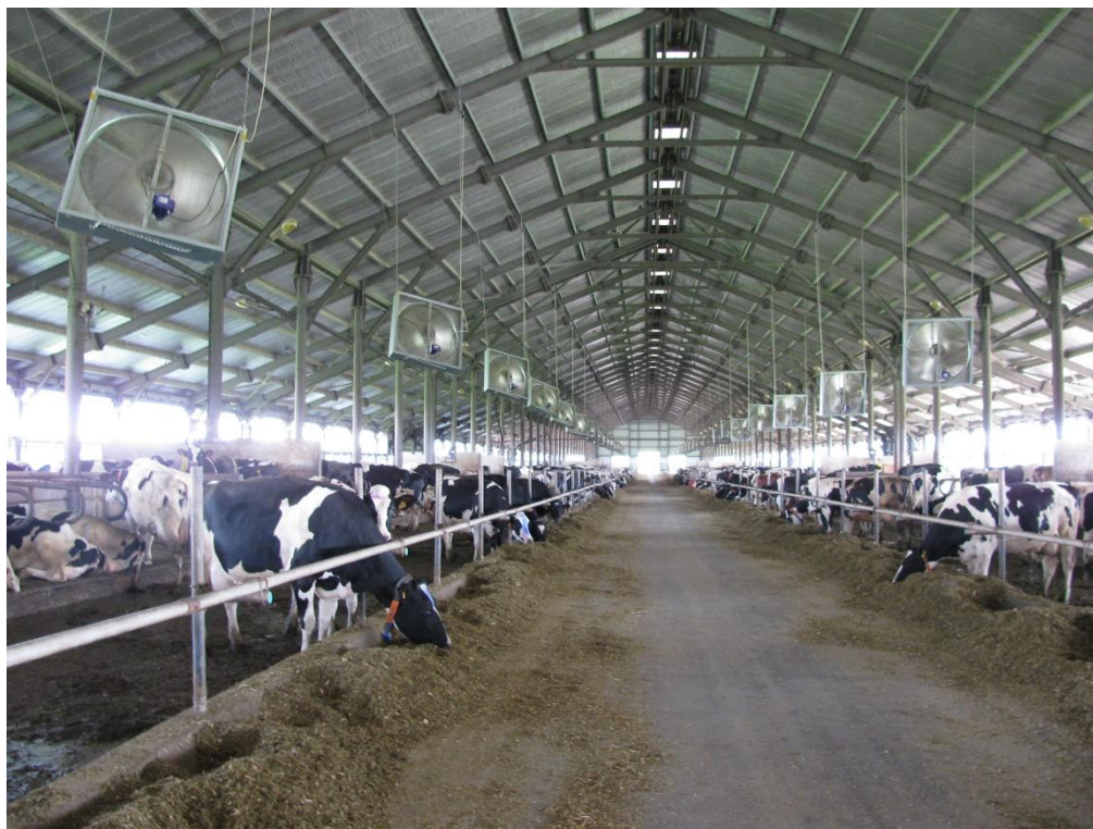
Рис. 3.2. Безприв'язно-боксовий спосіб утримання

Застосовують стійлово-боксовий спосіб утримання корів. Їх утримують у 4-х приміщеннях розрахованих на 1000 скотомісць кожне, які розділені на 4 секції по 250 голів (рис 3.2). Корівники сполучені між собою перехідною галереєю, яка веде в доїльні зали.