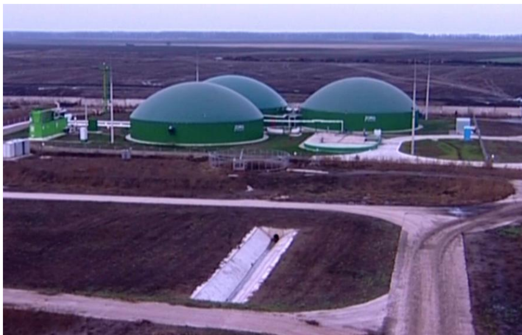
Рис. 3.3. Біогазова станція «ZORG»

Прибирання гною здійснюється тричі на добу механізовано система флеш-флюом, далі гній поступає у ферментатор біогазової установки з подальшим переміщенням в сховища для зберігання (9 сховищ по 10000 кубів (рис. 3.3).