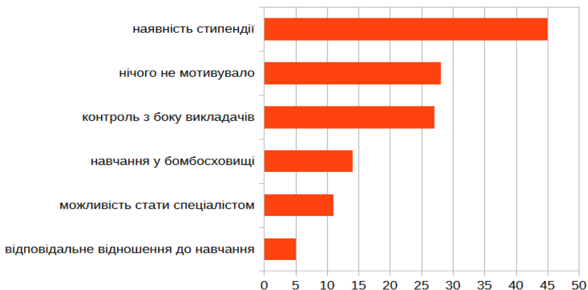
Рис. 2.1 «Що впливає на мотивацію навчатись під час воєнної агресії», %

фахового коледжу ім. Є.Храпливого НУБіП України, у тому числі 6 студентів, які втратили батьків під час захисту країни. Студенти могли відзначити декілька варіантів, які вважали для себе об'єктивними. Результати опитування представлені на рис. 2.1.