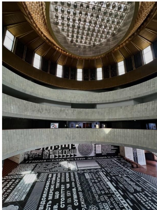
Рисунок. 2.3. Національний центр «Український дім»

реалізовувати різноманітні проєкти – від історичних експозицій до експериментальних мистецьких практик. М. Балаклицький підкреслює, що «Український дім як виставковий простір має особливе символічне значення для презентації українського мистецтва, оскільки сама будівля є важливим маркером національної ідентичності» [2, с. 57]. З погляду фоторепортажу, цей простір цікавий своєю архітектурною виразністю, особливо внутрішнім атриумом із характерним освітленням, що створює специфічний візуальний контекст для експозицій.