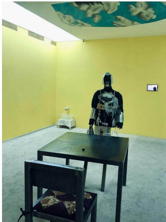
Рисунок 3.1. Експозиція в PinchukArtCentre

Створення якісного фоторепортажу про мистецькі виставки починається з ретельного підходу до вибору локацій для фотозйомки. Цей етап є фундаментальним, оскільки визначає змістовне наповнення та візуальну різноманітність майбутнього матеріалу. Як зазначає М. Балаклицький, «вибір локацій для фоторепортажу – це первинний кураторський акт фотожурналіста, який формує концептуальну рамку всього проєкту» [2, с. 68]. В контексті висвітлення мистецького життя Києва цей вибір має бути обумовлений не лише естетичними якостями виставкових просторів, а й їх культурною значущістю та репрезентативністю щодо сучасних мистецьких тенденцій.