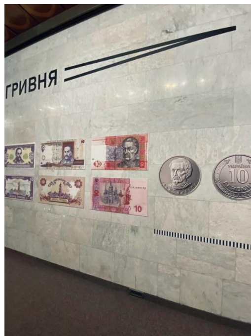
Рисунок 2.9. Експозиція, присвячена історії української гривні

Рис. 2.9. демонструє експозицію, присвячену історії української гривні – важливого символу національної ідентичності та державності. Ця експозиція, що поєднує історичний наратив із сучасними формами представлення, є прикладом мистецького осмислення національних символів у контексті міського культурного простору. Фоторепортер має відобразити цей взаємозв'язок між символічним змістом та формою представлення, створюючи візуальний наратив, що передає культурну значущість експозиції.