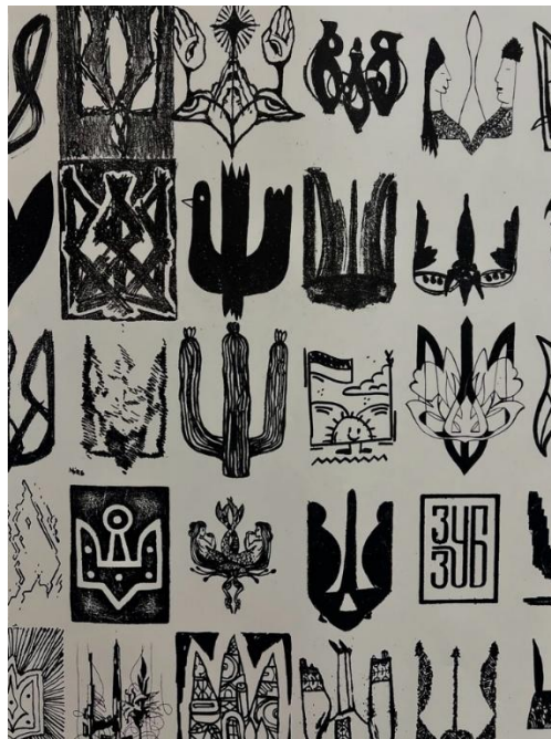
Рисунок 2.5. Інтерпретація національного символу

Як демонструє Рис. 2.5., сучасні мистецькі практики часто працюють із символічними аспектами української ідентичності, переосмислюючи їх у контексті урбаністичного простору. Серія графічних робіт, що представляє різноманітні інтерпретації національного символу – тризуба, відображає цю тенденцію. Фоторепортаж має зафіксувати цей концептуальний вимір експозиції, створюючи візуальний наратив, що розкриває взаємозв'язок між національною ідентичністю та міським контекстом.