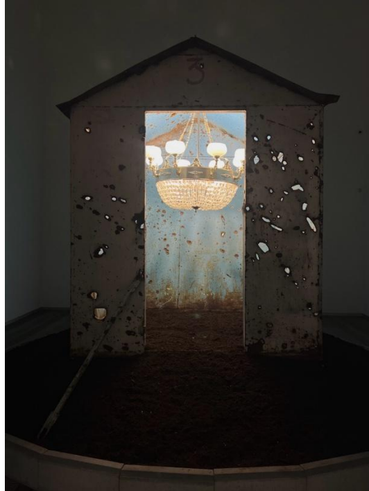
Рисунок 3.7. Фотографія, зроблена у складних світлових умовах