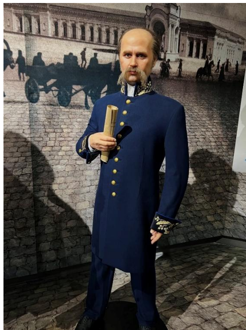
Рисунок 2.6. Історична постать Тараса Шевченка

Історичне осмислення урбаністичних трансформацій також є важливим аспектом «нової хвилі» мистецьких практик Києва. Виставки, присвячені історії міського розвитку, зниклим архітектурним об'єктам, зміні міських ландшафтів, створюють важливий контекст для розуміння сучасних процесів. На Рис. 2.6. представлена інсталяція із зображенням історичної постаті Тараса Шевченка, що демонструє взаємодію історичного нарративу із сучасним мистецьким висловлюванням. М. Максимович зазначає, що «звернення до історичних вимірів міського простору дозволяє художникам створювати багаторівневі наративи, що поєднують минуле і сучасне, формуючи новий тип діалогу з аудиторією» [18, с. 39]. Фоторепортер має відобразити ці часові виміри експозиції, створюючи візуальний наратив, що пов'язує різні історичні періоди та культурні контексти.