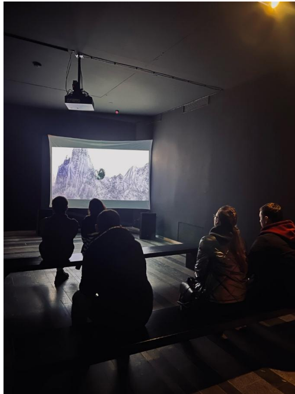
Рис. 3.3. Взаємодія відвідувачів із експозиціями

висвітленні інтерактивних інсталяцій та перформативних практик, які активно включають глядача у творення мистецького досвіду.