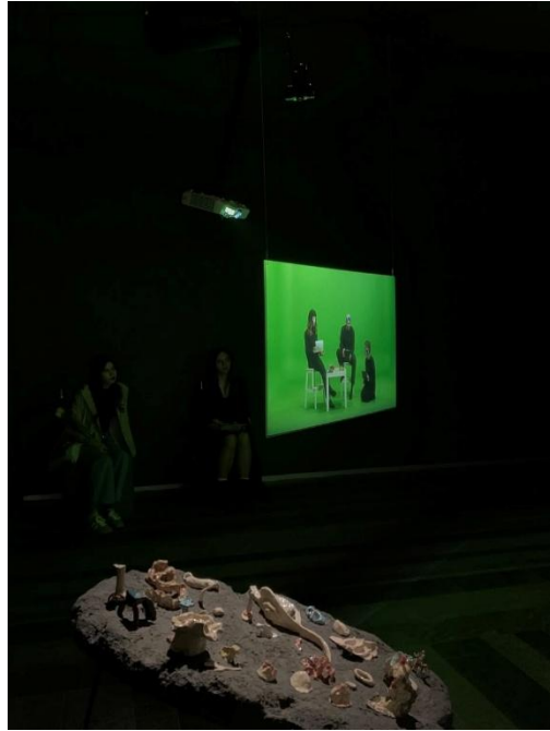
Рисунок 3.5. Момент колективного сприйняття відеоінсталяції

Концептуальна цілісність репортажу досягалася через виявлення візуальних та смислових зв'язків між різними експозиціями. Рис. 3.6. демонструє мистецьку інсталяцію, що поєднує елементи цифрового медіа та фізичних об'єктів, відображаючи гібридну природу сучасного мистецтва. Ця візуальна стратегія дозволила створити наскрізні тематичні лінії, що об'єднують різноманітні виставкові проєкти в цілісну розповідь про мистецьке життя міста. Жан Марі-Шаппе зазначає, що «послідовність зображень у фоторепортажі створює власну наративну структуру, яка може як відповідати хронології події, так і вибудовувати альтернативні смислові зв'язки» [19, с. 78].