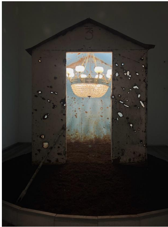
Рис. 3.4. Інсталяція в PinchukArtCentre

Важливим аспектом створення візуального репортажу стала передача атмосфери виставкових просторів через композиційні рішення та колірну гаму. Я. Табінський зазначає, що «колір у фоторепортажі про мистецькі події є не просто естетичним елементом, а важливим інформаційним каналом, що передає емоційну складову експозиції» [24, с. 73]. Послідовне використання кольору як виразного засобу дозволяє створити емоційний наратив, що доповнює інформаційний вимір репортажу.