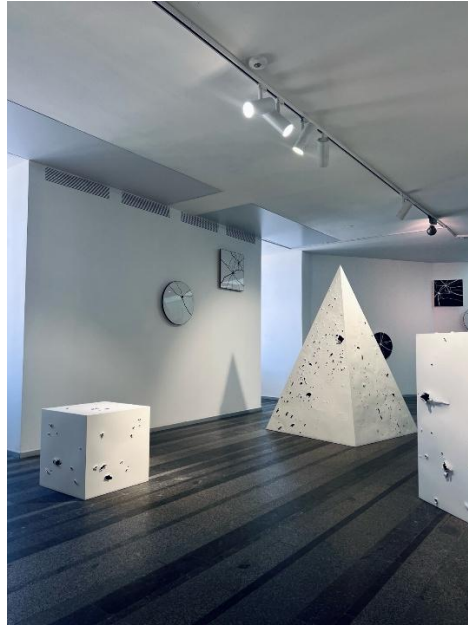
Рисункок 3.6. Мистецька інсталяція, що поєднує елементи цифрового медіа та фізичних об'єктів

При створенні репортажу було використано як документальний підхід, спрямований на точну фіксацію експонатів і експозиційних рішень, так і більш інтерпретативний підхід, який підкреслює суб'єктивне сприйняття та емоційний вимір виставок. Цей баланс між об'єктивністю та суб'єктивністю дозволив створити матеріал, що поєднує інформативність із образністю, звертаючись одночасно до раціонального та емоційного сприйняття аудиторії.