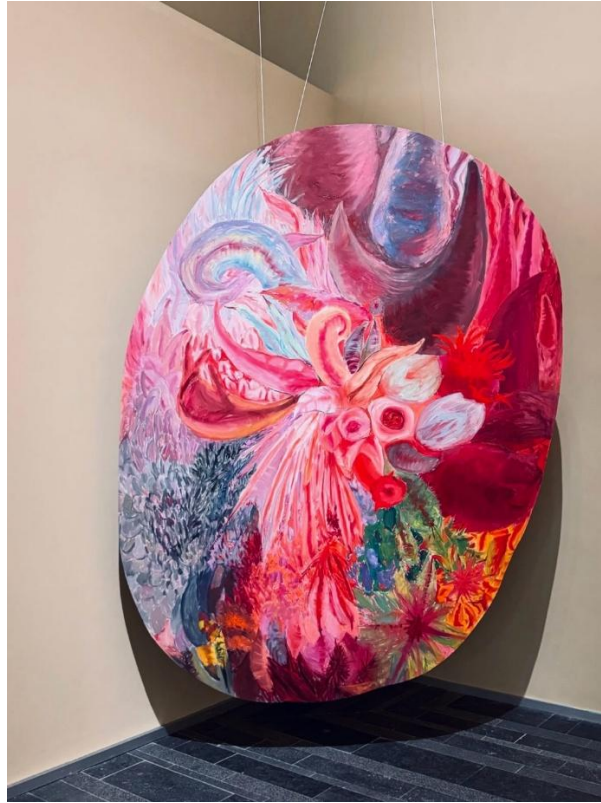
Рисунок 3.2. Експозиція в PinchukArtCentre

створює особливі умови для фотозйомки (Рис. 3.1. та Рис. 3.2.). Простір характеризується ахроматичним дизайном, спрямованим точковим освітленням та чіткими геометричними формами, що вимагає особливої уваги до композиції кадру та роботи зі світлом. С. Горевалов підкреслює, що «мінімалістичний дизайн сучасних виставкових просторів створює своєрідний виклик для фотографа, змушуючи шукати нюанси та акценти, які б передавали унікальність експозиції» [10, с. 192].