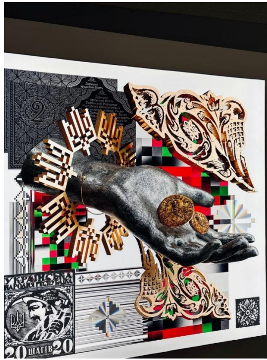
Рисунок 2.4. Інсталяція

Для систематизації інформації про головні публічні покази сучасного мистецтва Києва та особливості їх представлення у фоторепортажі пропонуємо таблицю, що відображає ключові інституції та їхні характеристики.