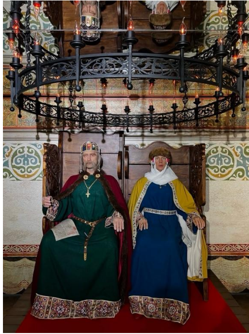
Рисунок 2.7. Експозиція, присвячена історичним постатям

Важливим аспектом «нової хвилі» урбаністичного мистецтва Києва є його освітній вимір. Виставкові проекти часто супроводжуються освітніми програмами, воркшопами, дискусіями, що залучають аудиторію до активної взаємодії з мистецтвом та урбаністичною проблематикою. Жан Марі-Шаппе зазначає, що «освітній компонент мистецьких проектів створює новий тип комунікації з аудиторією, де глядач стає активним учасником мистецького процесу, а не пасивним споживачем» [19, с. 64]. Фоторепортаж про такі проекти має фіксувати цей освітній вимір, відображаючи моменти взаємодії, обміну думками, колективної творчості.