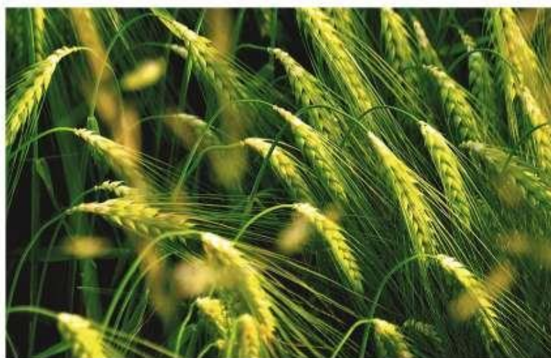
Рис. 1.1. Зовнішній вигляд [3]

Кущіння. Поява нових пагонів із вузла кущіння означає нову фазу росту рослин — кущіння. Головний вузол кущіння розташований у ґрунті на глибині 2–3 см, залежно від його типу і вологості. Початок кущіння у ячмені зазвичай збігається із появою третього листка. Надалі частина стебел нормально розвивається (особливо перші пагони), інша частина через нестачу вологи, поживних речовин та інших факторів залишається безплідною, формуючи підгони та підсіди. У зв'язку з цим розрізняють продуктивне кущіння, тобто кількість пагонів на рослині з плодоносними суцвіттями, і загальне — кількість усіх пагонів на рослині. Продуктивна кущистість у нормально загущених посівах ячменю ярого у середньому становить 1,5–3. Вищою вона буває у ячмені озимому, у якого кущіння відбувається протягом тривалішого часу — восени і навесні [3].