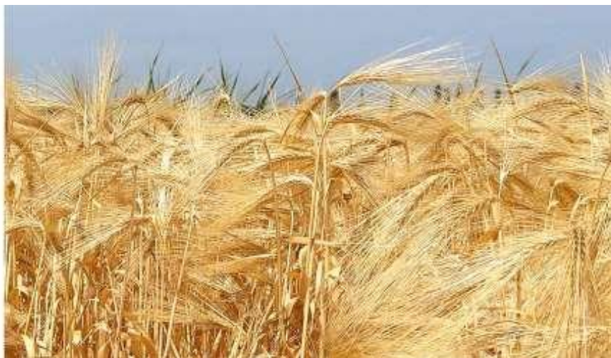
Рис. 1.2. Зовнішній вигляд [10]

восени рослини переростають, фаза кущіння в яких завершується, і рослини починають виходити в трубку.