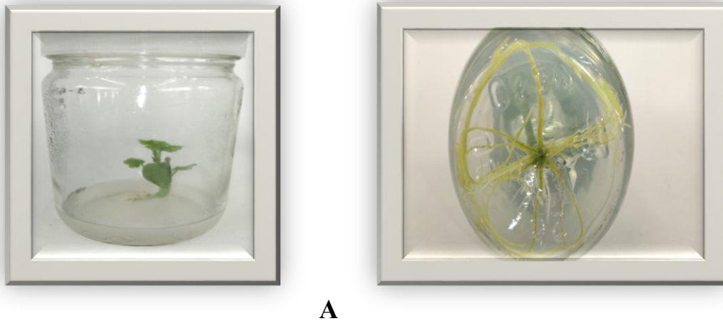
Рисунок 1. Кавун в культурі in vitro : А – стерильна рослина кавуна; Б – коренева система кавуна

Варто відзначити, що вдало підібрані схема стерилізації експлантів кавуна та живильне середовище дали можливість отримати добре зростаючі стерильні проростки кавуна (Рисунок 1. Кавун в культурі in vitro : А – стерильна рослина кавуна; Б – коренева система кавуна)