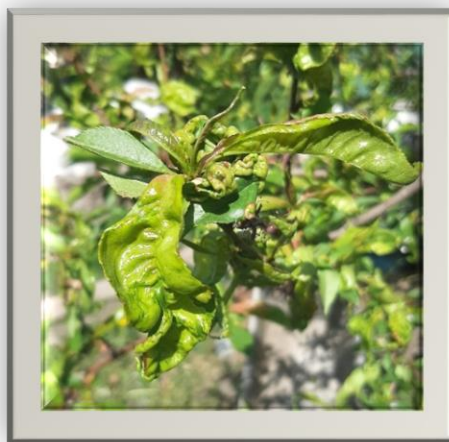
Рис. 1 Кучерявість листків персика

Кучерявість листків (збудник - Taphrina deformans ), одне з найшкідливіших захворювань персика. Хвороба поширена у всіх регіонах вирощування персиків, в Україні досить поширена у південних та південно-західних областях [1].