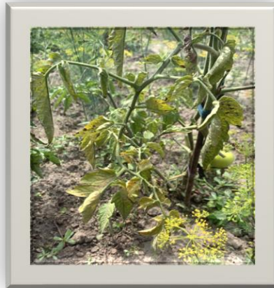
Рис.1. Ознаки фітофторозу томатів на сорті Ісполін

Розвивається фітофтороз надшвидко, за менше ніж 2 тижні може заразити всі рослини на величезному полі та привести втрати до 70% врожаю. З уражених рослин з дощем і вітром, через інструменти, закладені в компост рослинні рештки, спори потрапляють в землю та коріння, розносяться на величезні території, де знову зберігаються до наступного циклу розвитку [2].