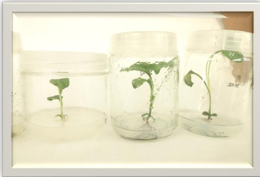
Рис. 1. Echinacea в культурі in vitro

Ефективність стерилізації Echinacea становить – 100 %. Слід зазначити, що проростання насіння в in vitro проходить повільно.