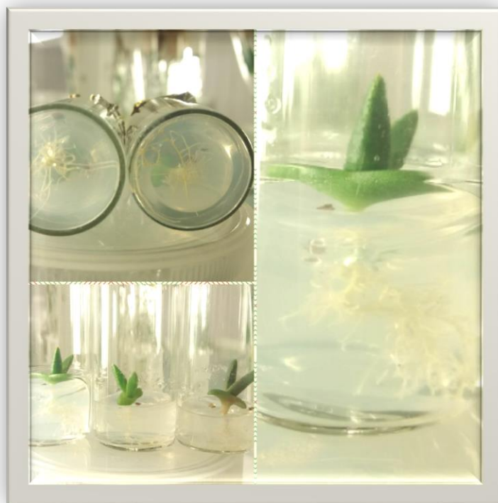
Рис. 1. Aloinopsis rubrolineat в культурі in vitro

Слід зазначити, що ефективність підібраної стерилізації становить – 97 %. Крім того, через 14 діб стерильне насіння Aloinopsis rubrolineat почало проростати. Для проростання насіння та його розвитку цілком прийнятним є тверде агаризоване живильне середовище відповідно до базового пропису Мурасіге-Скуга. Через 30 діб культивування Aloinopsis rubrolineat , ми отримали добре зростаючі, сформовані сукулентні рослини з двома стравжніми листками та сформованою мичкуватою кореневою системою (рис. 1).