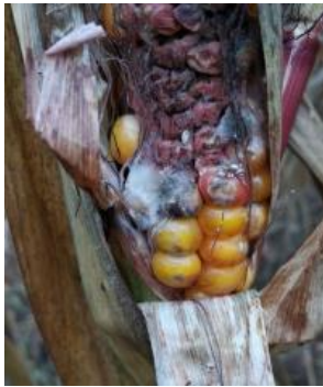
Рис. 1. Фузаріоз качанів кукурудзи (Олійник В.С.).

Фузаріоз є надзвичайно шкідливою хворобою. Уражене насіння кукурудзи втрачає схожість, а зі здоровим зародком дає слабкі ростки, які, як правило, гинуть, не досягнувши поверхні ґрунту. Насіння кукурудзи уражене фузаріозом не утворює сходів, а якщо зародок не пошкоджений, воно проростає із запізненням, формує слабкі паростки, які часто гинуть до виходу на поверхню ґрунту. Необхідно зауважити, що частина зернівок у хворому качані, які знаходяться на достатній відстані від фузаріозного осередку без видимих зовнішніх ознак ураження, є часто інфікованими [2].