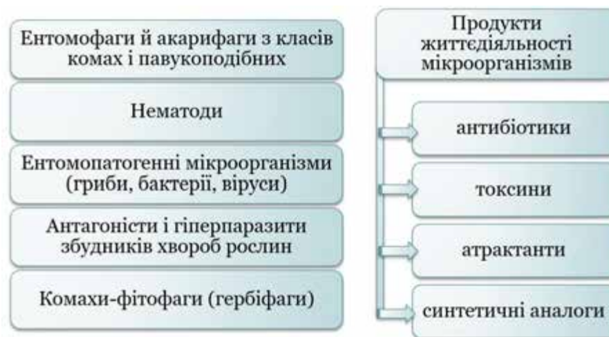
Рис. 1. Комплекс біологічних засобів для захисту рослин [1]

Погіршення стану сільськогосподарських угідь призвело до того, що з кожних 10 гектарів в задовільному стані наразі знаходиться лише один, що в майбутньому може призвести до проблем із забезпеченням населення країни продовольчими ресурсами. Відомо, що в окремі роки втрати врожаю від шкідників, хвороб і бур'янів в можуть досягати 20–30% [1]. Одним з ефективних шляхів вирішення цієї проблеми є впровадження сучасних агротехнологій вирощування сільськогосподарських культур, складовим елементом яких є біологічний захист рослин, який передбачає отримання екологічно безпечної продукції високої якості за умови збереження біологічного різноманіття біоценозів шляхом використання проти шкідливих організмів їх природних ворогів та продуктів їхньої життєдіяльності (рис. 1).