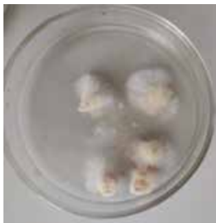
Рис. 2. Зараження насіння фузаріозом (Олійник В.С.).

Не можна нехтувати хімічними заходами захисту. Необхідно протруювати насіння перед посадкою, наприклад, можна застосувати системний, контактний-проникаючий протруйник Максим Кватро. При посіві у ранні строки дуже висока вірогідність пліснявіння насіння, ураження фузаріозом, тоді можна використати комплексний протруйник