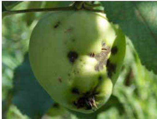
Рис.1. Парша на плоді яблуні

Причини виникнення: разносять птахи, комахи, пориви вітру; інтенсивне вирощування дерев, якщо порушена схема посадки — суперечки швидко переносяться з хворих екземплярів на здорові; вологий клімат при температурі вище 0 ° С і нестабільними погодними умовами.