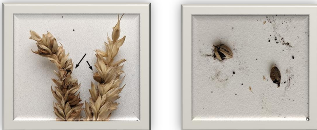
Рис. 1. а - уражене насіння твердою сажкою в колосі пшениці; б – сорус з теліоспорами

Для ідентифікації збудників сажкових хвороб у насінні необхідно застосовувати спеціальні методи. Наприклад, для виявлення зараженості летючої сажки використовують метод аналізу зародків, де і локалізується інфекція. Для виявлення твердої сажки пшениці проводять аналіз наявності спор патогенного організму на поверхні насіння (рис. 1) [1,2].