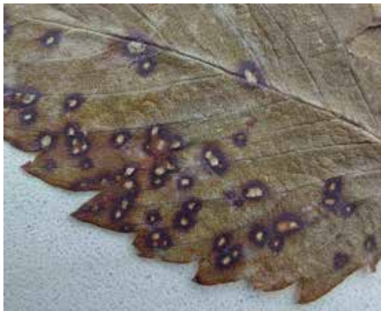
Рис.1. Біла плямистість на листковій пластинці суниці

Хвороба проявляється на різних органах рослин – листках, черешках, квітконосах і плодоніжках вже на