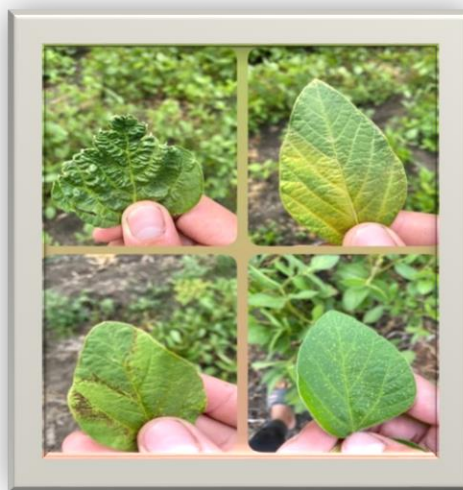
Рис. 1. Хвороби сої в умовах Дністровського району Чернівецької області

Результати досліджень: Хвороби проявляються у вигляді ураження листків, що деформуються, нерівномірно розростаються, плямистостями, хлорозом. Аскохітоз і фузаріоз уражають проростки, сходи та дорослі рослини. Церкоспорозом уражаються листя, утворюючи рівномірно розташовані округлі плями (3–6 мм), спочатку коричневі, потім білувато-сірі з виразною бурою облямівкою, з нижньої сторони утворюється темно-сірий наліт. Антракноз – на кореневій і прикореневій частинах стебла антракноз проявляється у вигляді темно-коричневих плям або смуг. Септоріоз – поширюється знизу вгору по рослині. На листі утворюються червонувато-бурі великі плями неправильної форми, обмежені жилками й оточені хлоротичною зоною. Несправжня борошниста роса - на сім'ядолях і особливо на листках з'являються хлоротичні ділянки, які розташовані вздовж жилок і охоплюють всю поверхню або частину біля основи листка. Хворі рослини дуже відстають у рості, на них мало листя і бобів. Фузаріоз на сої проявляється у формі кореневих гнилей, трахеомікозного в'янення та гниття бобів.