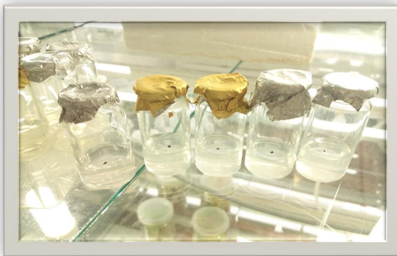
Рис. 1. Стерильне насіння Lophophora williamsii на МС (14-а доба культивування)

Розмноженню різних представників родини кактусових в асептичних умовах присвячено багато наукових робіт. Основна умова отримання стерильної рослини – це підбір стерилізуючого розчину та часу стерилізації. Для отримання асептичної культури Lophophora williamsii , в якості експланта ми використали насіння (розмір до 1 мм). Насіння Lophophora williamsii стерилізували розчином білизни у співвідношенні 1:3 (20 хв.). Живильне середовище для введення в культуру Lophophora williamsii – Мурасіге-Скуга [2].