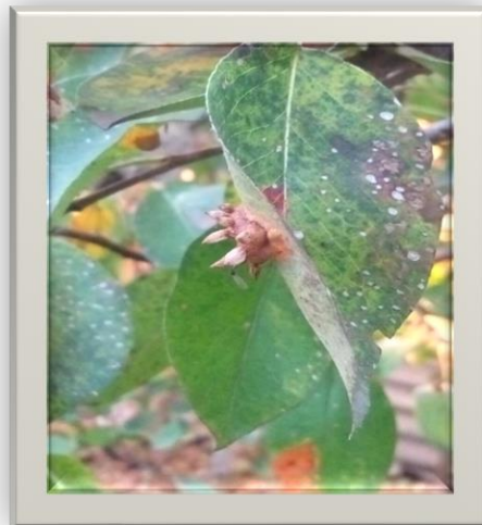
Рис.1. Еціоспори на ураженому листі груші

За результатами обстежень останніх років іржу груші виявлено на присадибних ділянках по всій території Київської області. За даними науковців, площа, на якій виявлено збудника хвороби в області складає 71,2 га