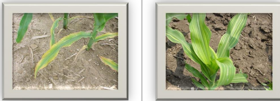
Рис. 1. Ознаки хлорозу на кукурудзі

Неінфекційні захворювання можуть викликати такі симптоми, як в'янення, відставання в рості, пожовтіння, деформація рослинної тканини або загибель рослинної тканини. Симптоми неінфекційних захворювань часто нагадують симптоми, викликані комахами або збудниками. Наприклад, симптоми дефіциту поживних речовин можуть нагадувати симптоми захворювання кореневою гнилі.