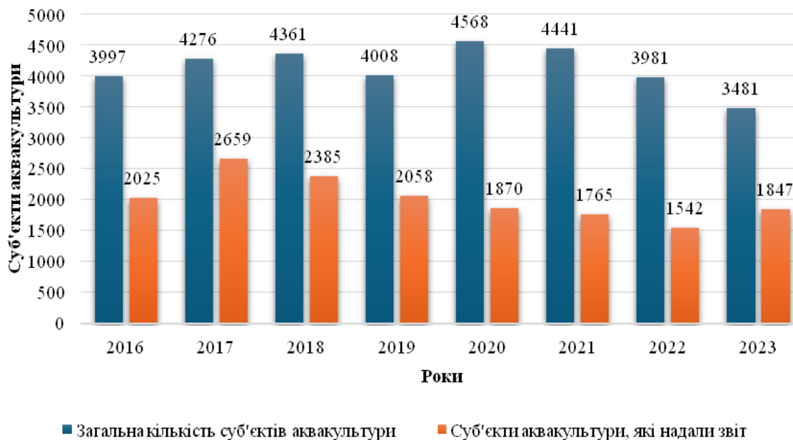
Рис. 1. Суб'єкти аквакультури які надали звітність у період з 2016 р. до 2023 р.

Нова форма значною мірою враховує положення Регламенту (ЄК) № 762/2008 Європейського Парламенту та Ради від 09.07.2008 про надання державами-членами статистичних даних з аквакультури та про скасування Регламенту Ради (ЄК) № 788/96. Втім низка недоліків, які було відзначено експертами за застосування попередньої форми, лишились. Ступінь звітування суб'єктів аквакультури лишається доволі низьким, є питання щодо достовірності наданої інформації. Україна отримує статистичні дані, що можуть не відповідати дійсності, а лише вказує на деякі тенденції процесів розвитку. Крім того, у 2023 р., як і в 2022 р., до звичайних, традиційних проблем функціонування галузі, які впливали на обсяги, різноманіття та якість виробництва продукції аквакультури України додався воєнний стан з багатоплановими впливами не лише на українську економіку, а й економіку інших держав, які часто є постачальниками витратних матеріалів для українського рибництва. За даними територіальних органів Держрибагентства за 2023 рік, кількість суб'єктів аквакультури становить 3 481 підприємство різних форм власності, з них надали звітність за формою № 1А-аквакультура (річна) 1 847 таких підприємств або 53,06 % загальної кількості суб'єктів аквакультури; у 2022 році ступінь звітності становив 38,73 %, тобто доволі суттєво зріс (рис. 1).