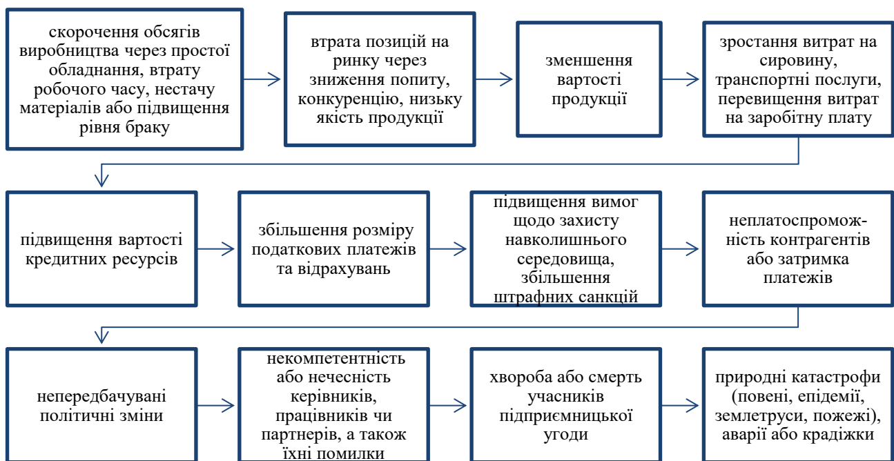
Рисунок 1. Фактори, що сприяють зниженню прибутковості підприємства

У сучасних ринкових умовах підприємницька діяльність невіддільна від ризику. Він визначає можливість втрат або недоотримання прибутку, але водночас відкриває нові перспективи. Економічна нестабільність, конкуренція та швидкі зміни технологій роблять управління ризиками ключовим фактором успіху підприємця (рис. 1). У Законі України «Про підприємництво» [3] зазначається, що підприємництво є діяльністю, яка здійснюється на власний ризик. Підприємницький ризик визначається як ймовірність виникнення втрат або недоотримання очікуваного прибутку порівняно з прогнозованими показниками; іншими словами, це невизначеність щодо очікуваних доходів [2].