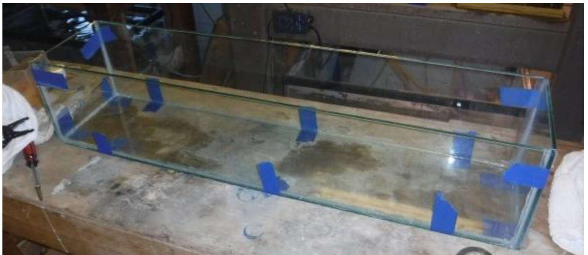
Рис. 3.1. Акваріум для майбутнього біотопу з над прозорого скла

Етап № 1. Вибір резервуара. Для даної системи найкраще підійде акваріум на довжина*ширина*висота 90*40*40 об'ємом 144 л (рис. 3.1).