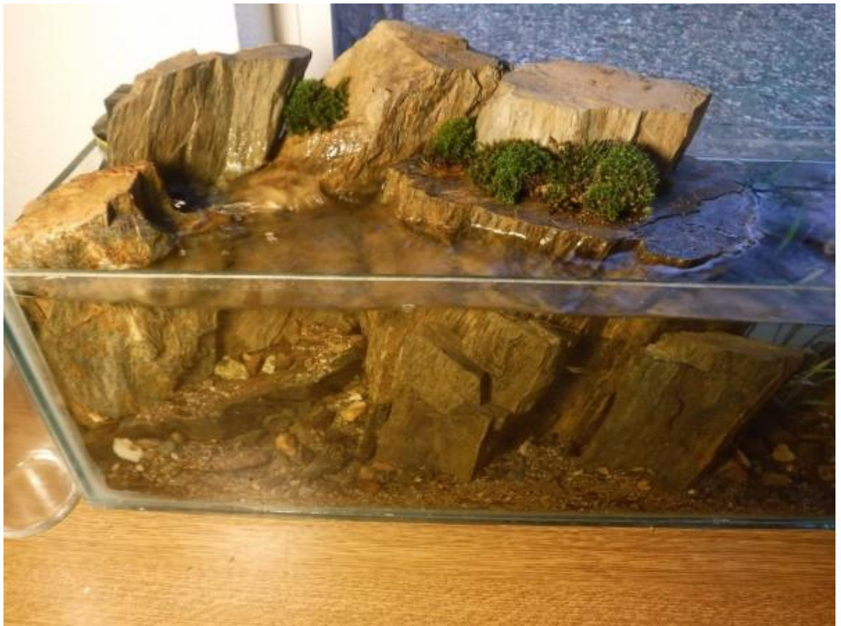
Рис. 3.5. Декорування каміння мхами