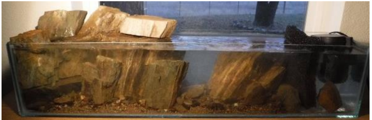
Рис. 3.3. Додаткове додавання елементів та заповнення водою

Етап № 3. Додавання додаткових елементів та заповнення водою (рис. 3.3).