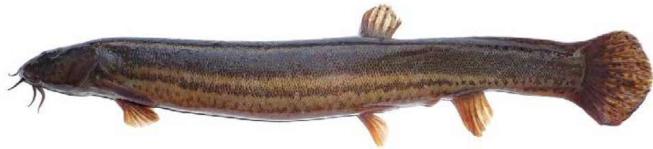
Рис.2.4. В'юн звичайний ( Misgurnus fossilis )

Розведення M. fossilis в акваріумі рідкісне через складність відтворення природних умов. Стимуляція нересту потребує сезонного охолодження води, зміни фотоперіоду, великої кількості живого корму. Ікру відкладають у зарості рослин або на м'який субстрат. Інкубація триває 3–5 діб. Личинки довго тримаються на субстраті, харчуються інфузоріями, а пізніше — дрібною артемією. Детальні біотехнологічні методи вирощування виду описані у роботах польських та чеських іхтіологів [8,9].