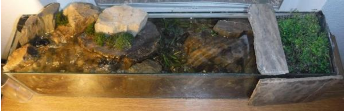
Рис. 3.6. Вигляд системи згори

Етап № 5 Вселення риби після 14 днів стабілізації системи (вигляд акваріума згори 3.6 та сбоку з рибками 3.7)