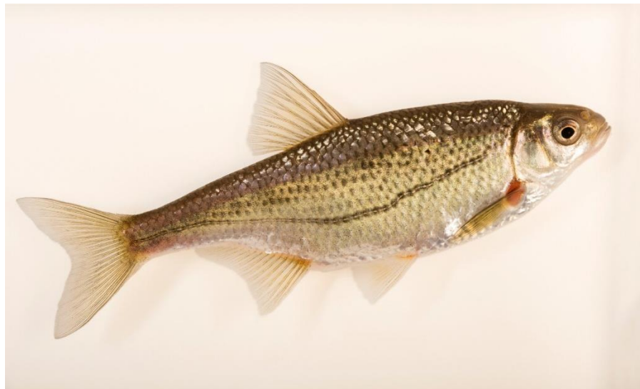
Рис.2.3. Бистрянка звичайна ( Alburnoides bipunctatus )

Розведення в умовах акваріума складне через вимоги до ікрометання в умовах течії. Нерест відбувається при температурі 16–20 °С, переважно у квітні–травні. Ікра відкладається на кам'янисті або гравійні ділянки дна, де заливається водою з високим вмістом кисню. Інкубація триває 5–7 діб. Вживання молоді залежить від чистоти води та наявності дрібного зоопланктону (інфузорій, ротиферів, артемії) [8].