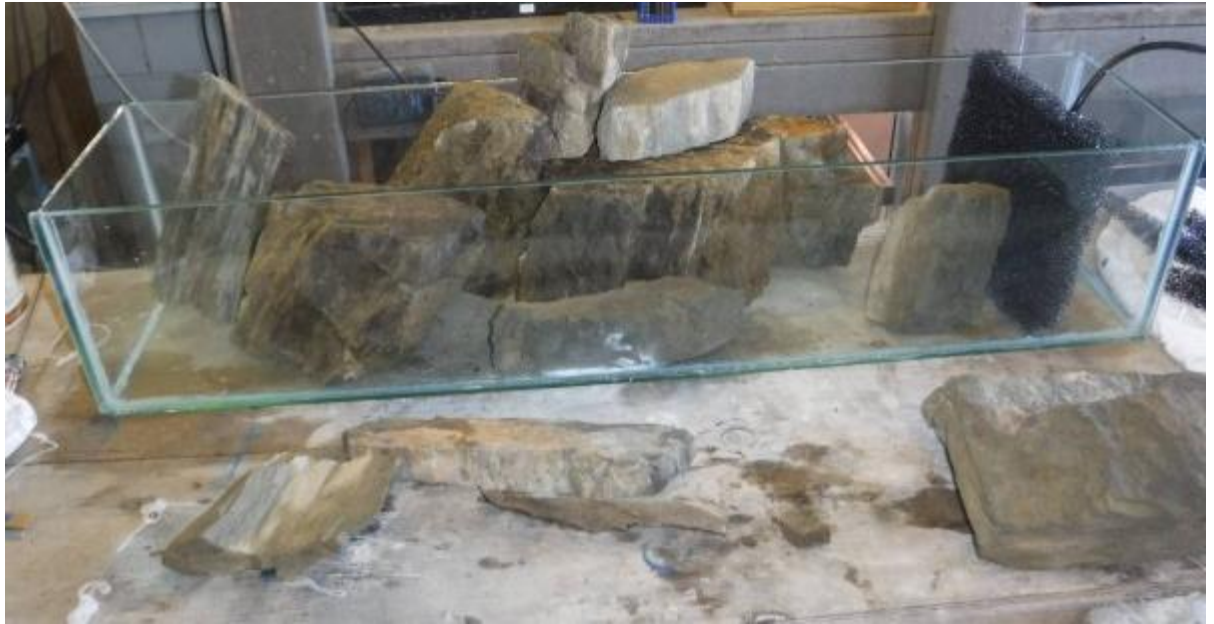
Рис. 3.2. Частково оформлений акваріум

Етап № 3. Додавання додаткових елементів та заповнення водою (рис. 3.3).