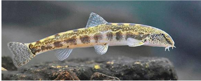
Рис.2.5. Щипавка (ряботюль) ( Cobitis elongatoides )

інфузоріями, згодом — наупліями артемії. Плодючість самки — до 100–150 ікринок. Детально біотехнологію розведення описано в роботах Central European cyprinid labs [7,9].