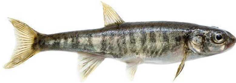
Рис.2.1. Мересниця річкова ( Phoxinus phoxinus )

знизити рівень води та імітувати приплив свіжої холодної води. Самці в цей час стають яскравішими. Ікра відкладається на гальку або мох. Інкубація триває 6–9 діб. Живлення мальків — науплії артемії, мікрочерви, інфузорії.