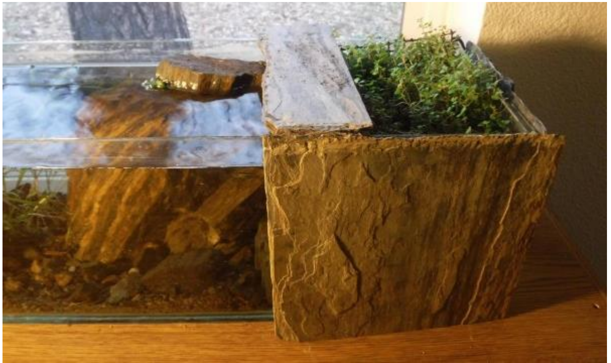
Рис. 3.4. Задекорований фільтрувальний відсік