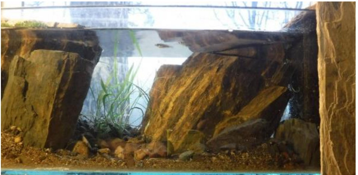
Рис. 3.7 Вигляд сбоку з мешканцями